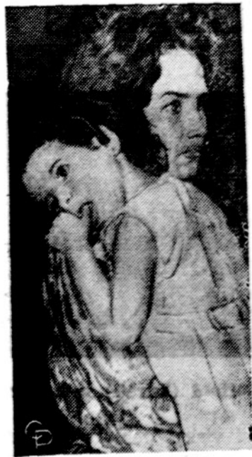
Kubieta moteris atvykusi iš Kubos į Key West, Fla. yra susirūpinusi, ties čia nors ir svingingas kraštas, tačiau vistiek ne savo tėvynė.