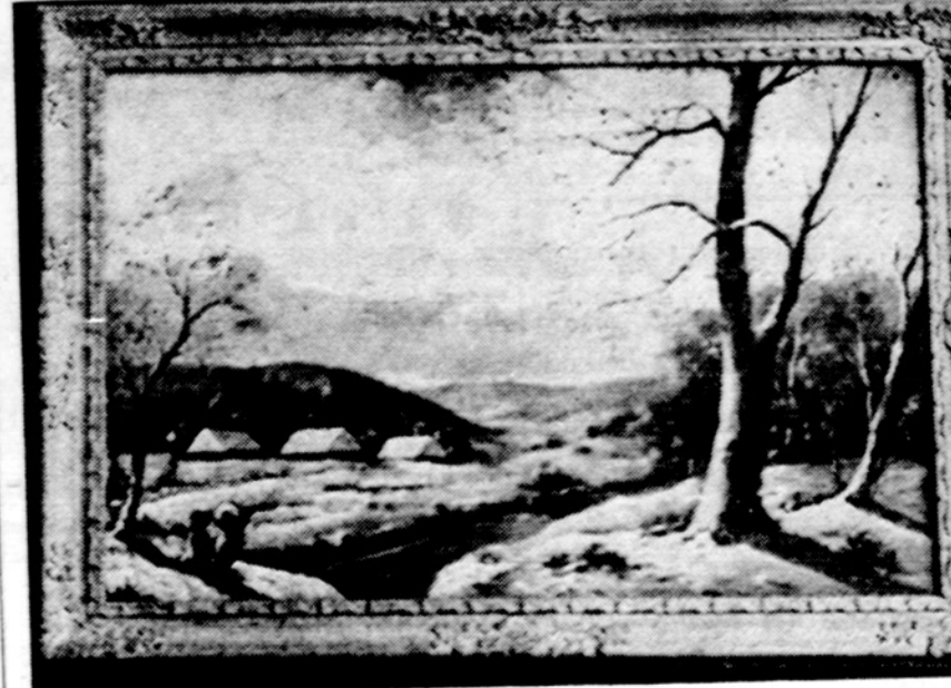
V. Ogilvio paveikslas Žiemos rytas.