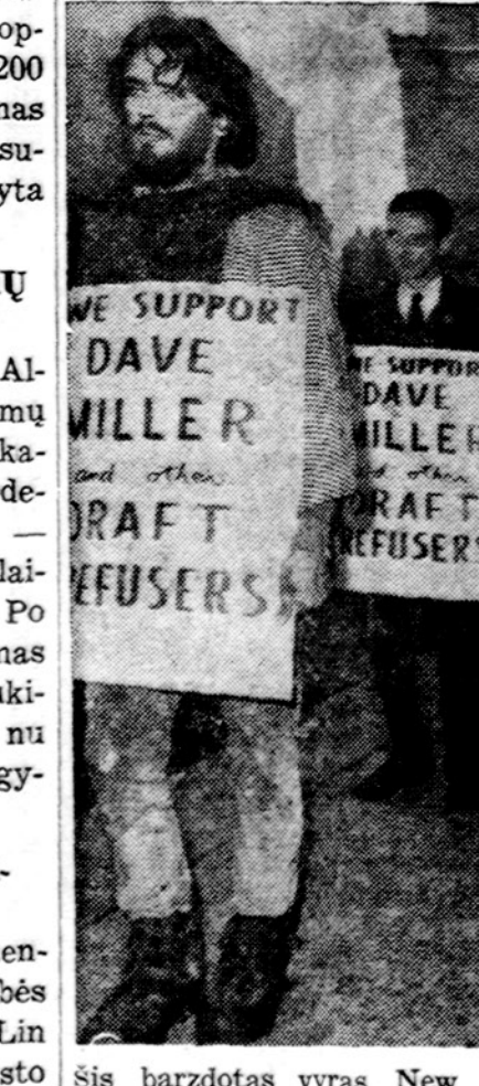
Šis barzdotas vyras New Yorke neša plakatą, kuriame sakosi remias tuos, kurie neina į armiją. Žurnalistai juokauja, kad šis vyras tikri turėtų patekti į armiją, kur būtų išpraustas ir apkirptas.

O greitosios pagalbos budėtoja šaukiančius klausinėjo todėl, kad įtarė, jog gal koki chuliganai šaukia. Kaune per pastaruosius tris mėnesius greitioji pagalba be reikalo buvusi iššaukta 142 kartus. Vilniuje kiekvieną parą eš vidutiniškai po 5—6 kartus iššaukia... greitąją pagalbą koki slapukai. Klaidėdų 3—4 kartus per dieną. Be to, dešimtimis atvejų iškvietai būna betiksliai, dėl menkniekių. Dėl to greitosios pagalbos budėtojai eš dezorientuoti. Vaistų prieš toki chuliganizmą, — sako "Komj. Tiesos" korespondentas, — kol kas niekas negali išrasti. (E.)