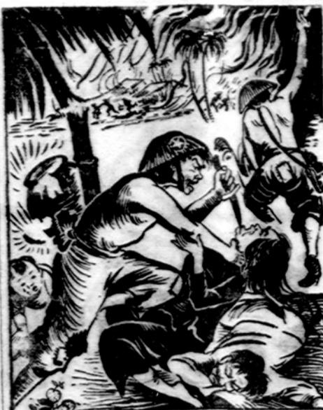
CÔNG PHÍ CŨO GIÓ TÀI MIỀN NAM...