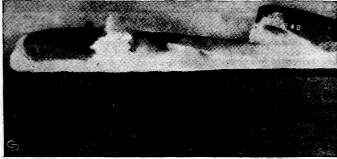
Naujas Polaris povandeninis laivas Benjamin Franklin išbandytas Atlante. Franklin, laivyno 30-tasis Polaris, įsijungė į laivyną.

VOL. XLIX Price 10¢ Printed in two parts PIRMADIENIS, MONDAY, LAPKRITIS, NOVEMBER 1, 1965 Šiandien Draugas 14 psl. Kaina 10 ct. Nr. 256