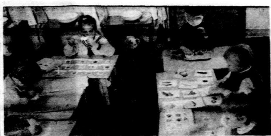
Grupė vaikų Am. Liet. Montessori D-jos Vaikų Nameliuose dirba su jusliu lavinamąja medžiaga. Kiekvienas pasirinko pagal amžių ir subrendimą jam atitinkamą užsiėmimą.

Popiežiaus Pauliaus VI New Yorke naudotas Lincoln Continental automobilis yra Chicagoj Fordo kompanijos žinioje. Automobilį galima pasisamdyti. Vienos dienos nuoma yra $62.