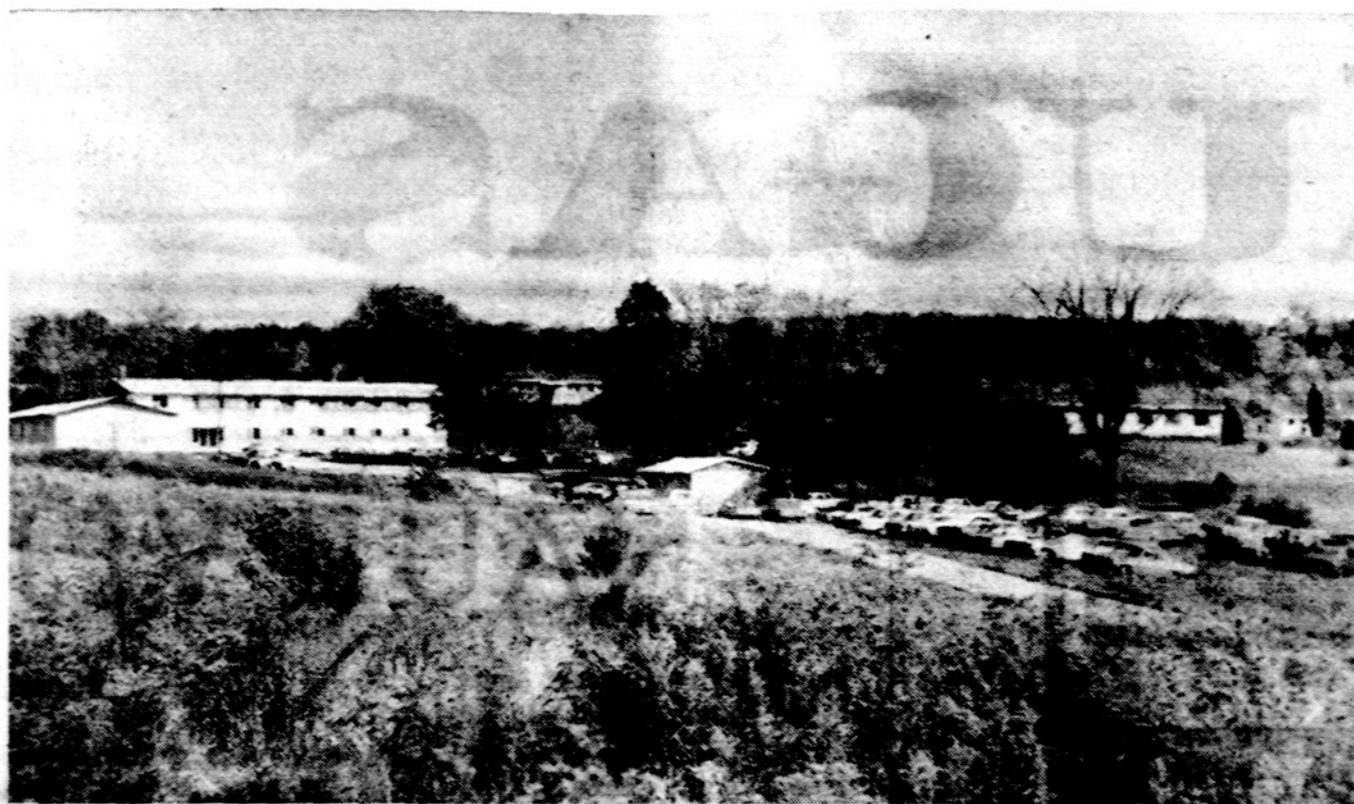
Dainavos stovykla rudenį.