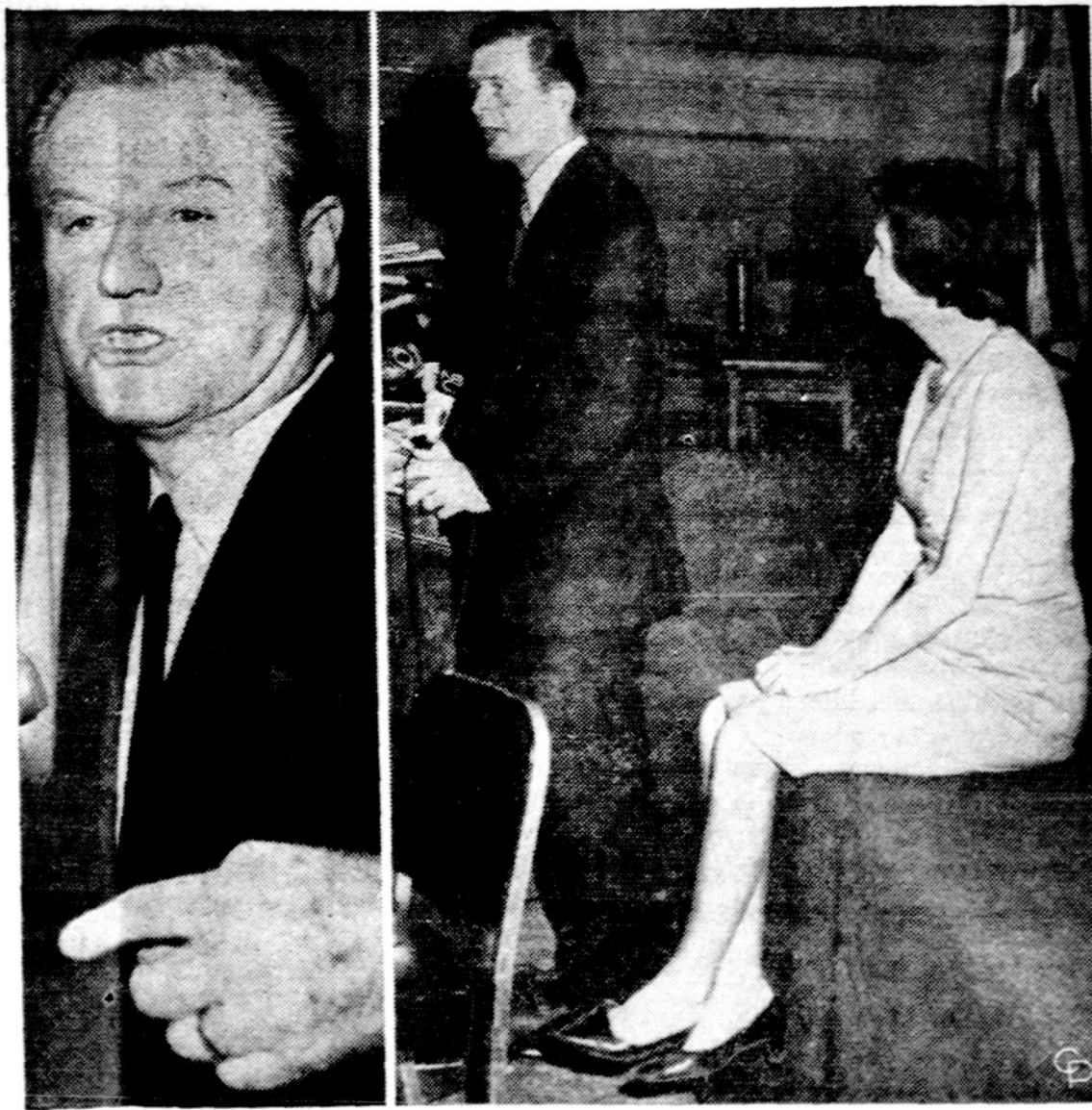
"Prezidentinio masto žmogus". — New Yorko Valstijos gubernatorius Nelsonas Rockefelleris (kairėje) pareiškė laikraštinkams, kad naujas New Yorko meras John Lindsay tinka į prezidentus, bet ne 1968 m. Lindsay (dešinėje) pasakė žurnalistams, kad jis neturįs ambicijos kandidatuoti į JAV-ų prezidentus 1968 ar 1972 m.

— Rodezijoje esąs paskelbtas nepaprastasis stovis.