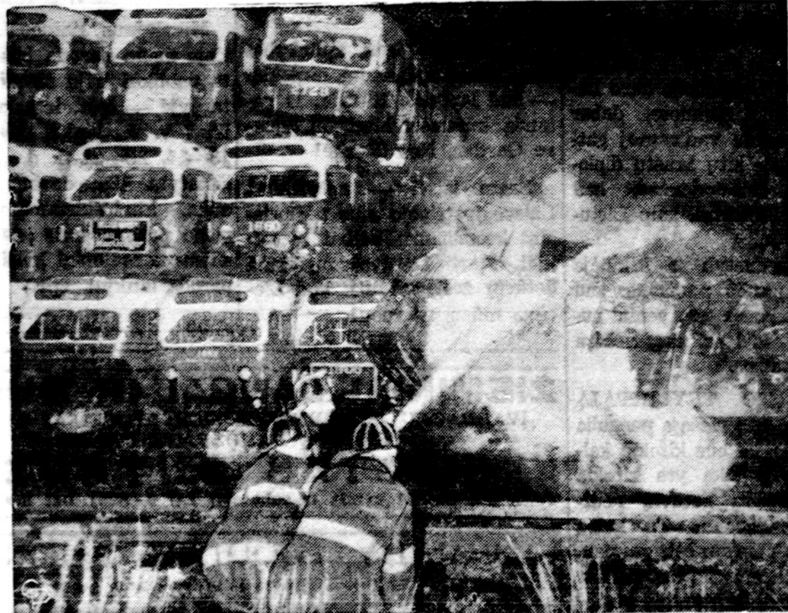
Ugniagesiai gesina New Yorke užsidesusį kiemą, kuriame sukrauti nebenaudojami autobusai.