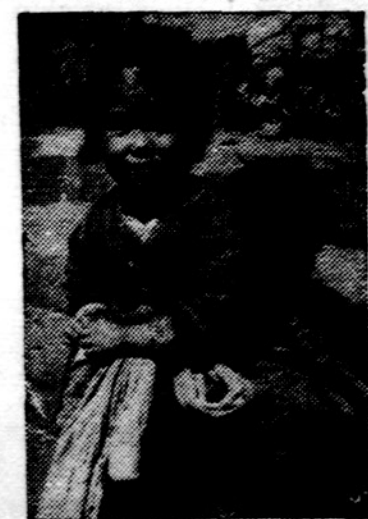
Šie du korėjiečiai vaikučiai, kurių tėvų namai paliko komunistinėj Korėjos dalyje, laukia pagalbos iš Amerikos Katalikų vyskupų fondo, kuris Padėkos savaitėje renka aukas.

rakterį kalboj, elgesy. Gyvenimo būdai yra skirtingi įvairiose provincijose, bet nacionalinis sentimentas liko bendras visiems. Bulių rungtynės yra jų nacionalinis laiko praleidimas, o "paseo" — kasdieniniai pasivaikščiojimai po parkus ir aikštes yra ilgų metų tradicija. Būdingas ispanų kaimo moterų aprėdas yra po skrybėle nešiojama skara, t.y. arabų ir berberų palikimas. Moterų drabužiams būdinga yra krūtininė skara, išsiuvinėta prijuostė ir mantila.