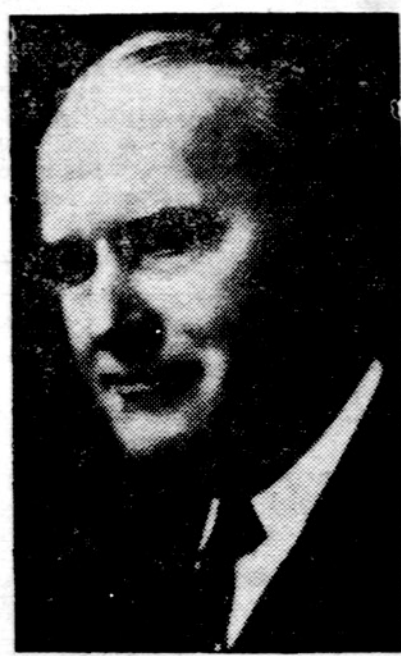
John J. Rooney (D., N.Y.), JAV Atstovų Rūmų narys, kalbės lapkričio 13 d. baltiečių jaunimo manifestacijoje New Yorke.

Japonijos komunistai ir jų šalininkai bando nuversti premjero Sato provokarietiška vyriausybę, kuri nori užmegzti diplomatinius santykius su Pietų Korėja.