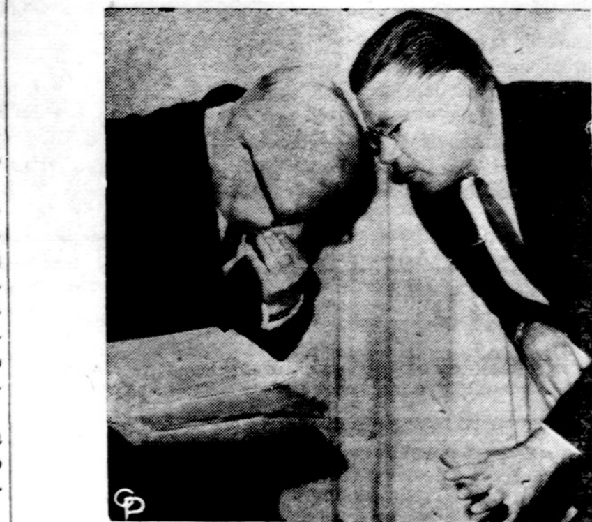
Gynbos sekretorius Robert McNamara (dešinėje) ir Izdo sekretorius pasikeičia žodžiais spaudos konferencijoje. Sekretorius McNamara, kalbėdamas Johnsono administracijos vardu, pasmerkė "nepateisinama" aluminio kainų pakėlimą ir pranešė, kad vyriausybė planuoja parduoti 200 tūkstančių tonų aluminio atsargų ateinančiais metais.

— Jungtinių Amerikos Valstybių kariniai lėktuvai vakar vėl daužė komunistų raketų bazes šiaurės Vietname.