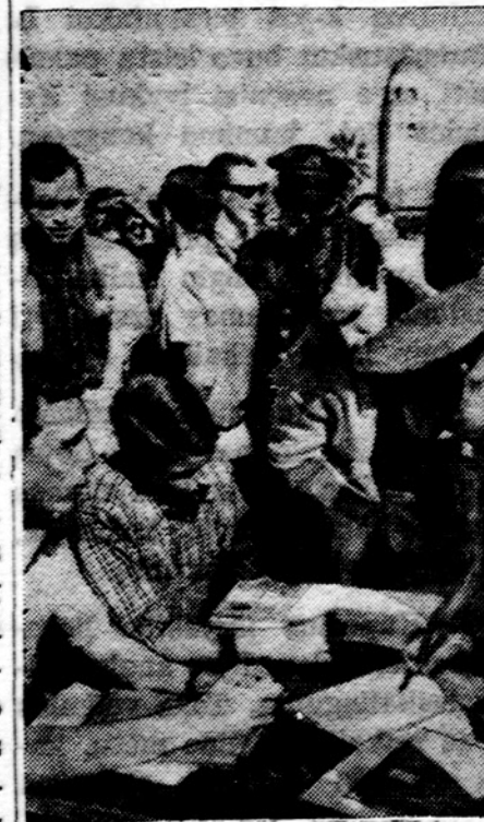
Stanford universiteto Californijoje studentai aukoja kraują suzeistiesiems Vietname, remdami JAV politiką kovoj su žiauriuoju komunizmu.