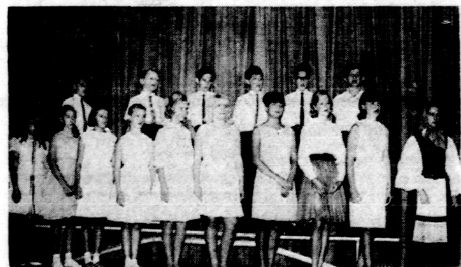
Sv. Kazimiero parapijos mokyklos 7-8 sk. mokiniai atlieka programą.

The U.S. Government does not pay for this advertisement. It is presented as a public service in cooperation with the Treasury Department and The Advertising Council.