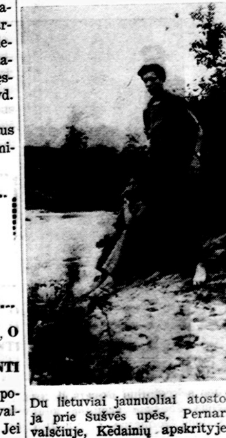
Du lietuviai jaunuoliai atostogauja prie sušvės upės, Pernaravos valsčiuje, Kėdainių apskrityje.

Klausimas: Esu arti 50 metų amžiaus. Gyvenu tarp italų, kurie vartoja labai daug "Hot Pe-