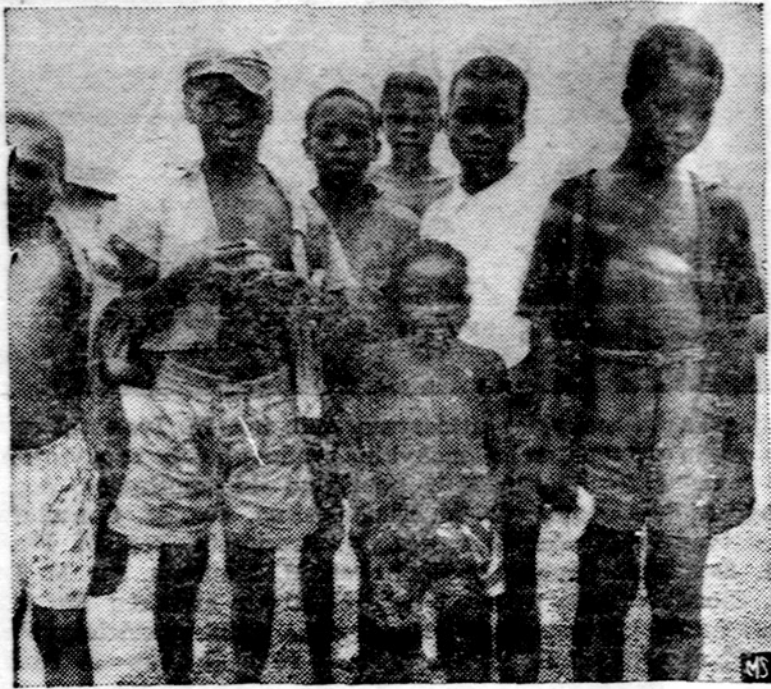
Afrikos jaunuoliai skautukai yra labai dėkingi Amerikos Katalikų vyskupų fondui už aukas. Berniukams fondas suteikia pagalbą rūbais ir maistu. Piginė ir rūbų rinkliava fondas daro Padėkos dienos savaitę.