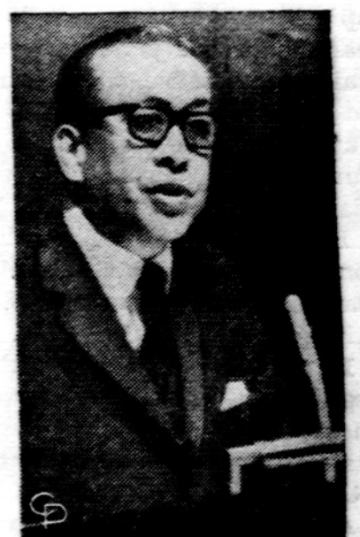
Liu Chieh, tautinės Kinijos ambasadorius, priešinsasi raudonosios Kinijos priėmimui į Jungtines Tautas.

— Kanados premjeras Pearson užvakar pareiškė, kad kanadiečių kareivių nebus siunčiama į Vietnamą. Ateinančią savaitę Kanadoje bus renkamas naujas parlamentas.