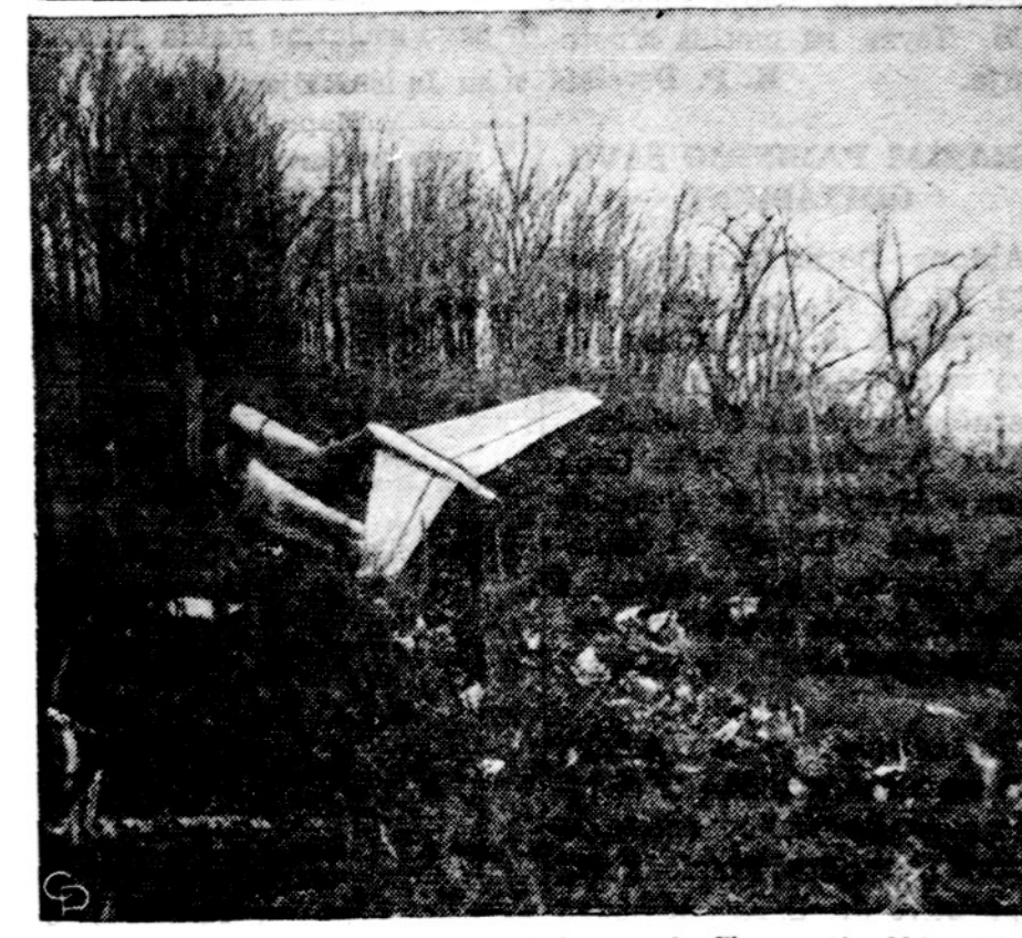
American oro linijos lėktuvas nukrito netoli Cincinnati, Ohio. Iš 62 asmenų tik keturi išliko gyvi. Skrido iš New Yorko.

Remkite tuos kurie skelbia si dienr. Orange