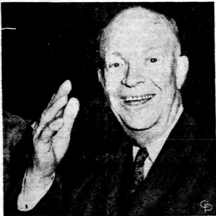
Buvęs prezidentas Eisenhoweris susirgo ir išvežtas iš Augustos į ligoninę Fort Gordon, Ga.

VOL. XLIX Price 10¢ KETVIRTADIENIS, THURSDAY, LAPKRITIS, NOVEMBER 11, 1965 Kaina 10 ct. Nr. 265