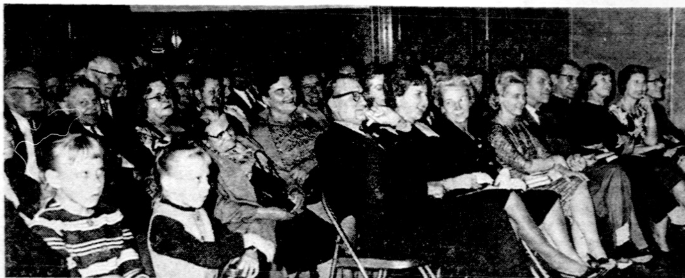
Svečiai susirinkę į "Zmonos portreto" komediją.

Finansiniai mokyklos reikalai buvo persvarstyti ir nutarta mokėstį už mokslą palikti nepakeistą. Tik visi tėvai prašomi atlikti savo pareigą ir nedelsiant per lapkričio mėnesį baigti užsimokėti. Todėl lapkričio 13, 20 ir 27 dienomis tėvų k-teto atstovas Pr. Juška mokyklos darbo metu bus Sv. Antano mokykloje ir priims mokėstį. Taip pat tėvų k-tetas prašo visų prisidėti aukomis Kalėdų Eglutės parengimui, skelbdamiesi programoje kaip įvairūs profesionalai, prekybininkai ir pavieniai asmenys, kaip lituanistinio švietimo rėmėjai. Neatsisakykite nei vienam į jus tuo reikalu be-