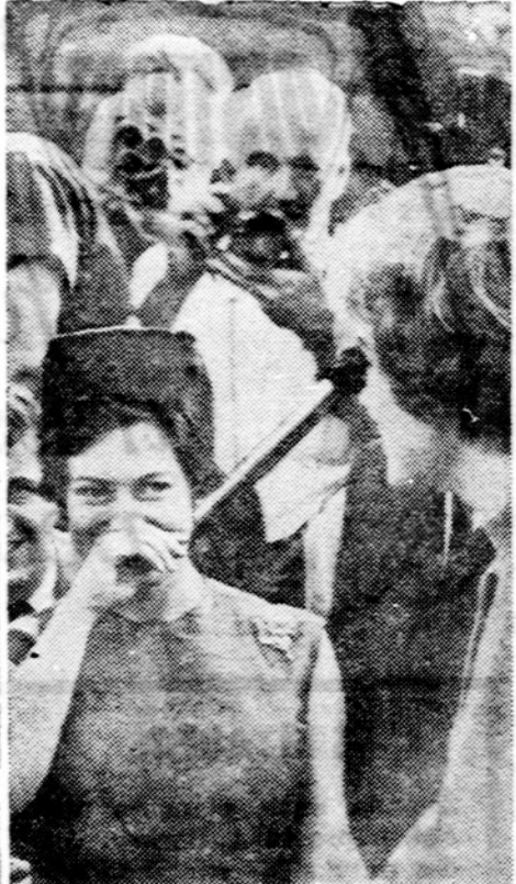
Akt. Julė Andrews (dešinėje) ir besijuokiantis princėse Margareta sustinka Hollywoode.