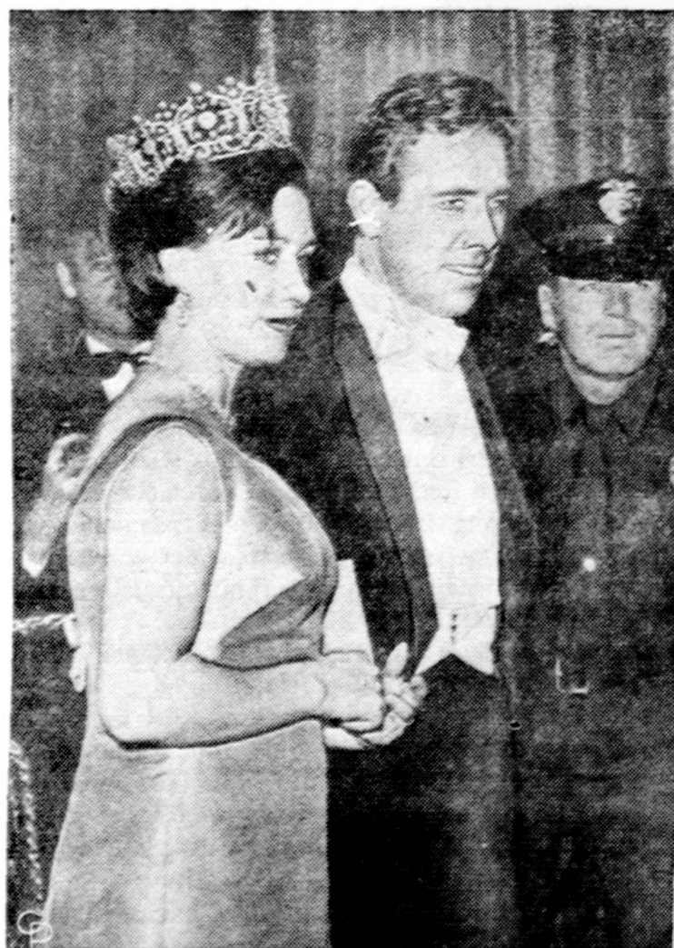
Labdarybės balijuje Hollywoode, kur vienas bilietas kainavo po 100 dol., dalyvavo ir Anglijos princesė Margareta su savo vyru lordu Snowdon.