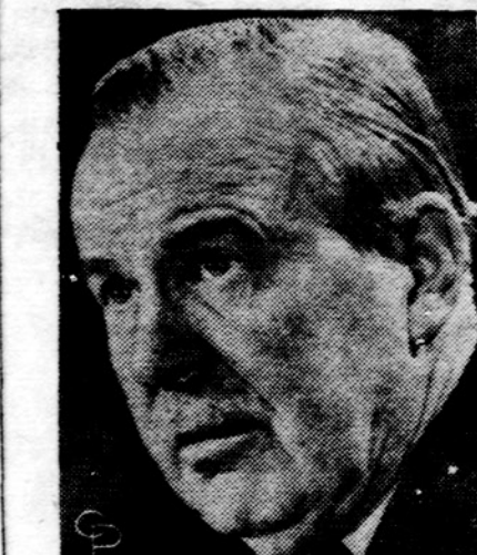
Kanados premjero Lesterio B. Pearsono liberalų partija gavo 129 vietas iš 265 parlamente, trūksta keturių vietų daugumai sudaryti. Tiek pat atstovų turėjo ir praėjusiame parlamente.

— Japonų vyriausybė duoda suprasti Pietų Vietnamo premjerui Cao Ky, kad jis nedarytų vizito Japonijai. Jis dabar yra jokių vilčių susitarti dėl pataisų 1961 metų konstitucijos, kuri turėjo tapti karališkosios komisijos darbo pagrindu".