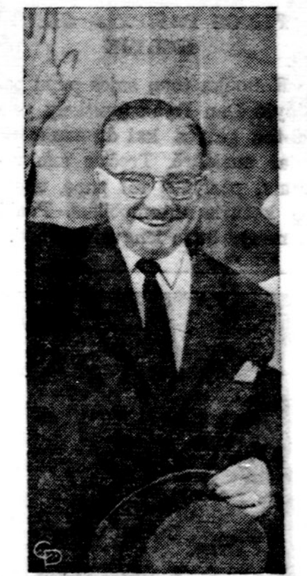
Respublikonų partijos pirm. Blisss išėina iš ligoninės Albuquerque, N.M., kur jam patikrinta sveikata po to, kai jis pajuto krūtinėje skausmus. Dabar vyksta poilsio.