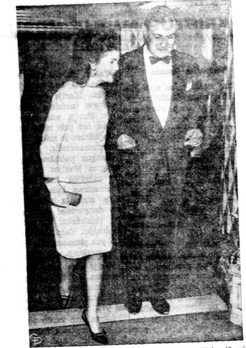
Jacqueline Kennedy, lydima Franklin Roosevelt, jr. išeina iš privataus parengimo New Yorke, kur buvo demonstruojamas filmas apie Eleonorą Roosevelt "The Eleanor Roosevelt Story".

KERELIS BROS. Construction Co. LIETUVIŲ STATYBOS FIRMA Projektuojam ir statom įvairius pastatus. Sutvarkom prieš miesto nuostatų nusiženimo (violations) problemas. 2815 W. 71st Street, CHICAGO, ILL. 60629 TEL. RE 7-8949