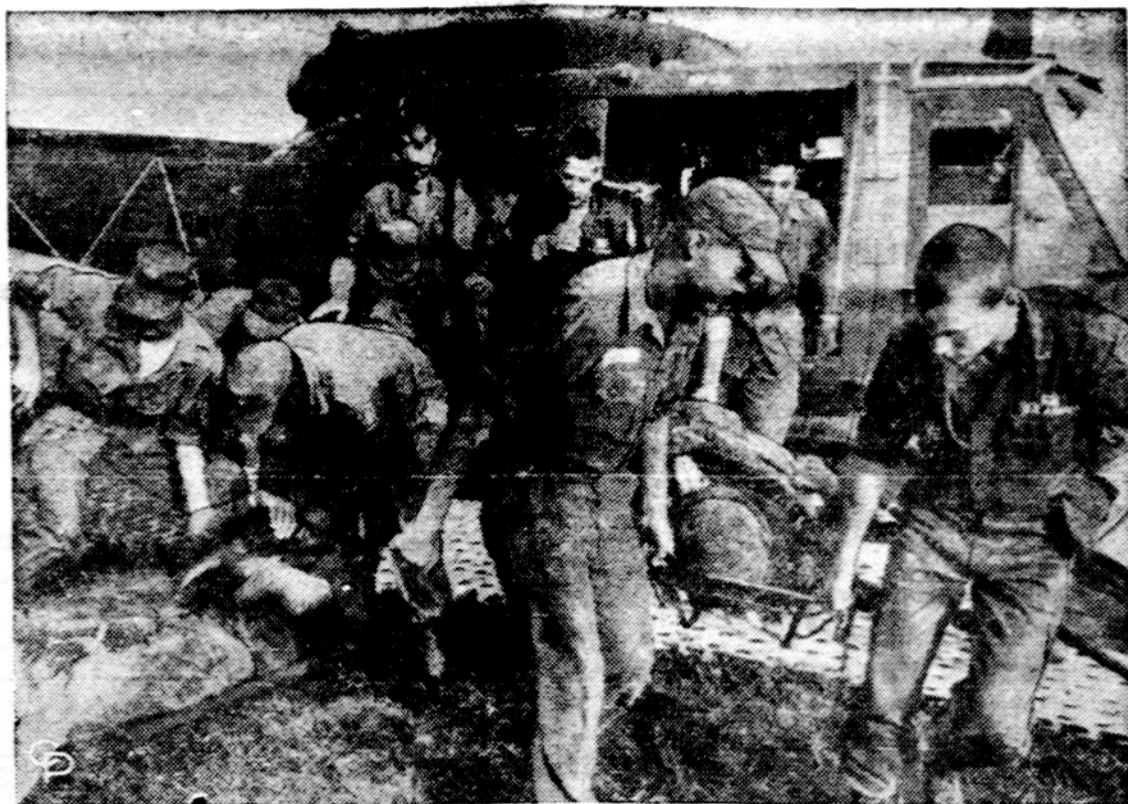
173 amerikiečių diviziono parašutininkai iš helikopterio išgabena sužeistus savo draugus, atsikraidintus iš kovos zonos D. kur po pusšėtos valandos kautynių užmušta arti 400 raudonųjų.

Tiesame toliau raidė "A": Piotr (Nukelta j 4 psl.)