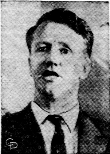
Premjeras Ian Smith paskelbė Rodezija nepriklausoma valstybe nuo Britanijos. Britų pareigūnai teigia, kad jis už tai turėtų būti pakartas