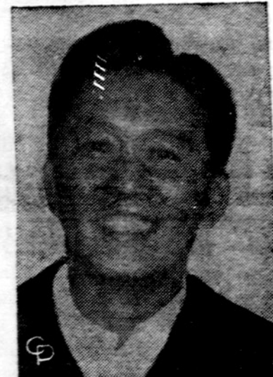
Ferdinand E. Marcos

Sen. F. E. Marcos, atrodo, išrinktas nauju Filipinų prezidentu, nors dabartinis prezidentas Macagal dar vakar neprispazino pralaimėtoju.