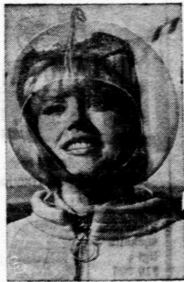
Braniff oro linijos patarnautoja demonstruoja tokį šalną, kuris ją apsaugos nuo leto ir vėjo.

Su Maironiu šaukiu: "Graži tu mano brangi, Tėvyne! Bet labai skaudu, kad tavo skaisčius veidas kruvinas ir rankos rečiau šurakintos..." (Pabaiga)