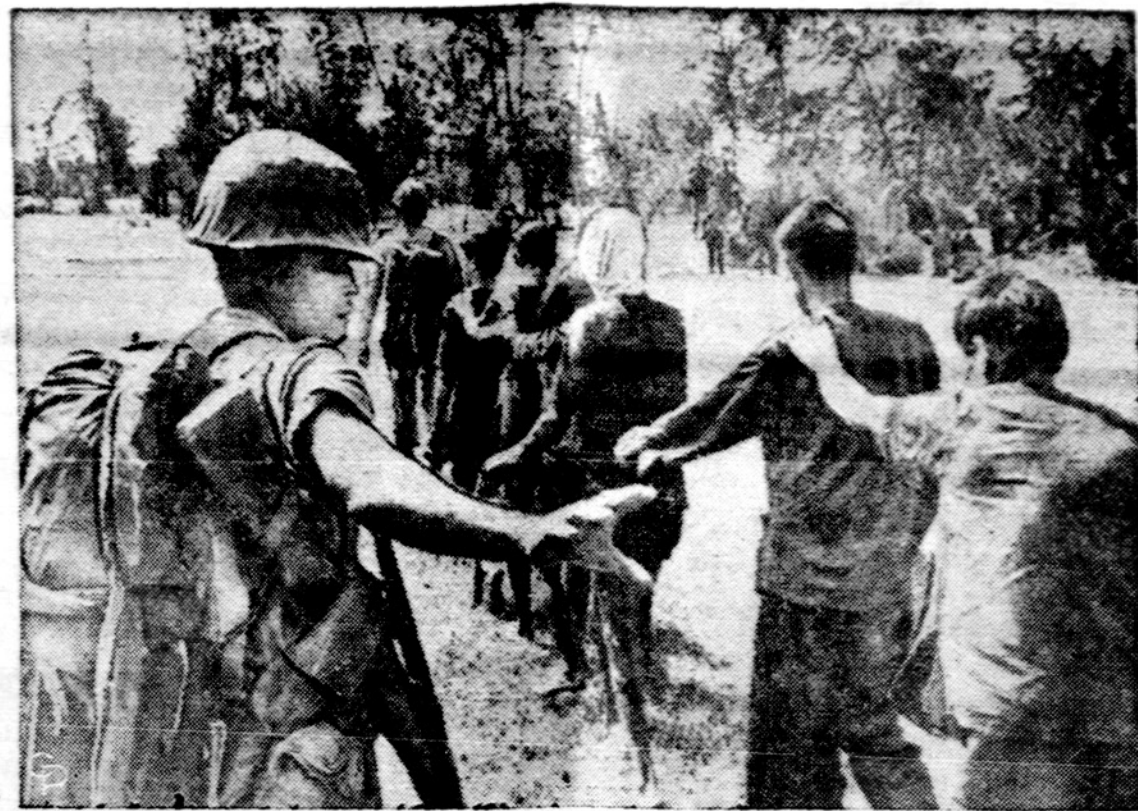
Amerikiečiai kariai Pietų Vietname varo belaisvius, po kautynių norint apvalyti nuo komunistinių banditų strateginį kelią Highway 1. Tai buvo vadinama Blue Marlin operacija.

Iš jo kalbos seka aiški išvada: norite Prancūzijos tarpimū — balsuokite už mane ar