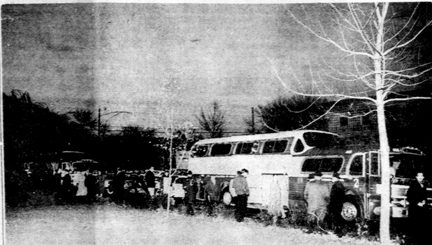
Čikagiečiai dalyvavo jaunimo manifestacijoje New Yorko. Nuotraukoje jie parodyti prieš išvykstant New Yorkan dalyvauti šeštadienį didžiulėje manifestacijoje, suruoštoje Komiteto Lietuvos nepriklausomybei atstatyti.

Baltijos kraštų vėliavos prie Jungtinių Tautų Telefoninis pranešimas iš New Yorko