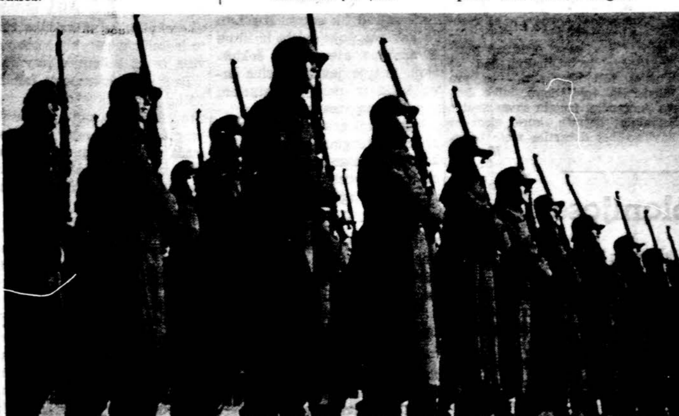
Lietuvos kariai žygyje

Kriptos gale stovėjo stilingas baltas kryžius, kuriame buvo įrašyti nepriklausomybės kovų metai: 1918 — 1923. Kryžiaus viršuje aukso tvakasa buvo stilingų raidžių šūkis: "Žuvome, kad gyventume laisvi".