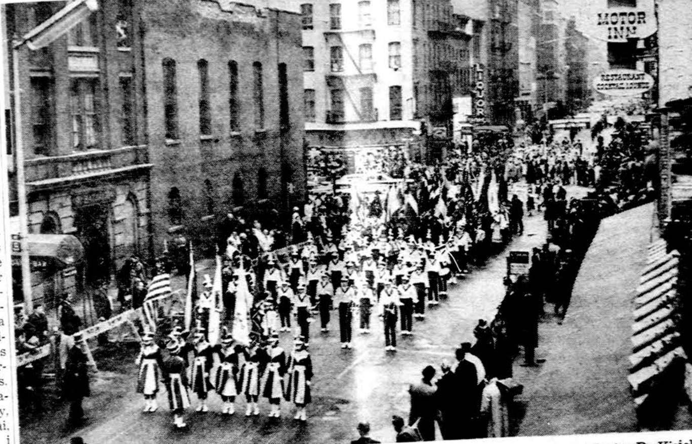
Pabaltiečių eisena lapkričio 13 d. demonstracijose New Yorke.