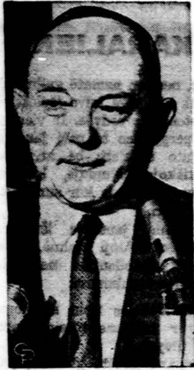
Valstybės sekret. Dean Rusk kalbasi su reporteriais Rio de Janeiro mieste, kur susirinko Pietų Amerikos užsienių reikalų ministeriai.