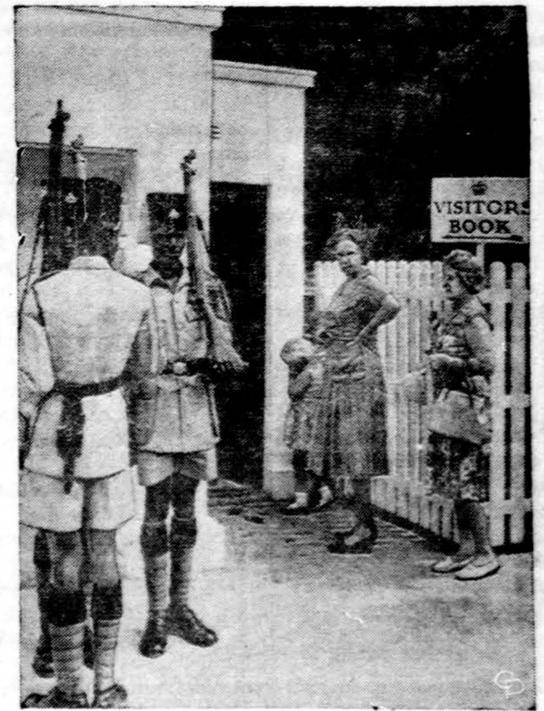
Rodezietiai stebi besikeičiančią sargybą prie vyriausybės rūmų Salisburi, belaukdami pasirašyti svečių knygoje. Daugiau kaip šimtas pasirašė šitikiemybė Britanijos karalienei Elzbetai II Rodezietis premjero Smitho vyriausybė pasiskelbė Rodeziją nepriklausoma nuo Britanijos.