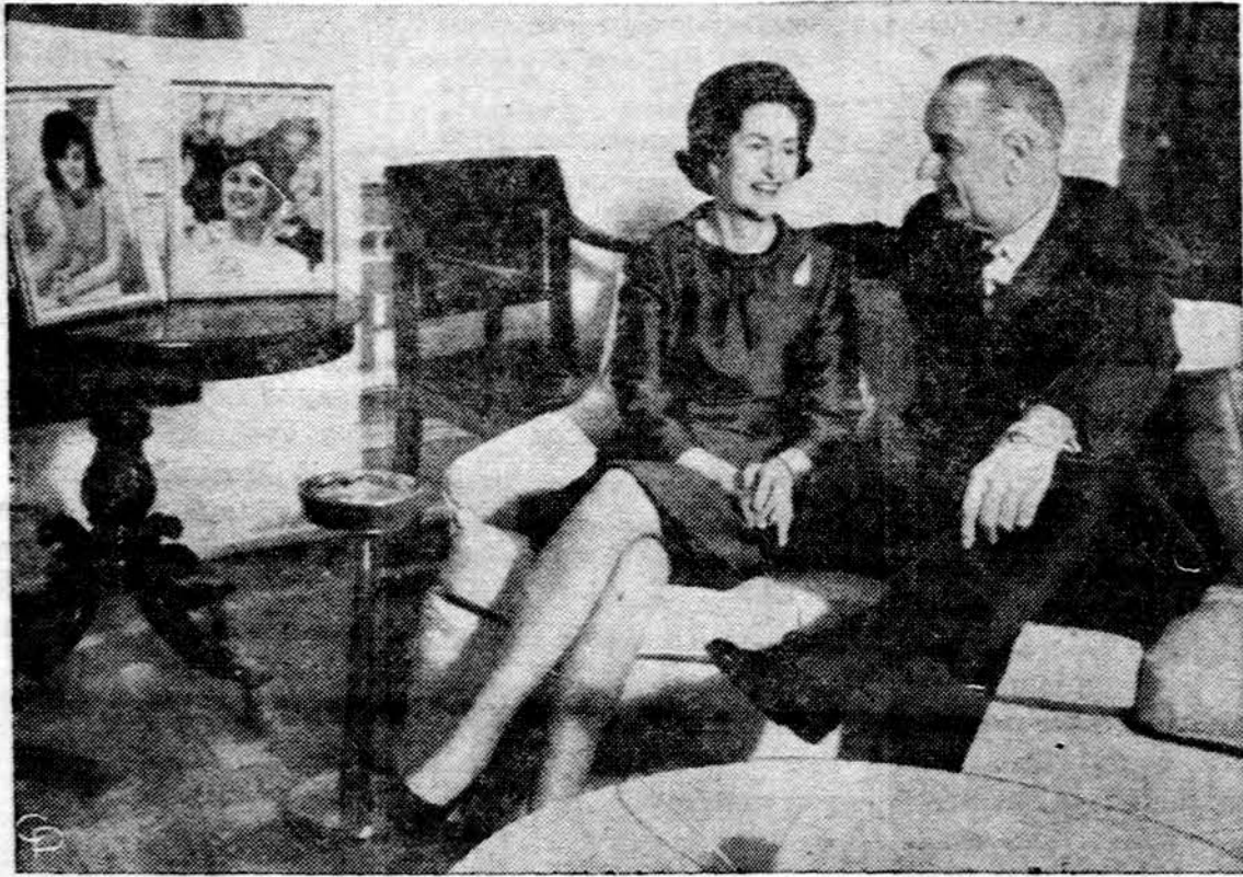
Prezidentas Johnsonas ir jo žmona trečiadienį paminėjo savo vedybinio gyvenimo 31-rių metų sukaktį. Kairėje yra Johnsonų dukterys Luci (kairėje) ir Lynda.