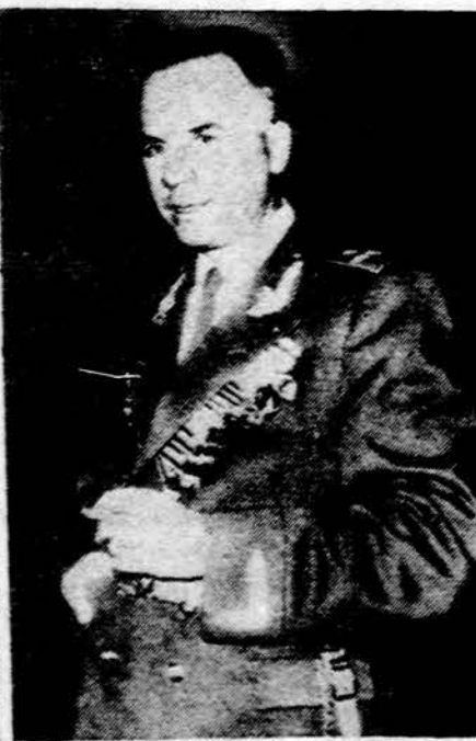
Pulk. Oleg Penkovskij

Pasiryžęs stoti kovon prieš raudonąją diktatūrą, jis per britų prekybininką Greville Wynne teikė Vakarų valstybėms žinias apie Sovietų Rusi-