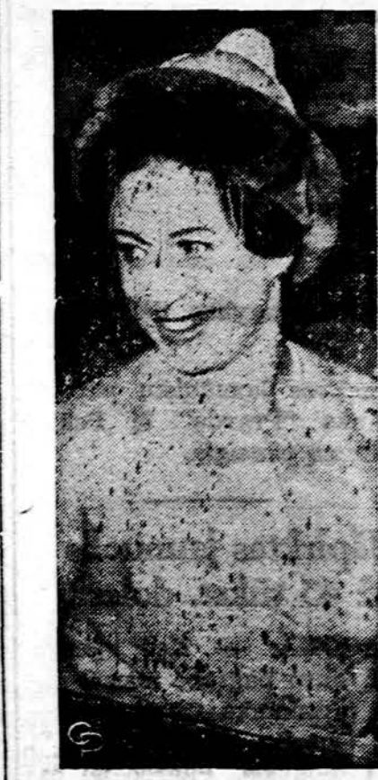
Princesė Margareta šypsos iš automatinės Washingtono.