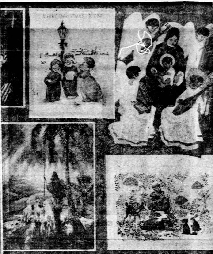
Kalėdoms artėjant išperkama labai daug kalėdinių atvirukų. Kaip skelbia Greeting Card draugija, atvirukai vis daugiau spausdinami religinio turinio.