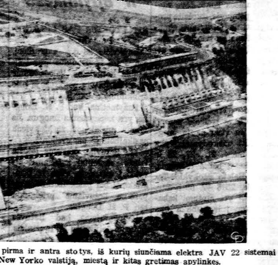
Elektros jėgainės Niagara Falls pirmą ir antrą stotys, iš kurių siunčiama elektra JAV 22 sistemai ir kurioje įvykė sutrikimai aptemdę New Yorko valstiją, miestą ir kitas gretimas apylinkes.