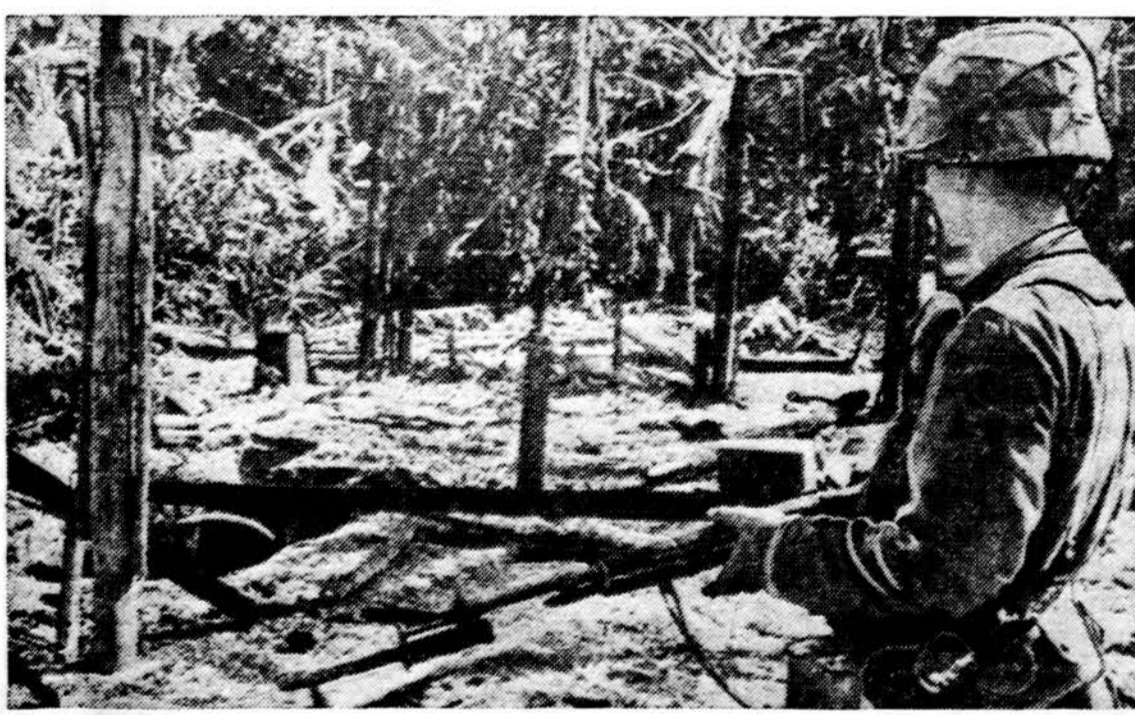
Amerikietis karys tiria išvalytą nuo banditų vietovę Bau Bang, esančią 23 mylios nuo Saigono. Kaimelis buvo sunaikintas kovojant dėl kelio nr. 13.