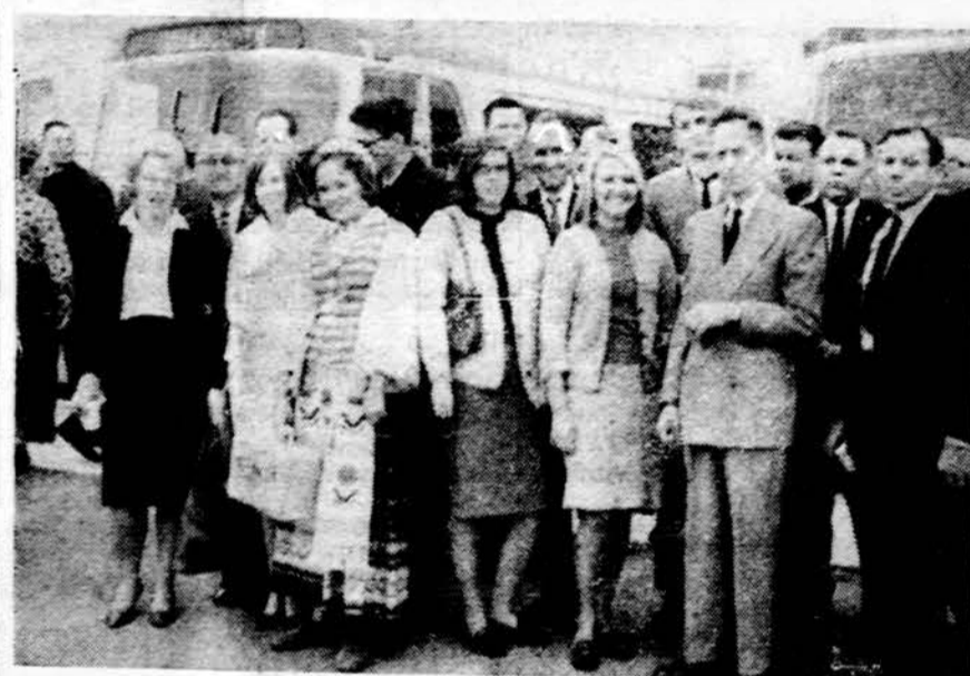
Grupė lietuvių vykusių į Laisvės žygį iš Baltimorės.

Pirmasis mėnuo Jaunimo metų jau prabėgo ir jaunimas kiek vieną dieną kuo nors pasireiškė vadovaudamasis šūkiu: "Mūsų jėgos, mūsų žinios laisvai Lietuvai tavei!" Jaunieji akademikai užsitarnavo lietuvių višuo menės pagarbą, už atliktą