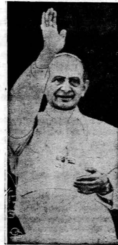
Šv. Tėvas Paulius VI