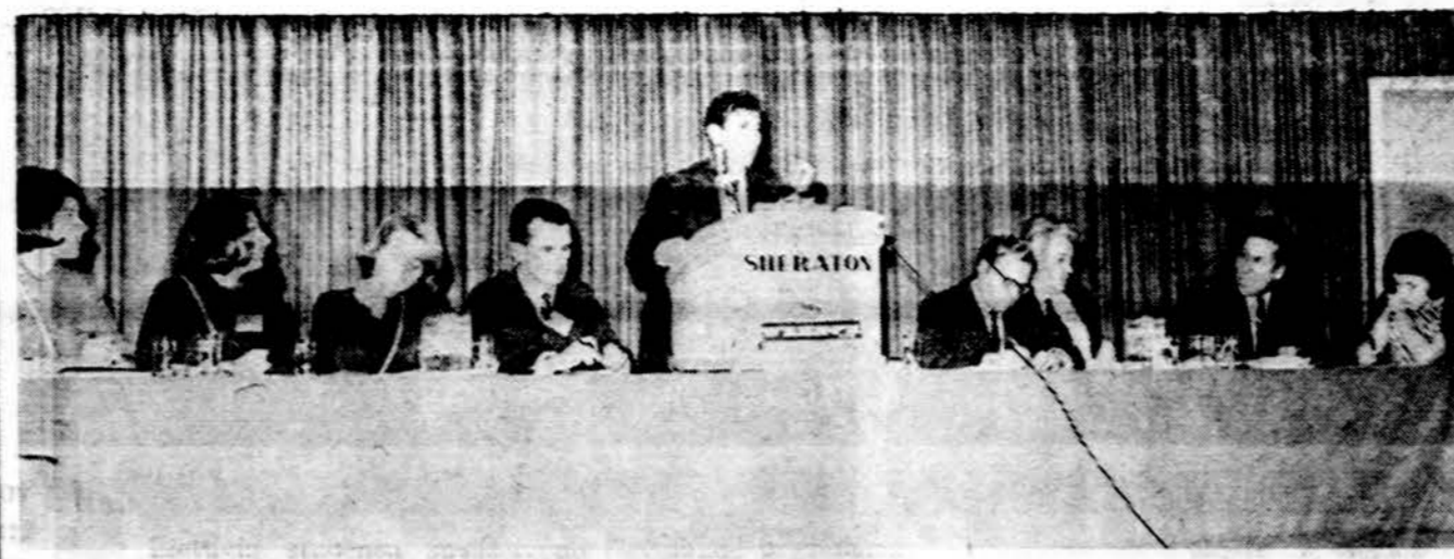
Lietuvių studentų suvažiavimo Clevelande prezidentas.