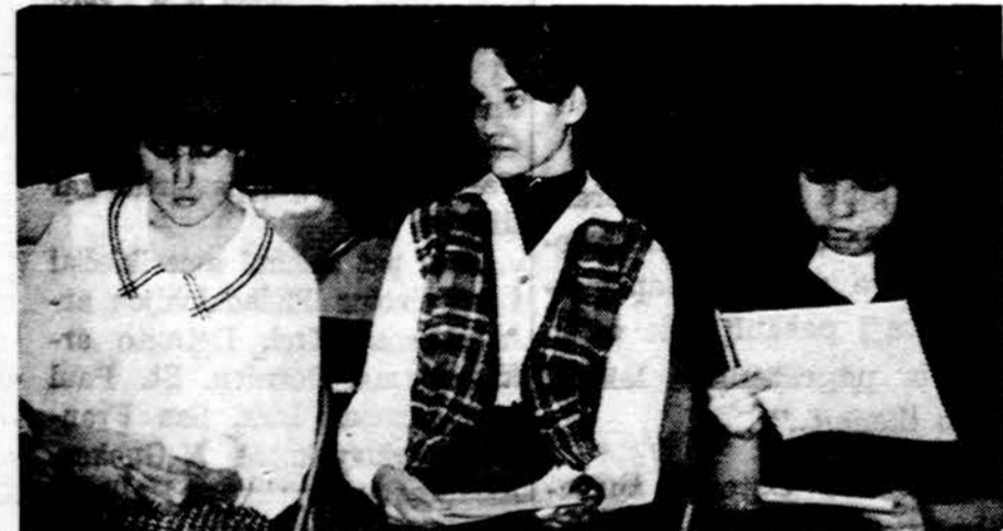
Grupė mergaičių MAS suvažiavime — kursuose Dainavoje.