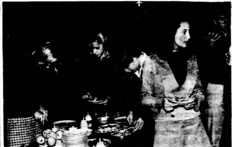
Kursų pertraukos metu moksleiviai stiprinasi.

Lietuvos Vyčių organizacija yra labai artima jums. Jos šūkis yra "Dievui ir Tėvynei". Vyčiai, kaip ir jūs, brangina tikėjimą ir dirba dėl savo tėvų žemės Lietuvos. Tad, atėję pas