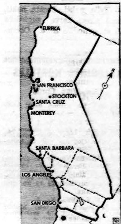
Zemėlapyje matyti, kaip norima Kalifornijos valstybę padalinti į dvi dalis. Viena dalis turėtų 8 mil., o kita 10 mil. gyventojų.