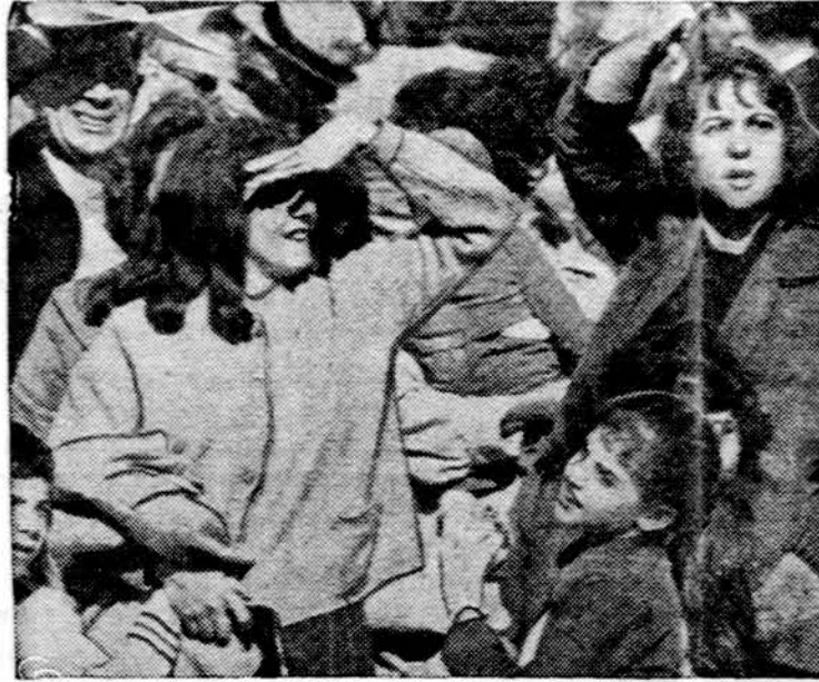
Pabėgėliai iš Kubos laukia savo pažįstamų, kurie iš komunistų paverstos tėvynės atvyksta į Miami, Fla.

Suarus, drąsiais arklė piūviais išpūrenus dirvą, prasideda tvarkingos sėjos laikotarpis. Vėl iškyla visu didingumu Bažnyčios mokslo ir jos struktūrų pastovumas, kuris sudaro mūsų veiki-