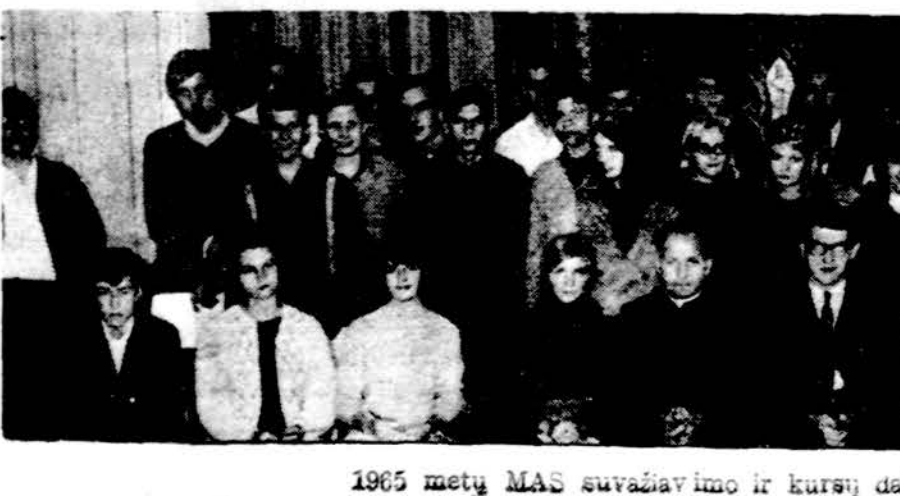
1965 metų MAS suvažiavimo ir kursų dalyviai.

Christmas Cards "Drauge" jau galima gauti kalė- dinių kortelių. RINKINYS Nr. 1 Ivairūs gražūs relig. ir gamtos Ka- lėdų vaizdai su lietuviškais sveikini- mo tekstais. Dėžutė yra 15 kortel- ių. Kaina $1.00. RINKINYS Nr. 2 V. Tubellenės Kalėdinės kortelės specialiai silko spausdinimo būdu pagamintos su lietuviškais piešiniais ir sveikinimais. Dėžutė 10 kortelių. Kaina $1.00. RINKINYS Nr. 3 Ivairūs gražūs religiniai Kalėdų vaizdai su angliškais sveikininimų tekstais. Kaina $1.00. Užsakymus siųsti: Užsakymus siųsti: Draugas, 4545 W. 63rd St., Chicago, Illinois 60629