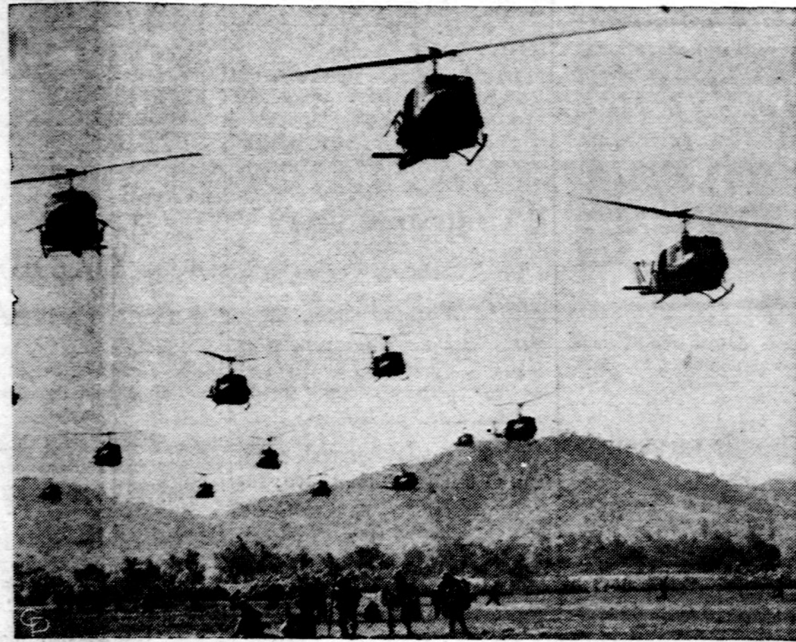
Amerikos helikopteriai lekia virš Bong Son srities Pietų Vietname, išmesdami karius vykdant vadinamą "Eagles Claw" operaciją.