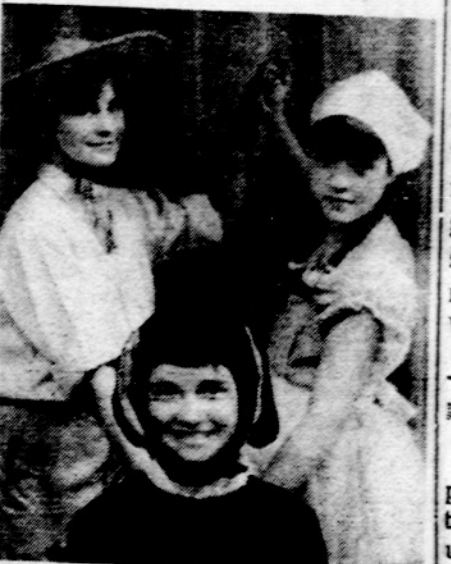
Iš baletu "Buvo gera gaspadinė" kaulių linksmavakary Marquette Parke vasario 6 d.

Vasario 6 d. vakare L. Brazdienės vadovaujami Chicagos studentai Auroros kolegijoj pasoko tautinių šokių. Šokėjai parodė geros šokių darnos, grakščius.