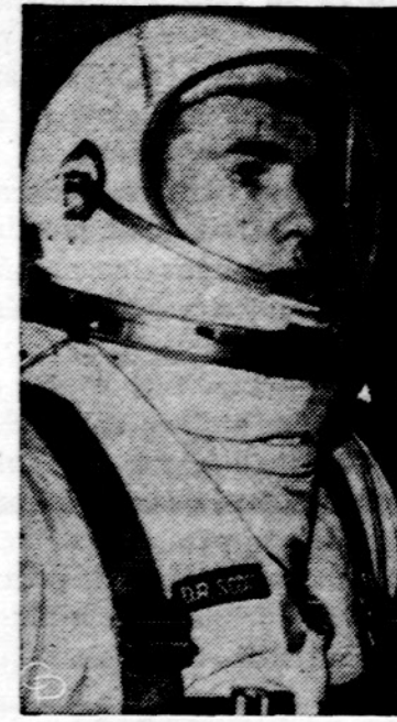
Astronautas David Scott erdvės vaikščiojo dvi valandas, kai bus paleistas į erdvę Gemini 8. kovo mėnesio 15 d.