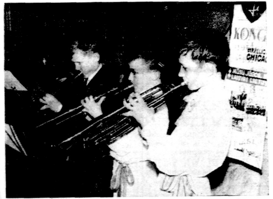
Castelnuovo lietuvių saleziečių gimnazijos berniukai groja Tautos himną Vasario 16-sios minėjime.

— Žemėje vienam kvadratiniam kilometre vidutiniškai gyvena 20 žmonių.