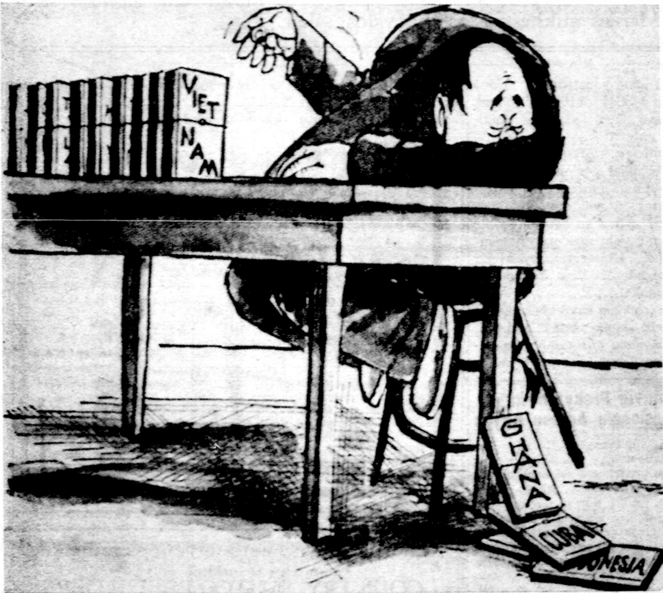
Didėjantis agresoriaus apetitas