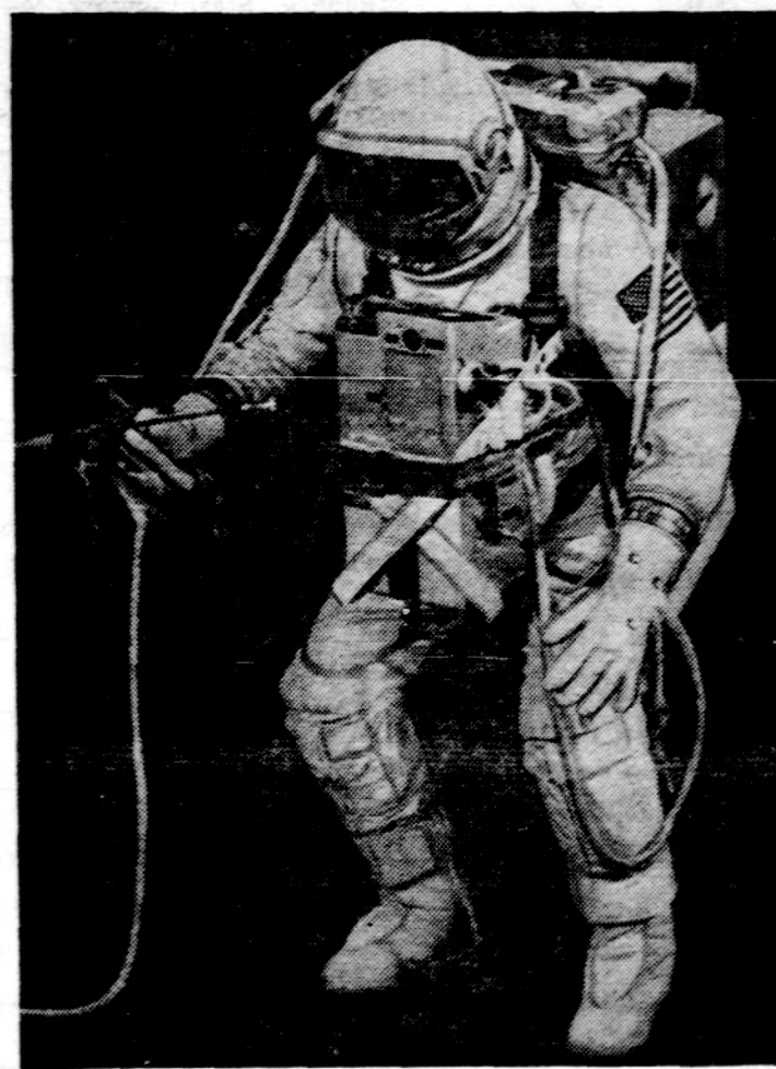
Kovo 15 d. į erdves bus paleistas Gemini 8 ir astronautas David Scott vaikščios erdvėmis. Vaikščiojimą kontroliuoja su prietaisu laikomu rankoje.