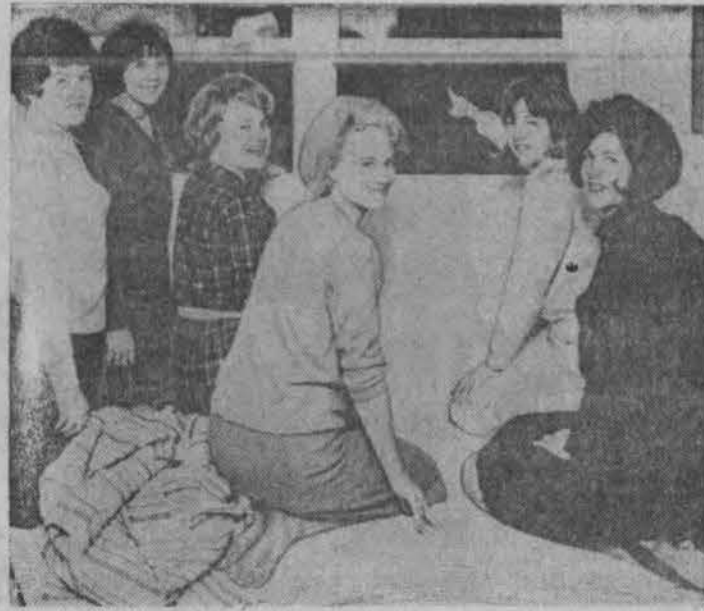
Hillsdale, Mich., šios vietos kolegijos merginos sakėsi matę skraidančias lėkstes. Kažkokius skraidančius objektus matė ir kiti asmenys. Aviacijos pareigūnų įvykis tiriamas.

Taip, visi žmonės yra dulkės, tačiau kaikurie yra aukso dulkės. — Anonimas