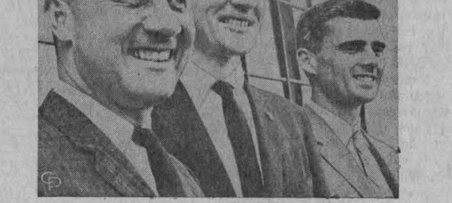
Erdvėlaiviu Apollo apie Žemę skristi numatyti trys amerikiečiai: k. į d.: Virgil I. (Gus) Grissom, Edward White ir Roger B. Chaffee.