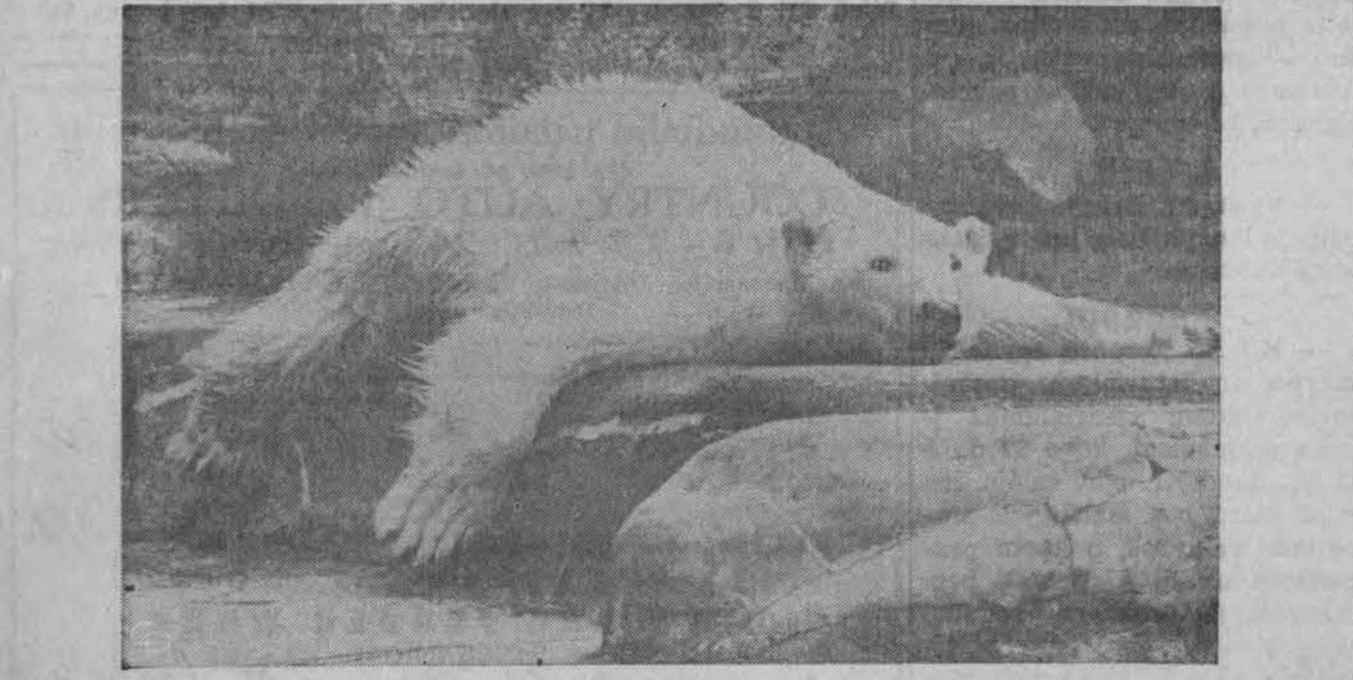
Ši meška atrodo vaizduoja kaip jos kallis gulės kilimo vietoj, tačiau nėra jau visai taip, ji tik vėsinasi Memphis, Tenn., zoologijos sode.