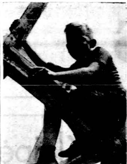
Šiam jaunūčiui ir visam lietuviškam jaunimui pastatyta Dainavos stovyklavietė prieš dešimt metų.

gi. Už tai atsisteiti galima, tik prisidedant prie tų stovyklų rengimo, joms vadovavimo ir jų parėmimo savo dalimi.