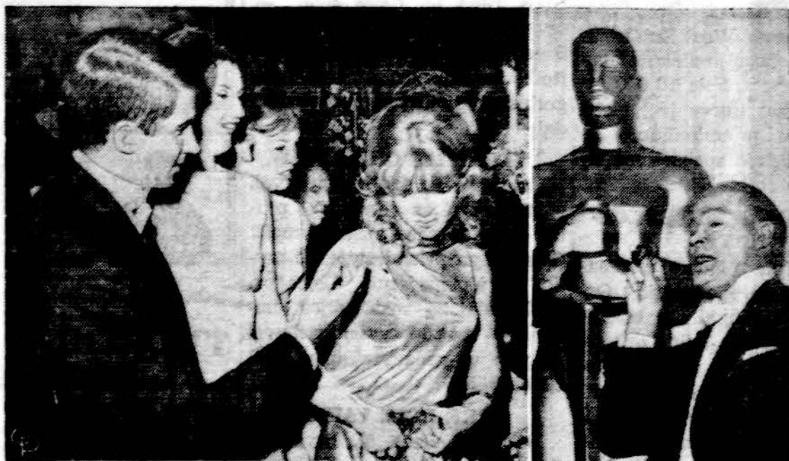
Geriasia aktore pripažinta Julie Christie, tačiau daugiausia dėmesio Oskaro premijų įteikime susilaukė prez. Johnsono dukra Lynda, dalyvavusi šventėje su akt. Hamilton. Vakariui jau dvilyktą kartą vadovavo akt. Bob Hope, kuris už savo nuopelnus taip pat buvo apdovanotas specialiu aukso medaliu.