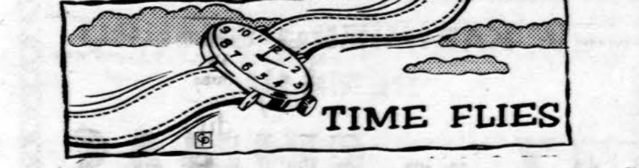
Laikas labai greit skrenda, štai šį sekmadienį vėl pasuksime laikrodį vieną valandą pirmyn.