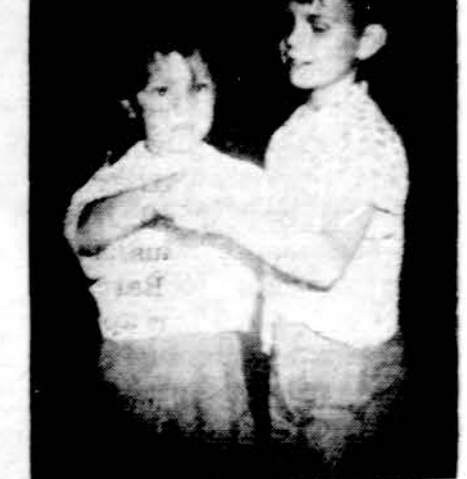
Jaunųjų šokiuose. Nuotr. Kazio Razgaičio

Tėveliams iš jaunųjų stovyklos rašome laiškus. Nuotr. Kazio Razgaičio