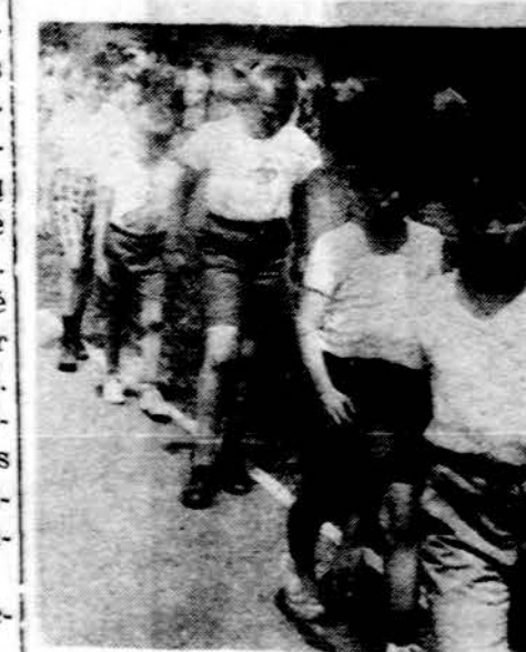
Sporto aikštėje pereinų metų jaunųjų stovykloje.

LSB vadovams biuletenio "Krivulė" šių metų pirmojo ketvirtio numeris, dėl techninių kliūčių, išeis š. m. balandžio mėn. gale. LSB Informacija