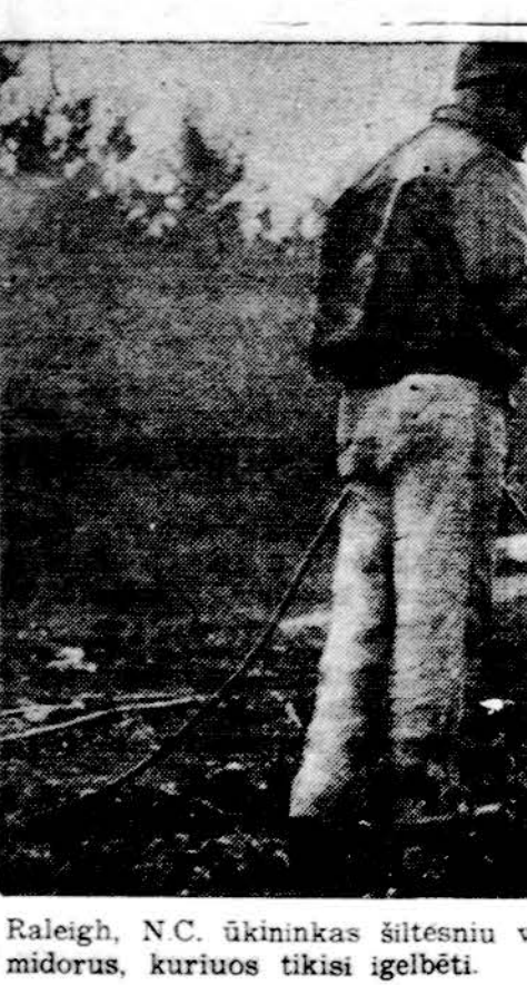
Raleigh, N.C. ūkininkas šiltesniu vandeniu valo šalnos palieštus pamišorus, kuriuos tikisi igelbėti.