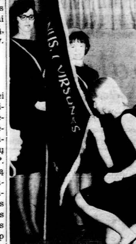
Is ateitininkų iškilmų Clevelande. Gedros korp. priesaika. Priėve- -lavos A. Malėnėnė ir A. Balčiū- -naitė. Bučiuoja vėlavą Staistit.

Autorius Oechio ypač skati- -na įsijauti ir kryžiaus prasmę. Primenama, kaip pas šv. Alfonsą atėjo išpažinties vienas vyras su ilgu nuodėmių sąrašu, bet nerodė jokio gailėsčio. Šventa- -sis, matydamas, kad jis nepa- -ruoštas gauti išsišimą, davė jam kryželį ir rankas, pats pasaky- -damas, kad turis valandėlei išeiti. "Ką su juo turiu daryti?" — paklausė penitentais. "O, tik ge- -rai įsižiūrėk į Jį". Ir kai šven- -tasis grįžo, atrado tą vyrą iki ašarų susijaudinusį. Gilesnis apmąstymas tos kryžiaus au- -kos atšildo ir suledėjusias šir- -dis.