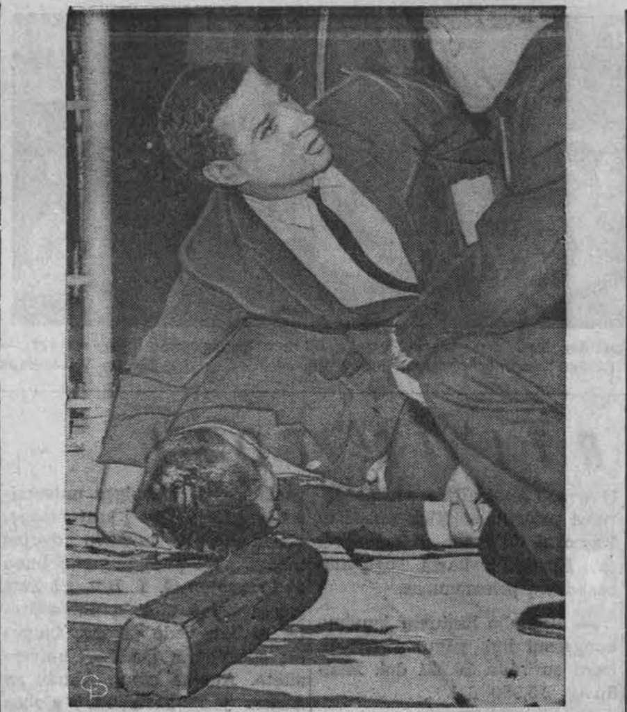
Los Angeles 25 negrai jaunuoliai įsiveržė į likerio krautuvę ir išplėšė. Nuotraukoje matyti kaip jaunuolių sužeisti "Newsweek" žurnalo laikraštiniškai vienas kitam suteikia pagalbą. Vandalai sužeidė du žurnalistus.

Net ir komunistai nepatenkinti To jau buvo per daug. "Užvirė kraujas" net ir rumunų komunistams, ligšiol ištikimiems vadams Georgiu Dej ir Maurer'ui. Visų nustebimui prabilo ir ligšiol tylėjęs, įsakymus klusniai vykdyęs "partneris". Prabilo ir kaip ir dera atkakliems senųjų romėnų palikuonims, pasakė aiškų ir stiprų ne! Juk tai reikėdė nei daugiau, nei ma-