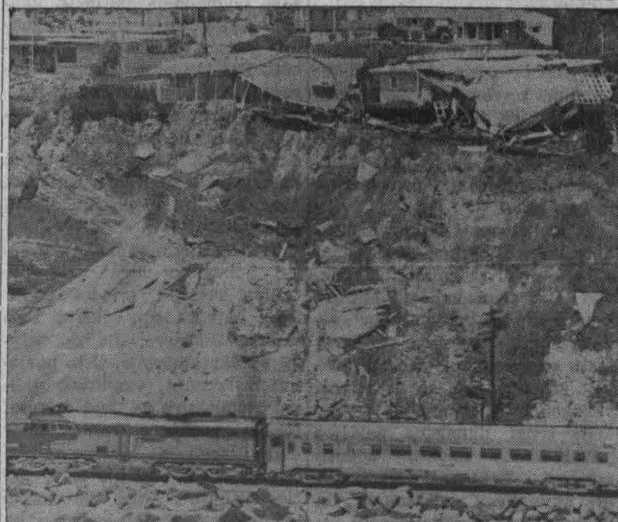
Lietuv paplovė netoli Eos Angeles krantus ir todėl traukinys lėtai važiuoja pro grūvančius šlaitus. Dėl slenkiančios žemės sugriuvo keleto namų.