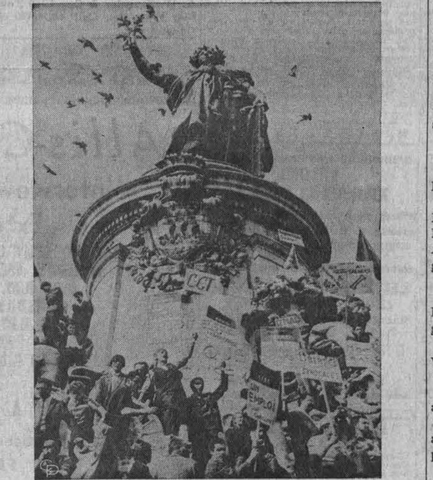
Paryžiaus darbininkai reikalauja mažiau darbo valandų ir didesnio atlyginimo. Čia matyti darbininkai triukšmaują prieš De Gaulle prie paminklo respublikos aikštėje.

valgome, ji išėina iš kambario, sandariai uždarydama duris. Mudvi su Rūtele išbaigiami vesia sriubą. Maloni šilima sklėdziasi po mano kūną. Jaučiuosi atgavusi jėgas. Nutariau nueiti į apačią ir susipažinti su mano geradariais.