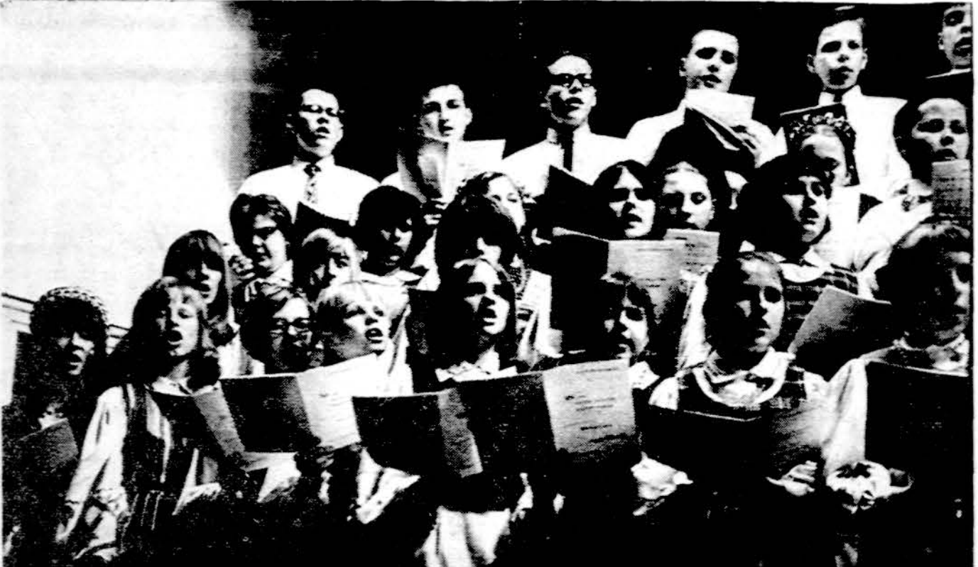
Detroito Aušros Lietuviškosios mokyklos choro detalė Dainų vakaro metu. Choras turi 88 dainininkus ir yra užsiregistravę dalyvauti Dainų šventėje Chicagoje liepos 3 d.