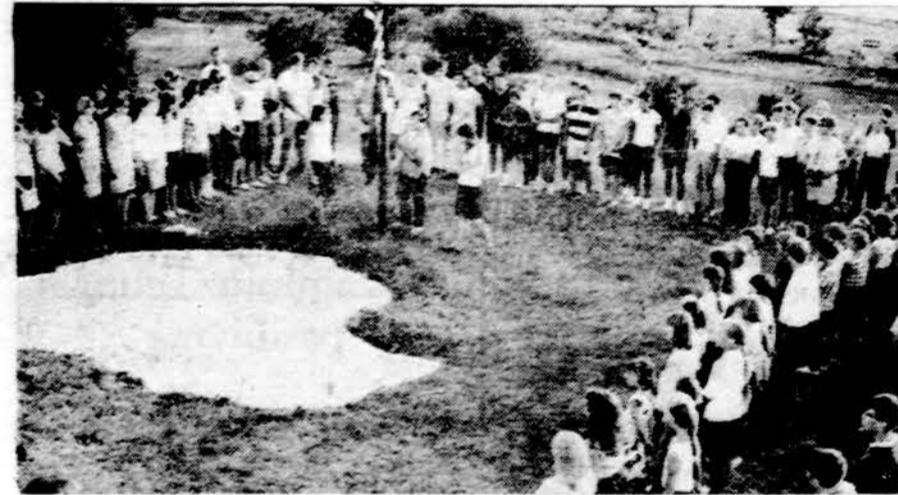
Vėliavų pakėlimas MAS stovykloje. Nuotr. Gedim. no Naujoka.č o