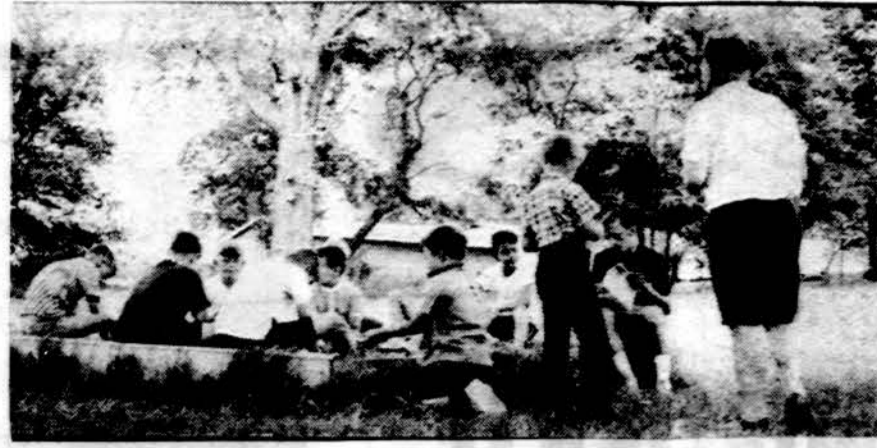
Mažieji stovyklautojai smėlio dėžėje žaidžia, globojami Jurgio Bradūno ir stovyklos vado mokyt. Broniaus Krokio.