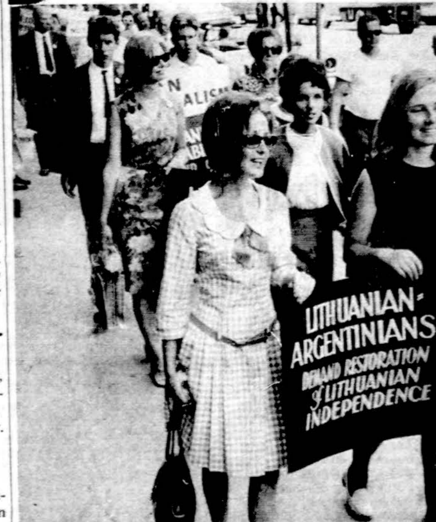
Lietuvių jaunimas demonstruoja New Yorke pakelini į Sovietų Rusijos ambasada, reikalaudami Lietuvai laisvės ir nepriklausomybės.