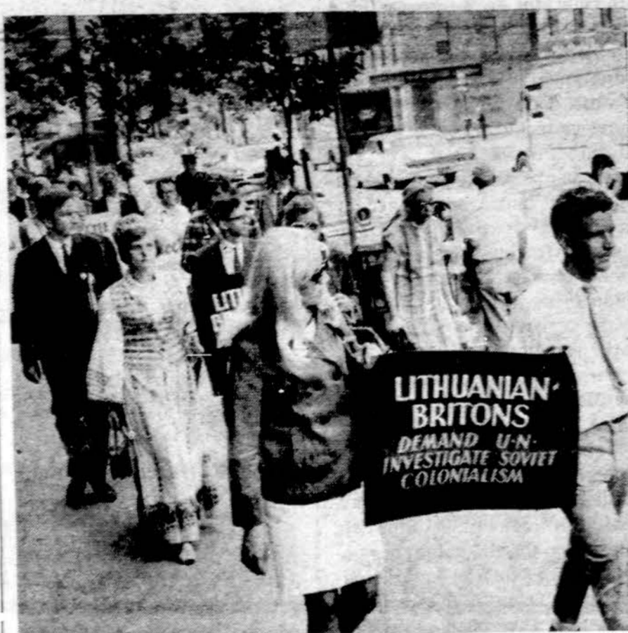
Lietuvių jaunimo demonstracija New Yorke liepos 8 d. pakelini į Jungtines Tautas.

CHICAGO. — Vakarnėje Chicago dalyje kilus rasišioms riaušėms, Illinois gubernatorius Kerners prašant merui Daley, vakar Chicago pasiumė 3.000 tautinės gvardijos vyrų tvarkai palaikyti. Jau kelinta diena negrai nerimsta kai kuriose miesto dalyse. Keli policininkai sužeisti. — Kai kurie JAV-bių senatoriai vakar perspėjo Harojų, jei Šiaurės Vietnamo komunistinis režimas nužudytų amerikiečius laivais, įaimtus nelaisvėn, tai būtų sučiuotas didžiulias smūgis kr. šiuo nepaprastais bombardavim: is.