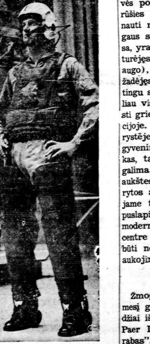
Nauji kostiumai suprojektuoti JAV kariams Vietname, skraidantiems helikopteriais. Kostiumai turi ant kojų, krūtinės ir nugaros šarvus, galinčius apsaugoti nuo kulku ir skeveldrų.

De Gaulle iš Sov. Sąjungos grįžo gyvas, bet daug ten besisvečiausių grįžo grabuose. Dimitrovas, Bulgarijos premjeras, grįžo grabe. Bierutas, Lenkijos prezidentas, grįžo grabe. Gotwaldas, rytinės Vokietijos premjeras, grįžo grabe. Togliatti, Italijos komunistų vadovas, grįžo grabe. Thorez, prancūzų komunistų vadovas, mirė vos grįžęs. Shastri, Indijos premjeras, grįžo grabe.