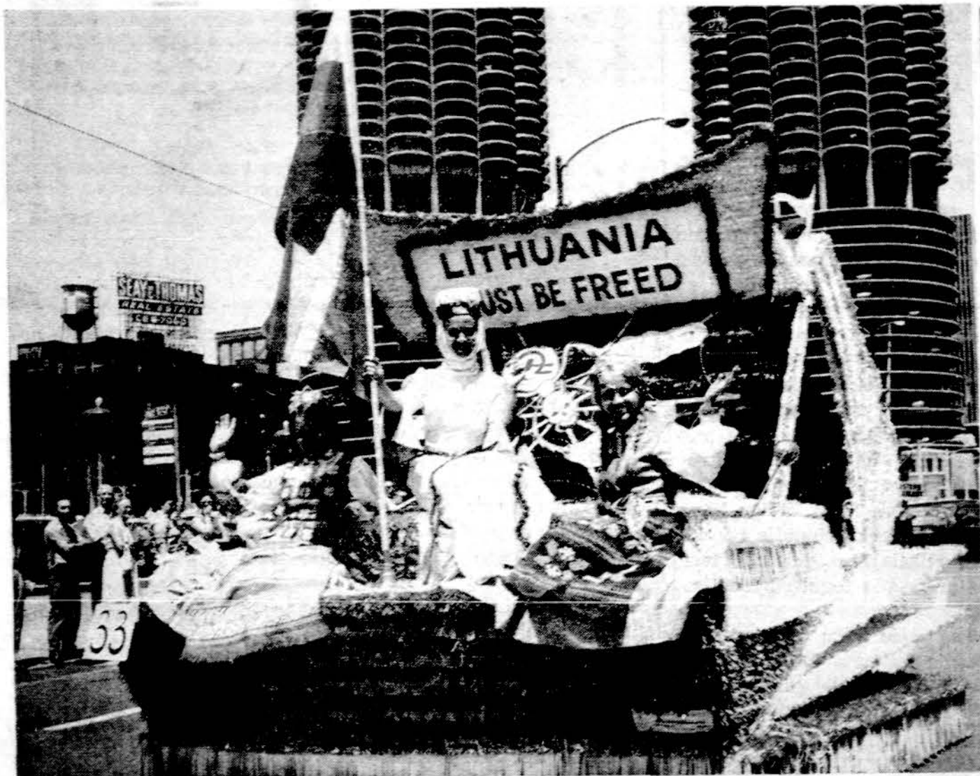
Lietuvių flotilės pavergtųjų tautų eisenoje Chicagoje liepos 16 d. Šią nuotrauką įsidėjo "Chicago Tribune".