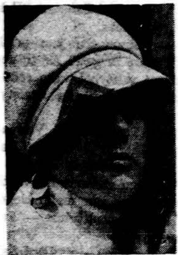
Tokios moteriškos kepuraitės dėmonas truojamos Londone rudens sezonui.