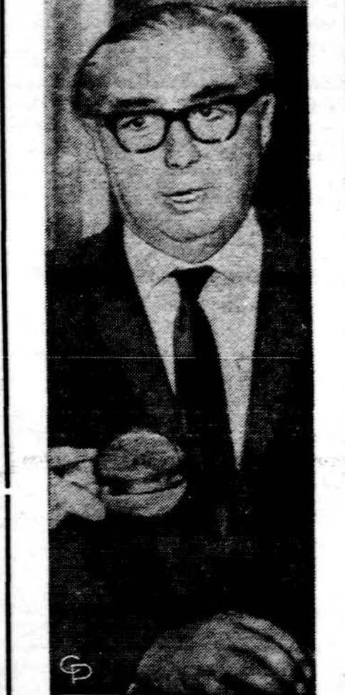
Britanijos ekonomikos min. George Brown kalbasi su korespondentais krašto ekonominiams reikalais. Anglija yra patekusi į ekonominius sunkumus.