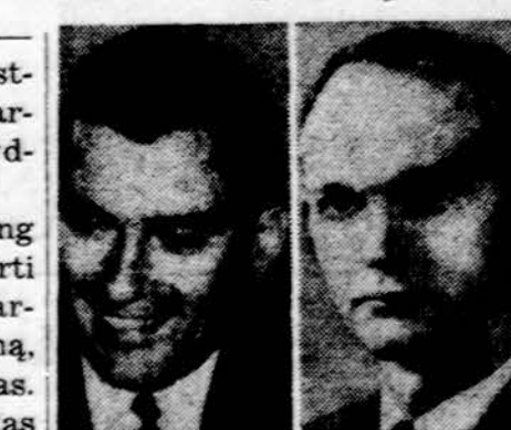
John W. Young Michael Collins

2. Gemini-10, susijungęs su raketą Agena, skriejo 390 va-