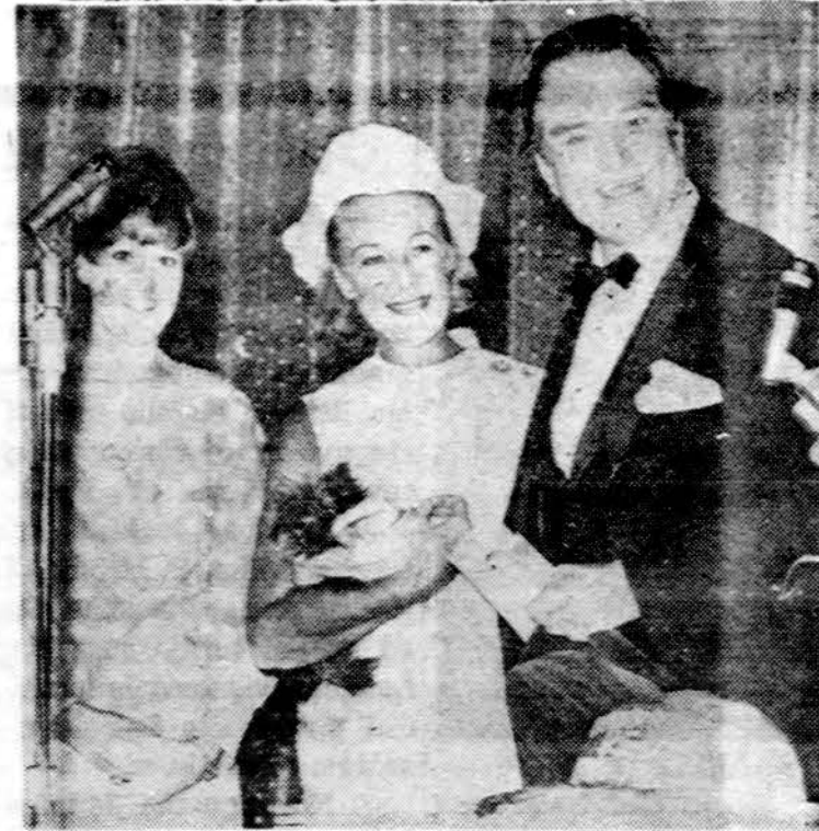
Komedininko Red Skelton žmona, 42 m., nelaimingai persivovė per krūtį, bet nepavojingai ir sveikata ligoninėje. Ji čia matyti Las Vegas viešbutyje su savo dukrele ir vyru, minint jo 53 m. sukaktį.