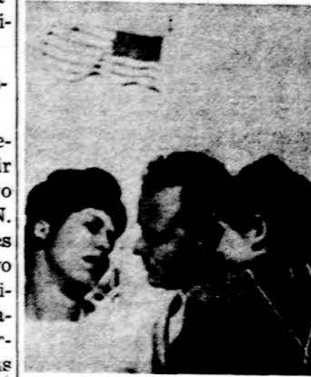
Anksčiau pabėgęs kubietis tėvas Miami aerodrome sustinka žmoną ir dukrelę, kuri dar nebuvo gimusi, kai jis turėjo bėgti iš tėvynės.

Pagal rumunų dienraštį "Scinteia" Titulescu buvęs ne tik politikas, bet ir patriotas. Gi beveik tuo pačiu metu, kada Rumunijoje buvo pagerbiamas "buržuazinių laikų" politikas, Rumunija savo norą būti nepriklausoma demonstravo Maskvoje, vos kelias dienas prieš 23-į komunistų suvažiavimą. Naujasis rumunų ambasadorius, įteikdamas kredencialus A. Tarvybos prezidentui pirmininkui Podgornui, pažymėjo, kad Rumunija norinti palaikyti glaudžius santykius su visais socialistinės pasaulio sistemos kraštais. Rumunija, ambasadoriaus žodžiais, norinti draugiškų, taikingų santykių su visomis pasaulio tautomis.