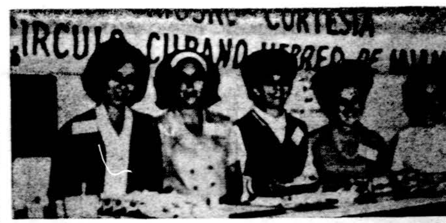
"Sveiki, Kubos broliai". Taip su užkandžiais sutinkami Kubos pabėgėliai, pasiekę Miami miestą.