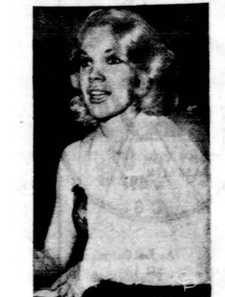
Akt. Carol Baker vaidindama išsuku ranka, bet nepaisant to ir toliau vaidina Indianapolyje, Ind. sukamame filme "Gentlemen Prefer Blondes".