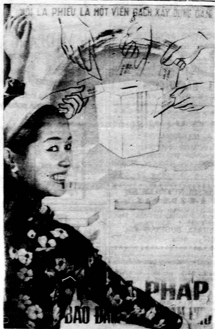
Jauna mergina rodo įvairiaspalvį plakatą, reklamuojantį rugsėjo 11 d. rinkimus Pietų Vietname. Jame skelbiama, kad "Kiekvienas balsas yra plyta demokratijai sukurti".