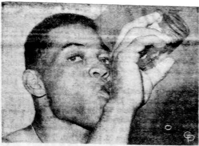
Willie May, išsiri ir gaivinas po sėkmingiausio žaidimo San Francisco mieste. Jis turi tik vieną kirtiką, kuris turi didesnę iatmėjimą.