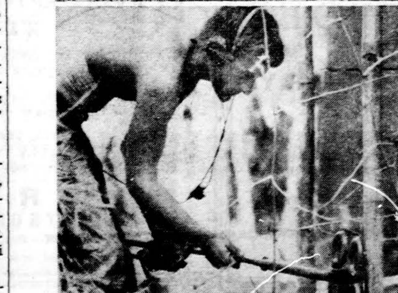
Sunkios kovos Pietų Vietname. Čia matome vieną karį su revolveriu rankoje ieškančią priešų tankiuose krūmuose, o kitą — ieškančią minų su specialiu įrankiu.