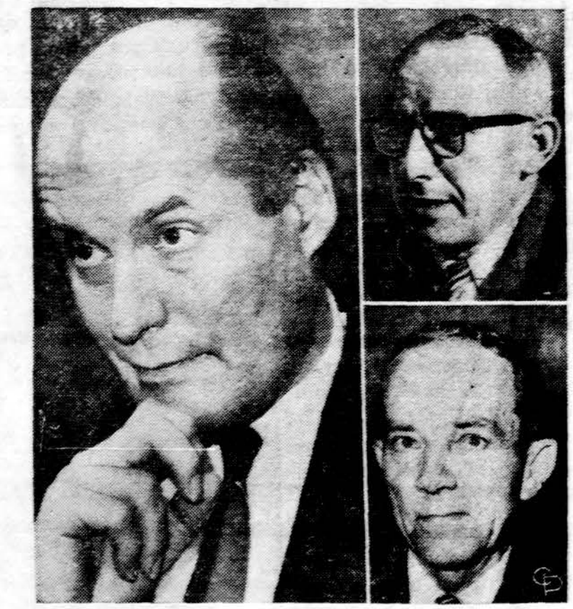
Nicholas De B. Katzenbach (kairėje), dabartinis teisingumo ministris (Attorney General), paskiras valstybės vicesekretoorium. Gi Eugene V. Rostov (viršuje dešinėje), buvęs Yale teisių fakulteto dekanas, nominuotas valstybės vicesekretoorium politiniams reikalams, o Foy D. Kohler paskirtas valstybės vicesekretooriaus pagalbininku irgi politiniams reikalams. Kohler yra ambasadorius Maskvoje.

Michailo Michailov, 32 metų, buvęs universiteto lektorius, buvo pajauktas ir pertrauktas, kad Jugoslavija yra diktatūrinė valstybė. Tardytojas ragino "pavyzdinčiai nuteisti" Michailovą, kad