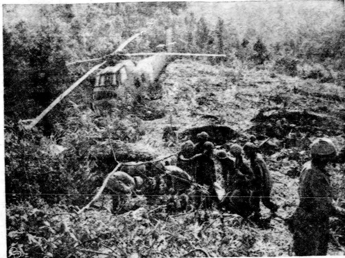
JAV-ų kariai pagelbsti numuštojo helikopterio įgulos nariams, o mariniai kovoja prieš komunistus, išėjusius iš požeminių tunelių, demilitarizuotoje zonoje tarp šiaurės ir pietų Vietnamo.

Šią savaitę prasidėjusi Jungtinių Tautų 21-ji gen. asamblėja savo dienotvarkėje tuo tarpu neturi nė vieno naujo labai degančio klausimo (net Vietnamo karas tebėra už gen. asamblėjos ribų), tačiau ji paveldėjo iš paskutiniųjų dviejų sesijų tiek daug svarbių problemų, kurioms sprendimų nesuradus pakabų ore ne tik J. Tautos, bet ir žmonijos svajonė gyventi ir tvarkytis be karų, be priepaudo, be išnaudojimo.