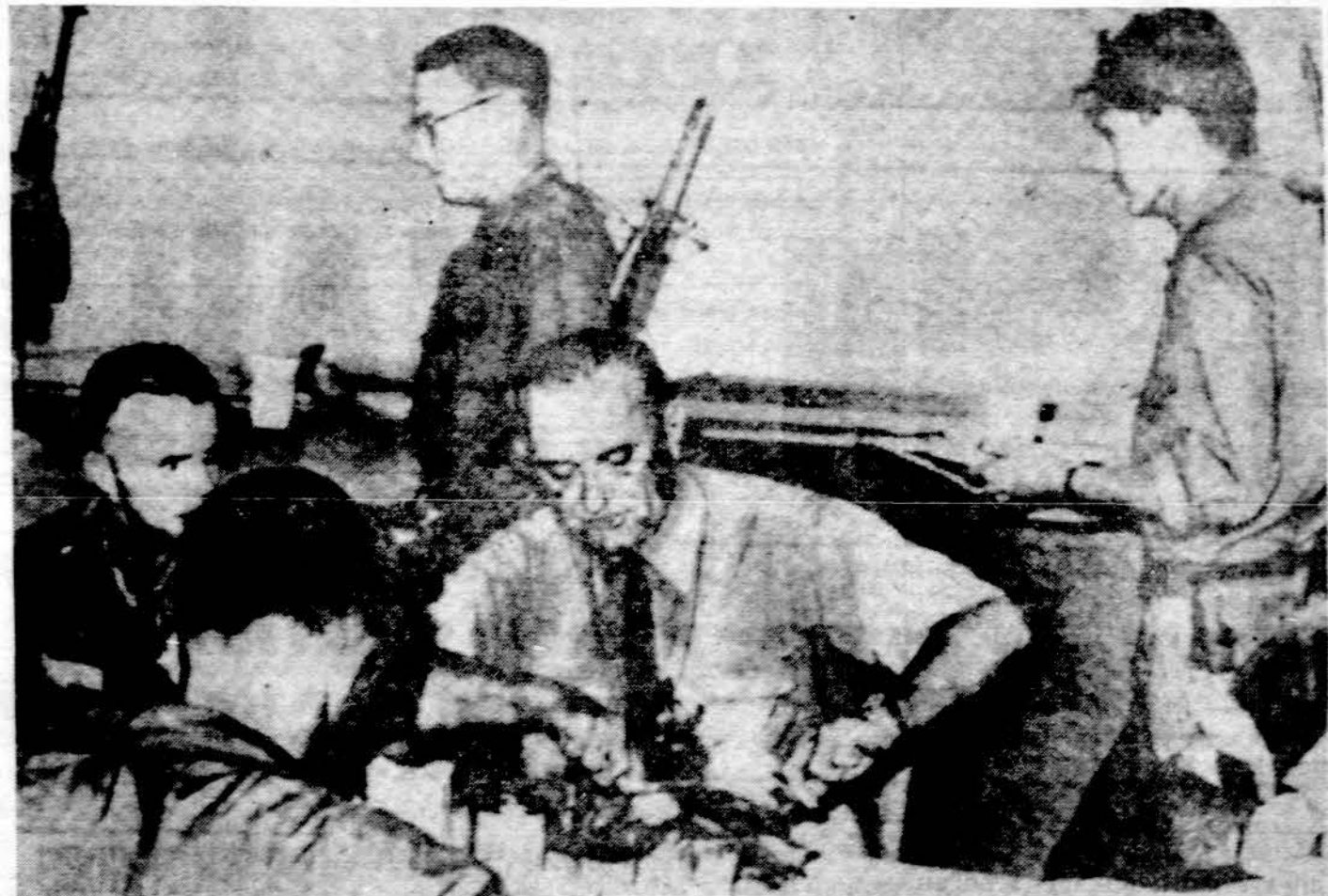
JAV-ų prezidentas Johnsonas valgė kartu su kariais trečiadienį amerikiečių bazėje Cam Ranh, Pietų Vietname. Dabar jis vieši Tailandė.

Vol. L Price 10¢ Printed in two parts SEŠTADIENIS, SATURDAY, SPALIS, OCTOBER 29, 1966 Šiandien Draugas 14 psl. Nr. 254