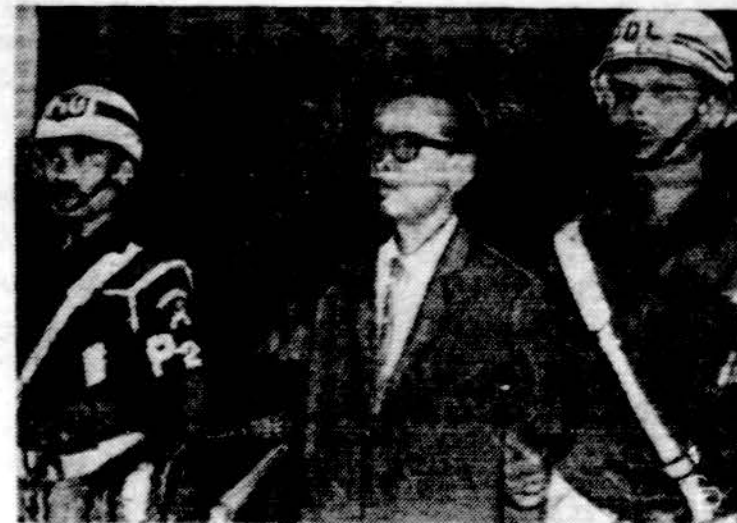
Nuteistas mirti. — Dr. Subandrio, 52 metų, buvęs Indonezijos užsienio reikalų ministeris, ramiai klausosi teismo sprendimo, kad jis pasmerktas mirties bausme už pagalbą komunistams, kurie bandė paimti Indonezijos valdžią prieš vienerius metus. Jis apsuptas karinių policininkų.

Oro biuras praneša: Chicagoje ir jos apylinkėse šiandien daugiausia apsiniaukę, vėsiu. Saulė teka 7:19, leidžias 5:51.