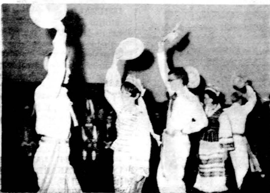
Taut. šokių grupė Neris iš Pittsburgho atlieka šokį Kepurinę.