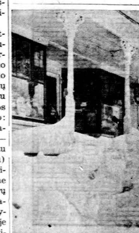
Šitai atrodo Mayville, N.Y., miestelis kai jame iškrito ketvertą metų sniego.

Gruodžio 18 d., sekmadienį, Chicago studentų ateitininkų draugovė rengia "subruzdėjamą" pas Tėvus Marijonus, Clarendon Hills, Ill. "Bruzdėdami" diskutuosim: Ko jie ten taip no-