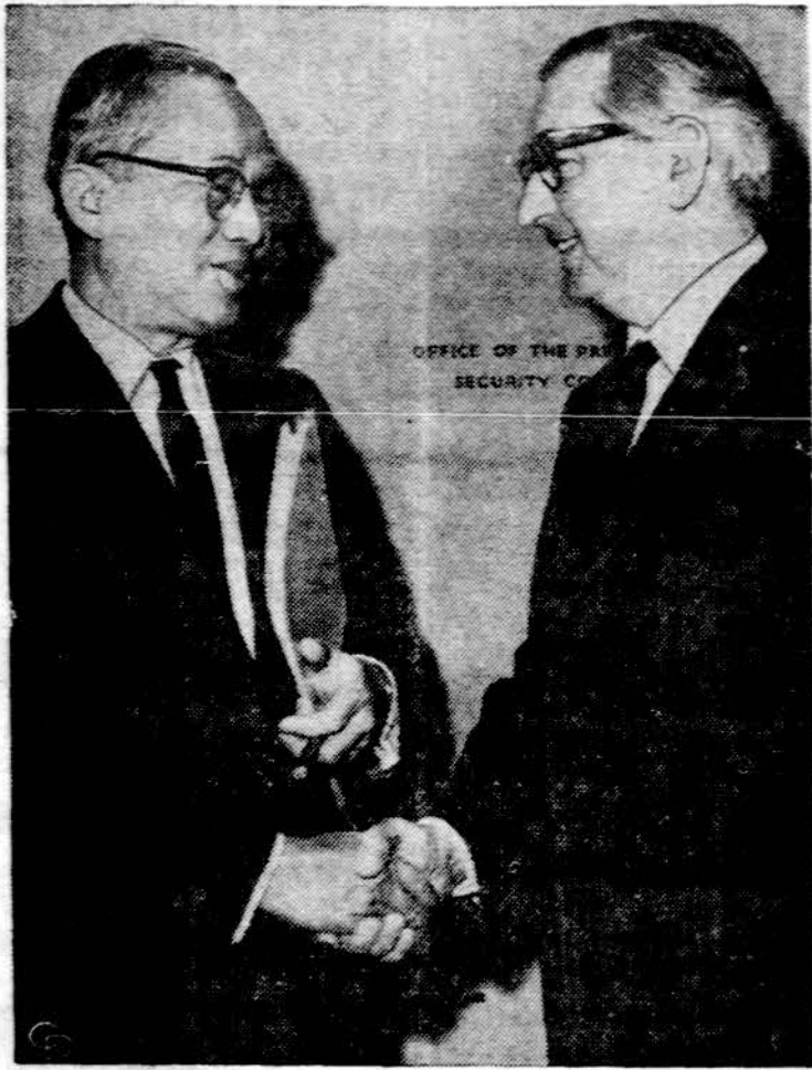
Jungtinių Tautų generalinis sekretorius U Thant (kairėje) sveikinasi New York'e su Britanijos užsienio reikalų ministru G. Brownu, kuris įteikė Saugumo Tarybai prašymą paskelbti privalomas ekonomines sankcijas atsiskyrusiai Rodezijai.

Vol. L Price 10¢ Šiandien Draugas 14 pusl. SEŠTADIENIS, SATURDAY, GRUODIS, DECEMBER 10, 1966 Printed in two parts Nr. 289