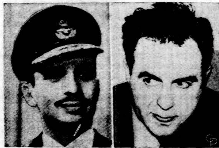
Arabai "nusilyginę" — Arabų lyga parodė "nusilyginimą" su Sirijos prezidento Atassi (dešinėje) vienu pareiškimu, kad "mūsų ginklai esą priemami visiem, kurie jų nori", siūlydamas nepatenkintiems jordaniečiams nuversti karalių Husseina (kairėje).

Damasko vyriausybė, norėdama nuversti provokarietį Jordano karalių Husseina, įvelia europiečius ir JAV-bes į Vidurio Rytų krizę.