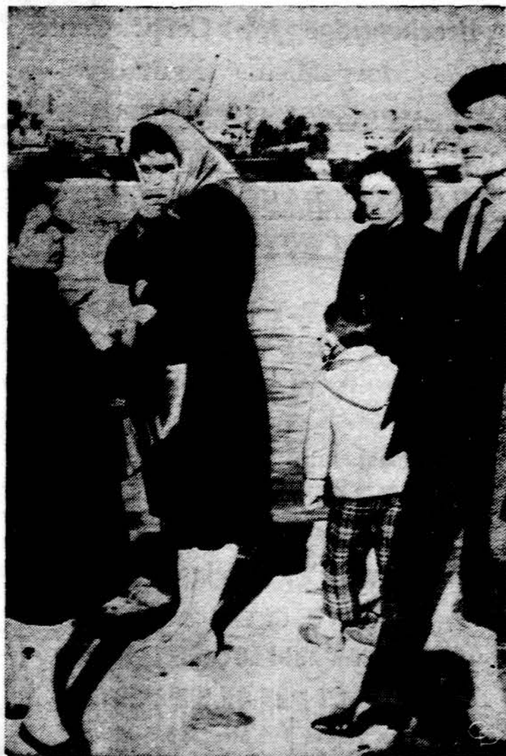
Giminės ir draugai keleivių, plaukusių nelaiminguoju Heraklion, su-sirūpinę laukia daugiau žinių Prėjaus uoste. Graikijoje. Laivas, audros sutriuškintas, nuskendo. Iš jame plaukusių 206 keleivių ir 75 igulos žmonių tik maža dalis buvo išgelbėta.

Šiandieną jis yra Joseph Franz Strauss vienmintis, ne-atiskiriamas Siamo dvynukas. Vakar jis buvo Adenauerio še-šėlis. O kuo jis bus ryt? Vokietijos stiprintojas ar jos silp-rintojas?