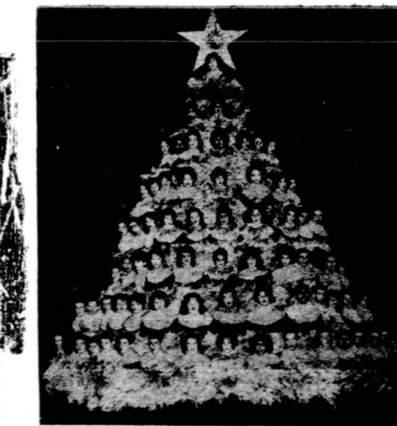
Gyva Kalėdų eglutė, sudaryta iš giedančių mergaičių. Denver, Colo.

ras karalijas į vieną reičą, ilgainiui tai pasirodė pražūtinga. Ar ištikrųjų amerikiečiai gali tikėtis, kad sujungtoji vakarų Europa visada bus ištikima JAV? Amerikiečiai nepasitiki de Gaulle, nes jis skirias nuo mūsų pažiūrų Europos gynimo, jos politikos ir santykių su likusiu pasauliu. Kaip mes galime būti tikri, kad didžioji Europos sąjunga nebus dar labiau mums priešinga ir, nepaklusni, nei de Gaulle Prancūzija?