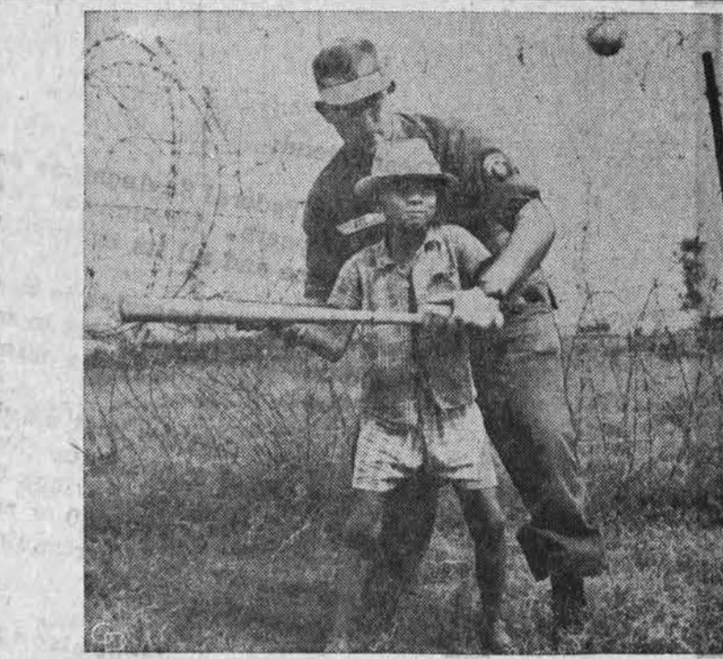
Nha Frang vietovėje Vietname Bethlehem našlaičių namų auklėtinį amerikietis karys moko žaisti beisbolą. Žaidimui įrankius paaukojo viena Californijos firma. Našlaitynė yra 150 vaikų.