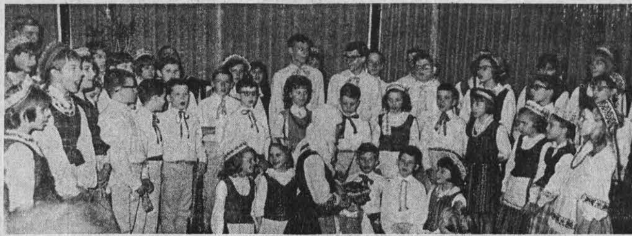
Ateities Atžalynas gruodžio 14 d. Dariaus ir Girėno posto salėje išpildė Kalėdinę programą Lietuvių Prekybos Rūmų narių pobūvyje.

Yra paskirta tuo tikslu Lietuvių Religinės Muzikos komisija, kurios nariais yra: kun. V. Budreckas, M. M., tėvas B.