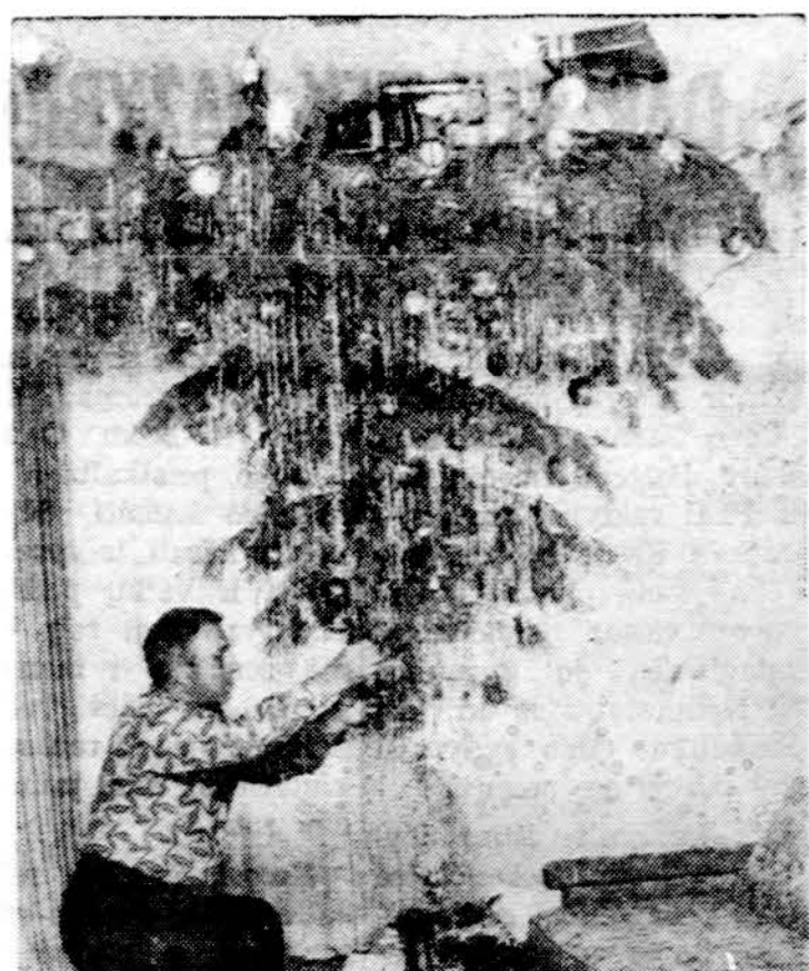
Inglewood, Calif. vienas pilietis eglutę paskabino prie lubų ir visa atrodo labai gražiai.

Mes manome, kad mūsų santykių perspektyvos politinėje ir ekonominėje srityje aiškios. Tačiau visus šiuos klausimus reikia nagrinėti. Tai ne tokie klausimai, kuriuos galima išspręsti per dieną arba savaitę. Žinoma, mūsų šalių socialinės sistemos yra skirtingos. Bet mes vadovaujamės tuo, kad jos,