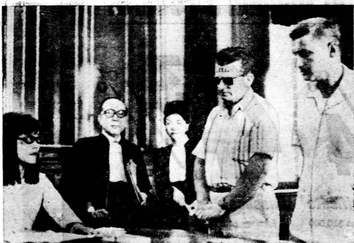
Saigone du amerikiečiai nubausti už spekuliaciją valiuta. Čia jie stovi teisme kuris priteisė po 5 m. kalėjimo.

Politiniam sustingimui Europoje užsitęsęs, pareikalaua ilgo tarpsnio ir daug kantrybės išlyginti Prancūzijos-Sovietų nuomonų skirtumus, ištrypinti šaltojo karo ledokūnias, nors abi šalys šneka apie šnerančio pavasario čiurkšles.