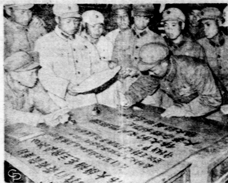
Pasirašo kovoti už Mao Tse-tungą. — Kariniai kiniečių vadai ir Kinijos revoliucinės armijos "kovotojai", turį bazę Hainan saloje pietinėje Kinijoje, pasirašė apsaugoti komunistų partijos pirmininko Mao Tse-tungo kultūrinę revoliuciją. Ši nuotrauka gauta iš oficialių komunistinių šaltinių.

Oro biuras praneša: Chicagoje ir jos apylinkėse šiandien dalinai apsiniaukę, aukščiausia oro temperatūra apie 30 laipsnių, rytoj — šalčiau. Saulė teka 7:01, leidžias 5:08.