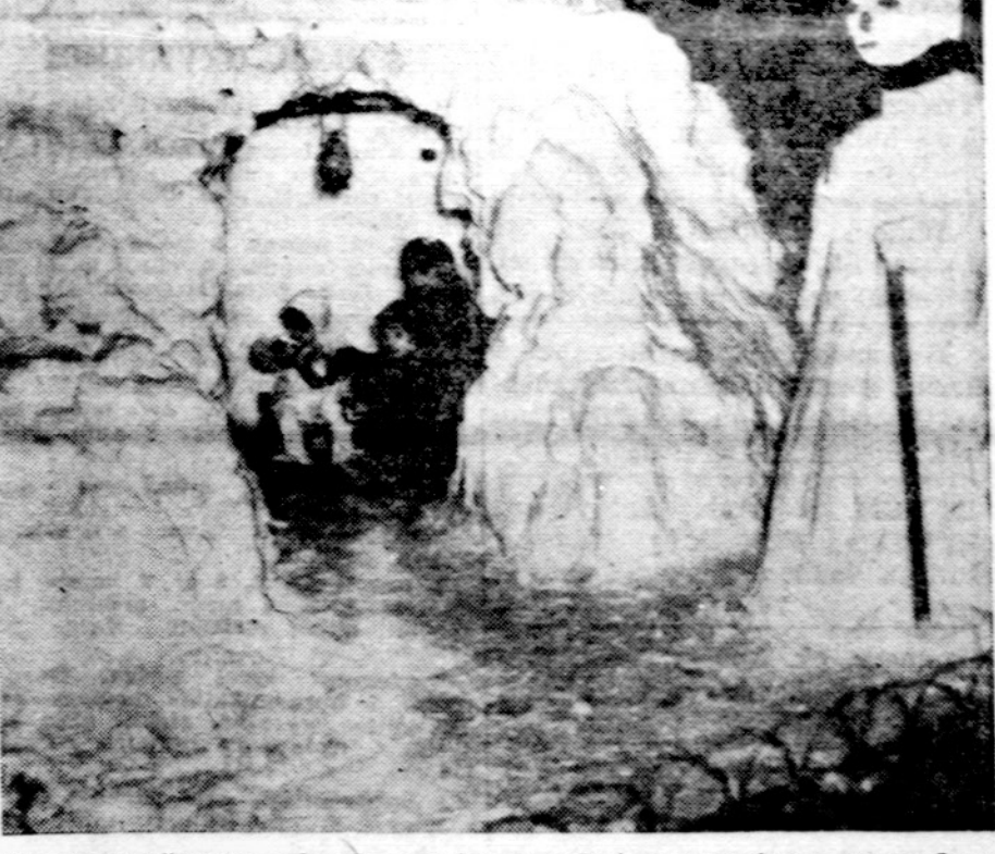
Chicagoje iškritęs rekordinis sniegas sudarė suaugusiems daug rūpesčio, o mažiesiems džiaugsmo, čia matyti trys mažieji besidžiaugiantys sniego tunelyje.