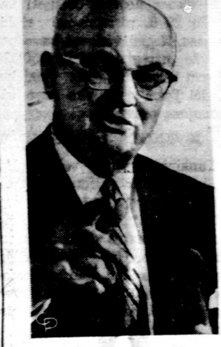
Kongr. Wright Patman, 73 m. yra bankų reikalų kongreso komiteto pirmininkas. Jis yra kongrese jau 38 m. ir nelabai su kuo besiskaito, todėl norima, kad jis būdamas to komiteto pirmininku labiau skaitytųsi su daugumos nuomone.