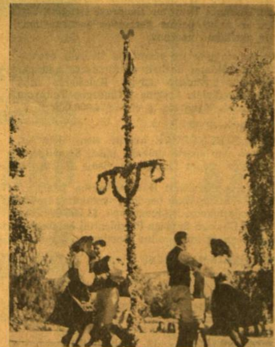
Sokio - sūkurijė - prie Gegužės stulpo.

Tokioje didžiulėje valstybėje (ploto atžvilgiu didesnėje už Italiją) yra provincijų, kurios vis dėlto išsiskiria iš to monotoniško veido savo klimato įvairumu. Kai pietinėje dalyje — javų aruode vaikai jau pavasario pabaigoje skina gėles, tai pačioje šiaurėje lapų vaikai dar slidinėja kalnų slėniuose. 1.7 Švedijos yra Arktikos artumoje, kur kalnuoti plotai apie pusmetį būna visada užšalę. Čia žiemą apie 10 tūkst. dar primityviosios sąlygose paliktų lapų išgyvena 50 tamsių dienų ir naktų. Švedijos lapiai, kaip ir S. Amerikos indėnai, su savo kalba (suomišku dialektu) gyvena prie didžiųjų geležies rūdos kasyklų. Dalis jų yra klajokliai ir žingsniuoją paskui elnių bandą pavasarį į kalnus, o rudenį į lygumas.