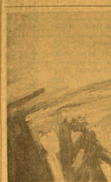
Vida Krištolaitytė "Opaline" (aliejus). Nuotr. Ged. Naujokaičio

bėms ir t. t. Stambi visuomenės parama aukų formoje todėl įgyja esminės reikšmės — be jos žurnalas negali išsilaikyti. Daigiant nereikia užmiršti, kad Lituanus yra Studentų sąjungos vaikas. Dėl šios aplinkybės Sąjunga už jį neša didelę teisinę atsakomybę. LSS Centro valdyba, kiek galėdama, pavyzdinčiai remia žurnalą; ar pavienis studentas dėl to turi teisę pagailėti net vieno dolerio?