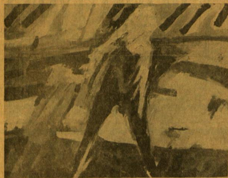
Vida Krištolaitytė Figūra gamtovaizdyje (aliejus).

Atrodo, kad dažno lietuvių jaunuolio pasimetimą teisingiau šitaip analizuoti, o ne ieškoti esmingesnės, galutines tuš-