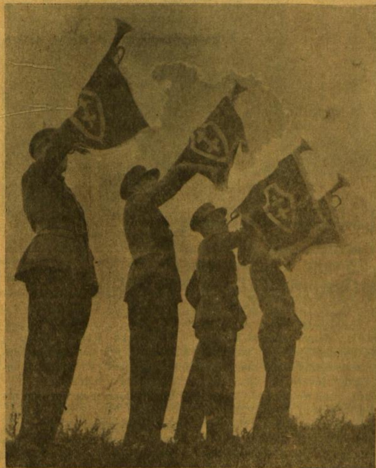
Šaulių trimitininkai Laisvės šventėje nepriklausomaj Lietuvoj.

Poeto atviras ir herojiškas tikėjimas mumis, šauksmas mūsų sąžinėn atsispindi "Neparašytuose laiškuose". Tai stipriausi ir giliausiai išjausti nežinomojo poeto eilėraščiai savo paprastumu ir tragišku savos egzilės pajutimu skerbiasi mūsų sąžinėn: (Nukelta į 2 psl.)