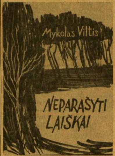
Knygos viršelis, pieštas Pauliaus Jurkaus