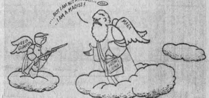
Pasikalbėjimas. Kinijos raudonųjų mokslo mokytojas Marksiui pareiškė, kad jis nėra marksistas, bet maoistas.

Oro biuras praneša: Chicago- je ir jos apylinkėje šiaudien ga- limas sniegas ar lietus. Saulė teka 6:31, leidžiasi 5:37