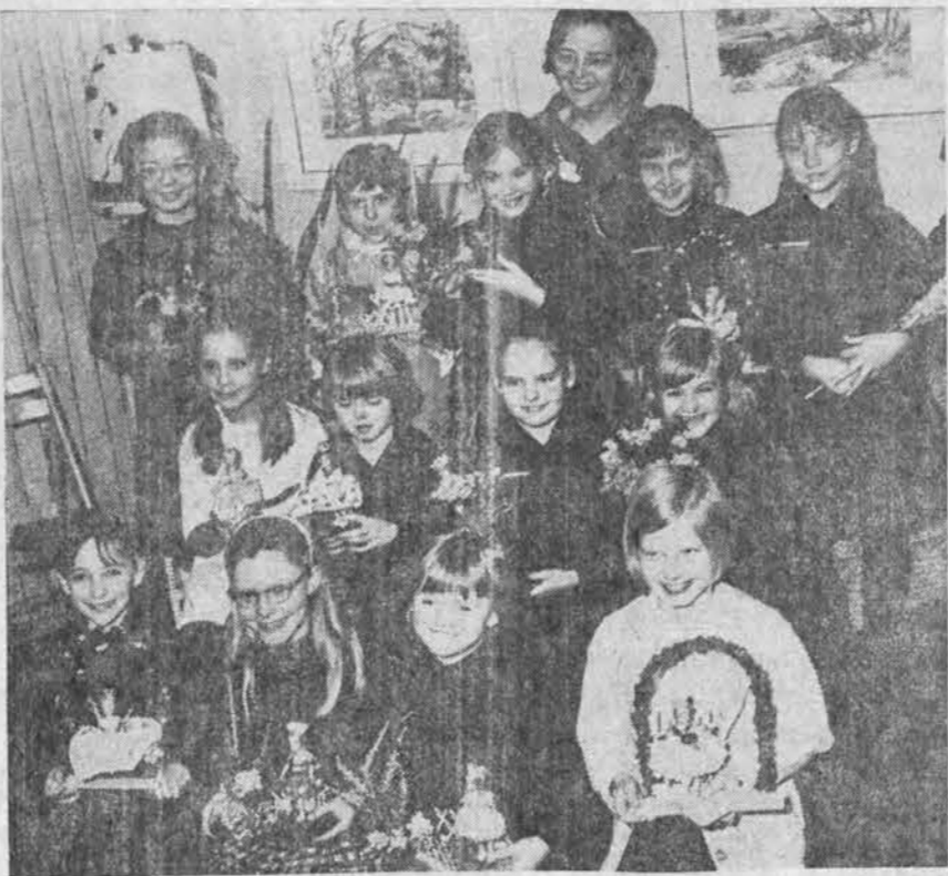
Dalis Clevelando jaun. skaučių (iš Eirutės ir Laimutės draugovių) su savo darbeliais laukia Kaziuko Mugės iš gausių lankytojų. Mugė įvyks kovo 5 d. Sv. Jurgio parap. salėje. Nuotr. J. Garlos