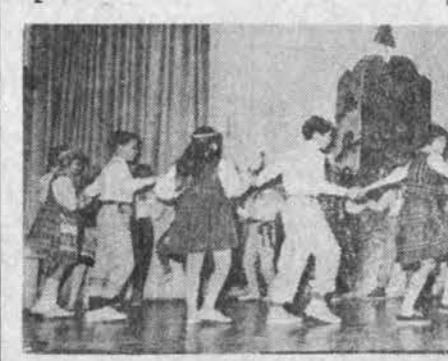
Donelaičio m-los Vasario 16 d. minėjime III ir IV skyr. mok. šoka tautinius šokius.