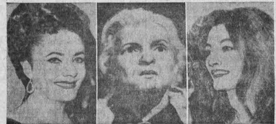
Elizabeth Taylor, "Who's Afraid of Virginia Woolf?" Ida Kaminska, "The Shop on Main Street" Anouk Aimee, "A Man and a Woman"

Sie aktorjai pristatyti geriausiame metų aktorijos vardu gauti. Apačioje nuotraukų surašyti pavadinimai filmų, kuriose jie vaidino.