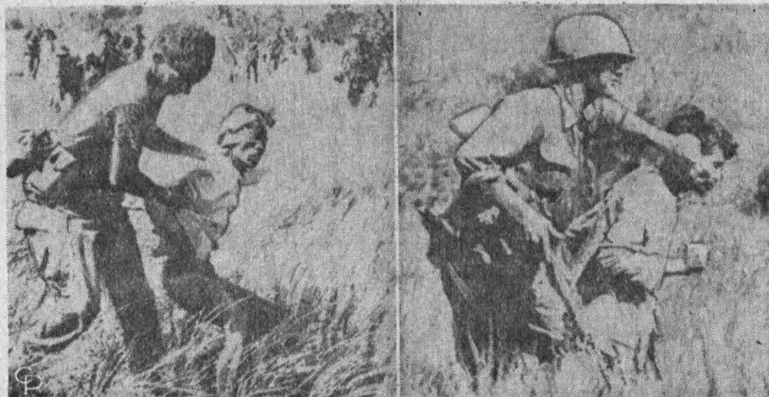
Amerikiečiai kariai veda iš džiunglių sugautus komunistus. Tai vyksta operacijos Stone 2 metu, netoli Quang Narn, Pietų Vietname.

— Kanadoje uždabū vidurkis 1966 m. buvo toks. 15,182 gydytojų — 21,474 dol., 8,328 advokatų — $17,282, 2,621 inžinieriaus ir architekto — $16,801. Toliau seka dantų gydytojai su $14,909, kvalifikuoti buhalteriai — $13,201, finansinių bendrovių savininkai — $14,843, nekilnojamojo turto pardavimo įstaigų savininkai — $8,626; profesorių ir mokytojų vidutinis uždarbis $5,087.