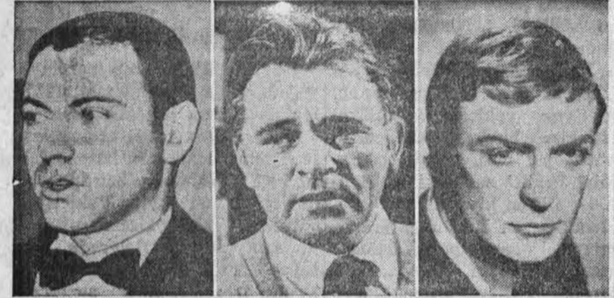
Alan Arkin, "The Russians Are Coming..." Richard Burton, "Who's Afraid of Virginia Woolf?" Michael Caine, "Alfie"

Top Wages And Overtime Other Benefits APPLY AUTOPOINT COMPANY 1801 W. Foster Ave. Tel. — LO 1-3200 An equal opportunity employer