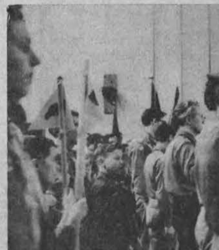
Lituanicos tunto skautai šv. Jurgio šventės sueigoje Bogan mokyklos sporto salėje.