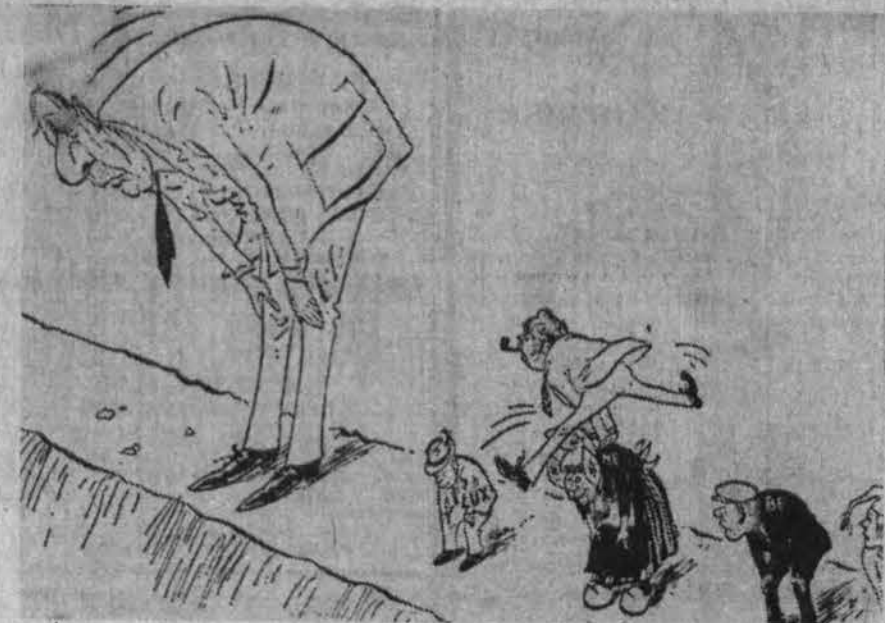
Lenktynės į Europos ekonominę bendruomenę su klūpimais. — Anglijos ministeris pirmininkas Wilsonas greitai bandysias įsijungti į Europos Bendrąją rinką, remiant jo žygi Benelux valstybėm, bet kelyje gali sutikti didelę klūtį — generolą de Gaulle.

— Melbourne, Anstralijoje, sustojo tramvajai ir autobusai, kai tramvajaus atėjęs vairuoti anglas buvo apsiavęs rudais išėjimais batais, o vadovybė iš jo reikalavo būtinai apsiauti taisyklių reikalaujamais juodais.