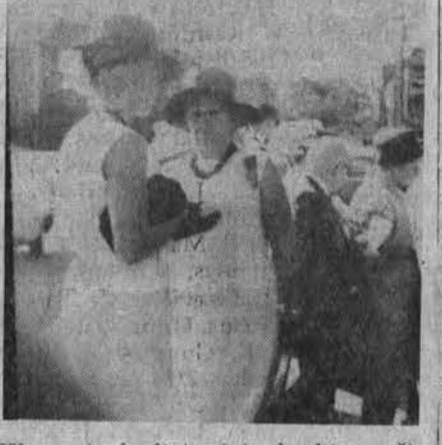
Worcesterio lietuviai laukia vyčių programos prie Sv. Kazimiero parapijos.

Šio pobūdžio vyčių vakarai yra labai mėgiami Worcesterio