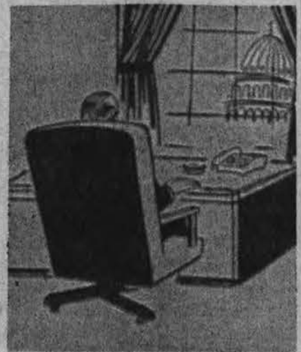
Prez. Johnsonas... paskutinį žvilgsnį per B. Rūmų langus.

Vokiečių spaudoje paskelbto, bet už geležinės uždangos paruo