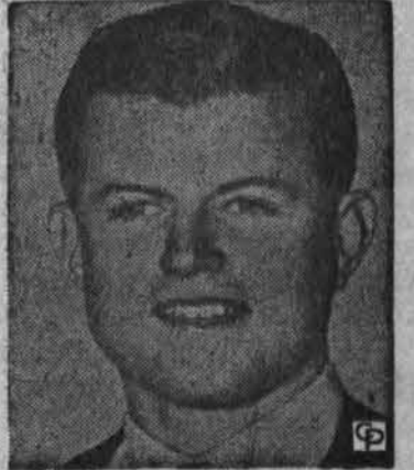
Sen. E. Kennedy, naujasis demokratų daugumos vado senate pavaduotojas — arčiau B. Rūmų?