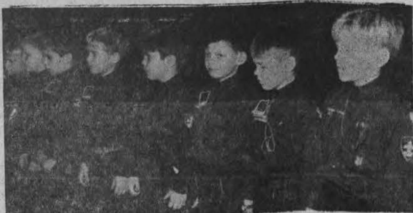
Bostono vilkiukai pasirošę įžodžiui iškilmingoje Žalgirio ir Baltijos tuntu sueigoje.