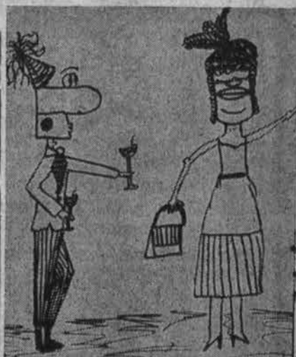
Laimingų Naujųjų Metų! Piešė Rasutė Arbaitė