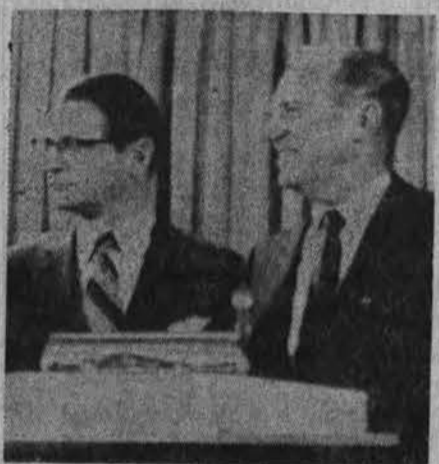
Užsienio politikos vairuotojai naujoje R. Nixono vyriausybėje: valst. sekret. W. P. Rogers (dešinėje) ir neseniai paskirtas pirmasis pavaduotojas E. Richardson (kairėje).

Prieš naujo "neo — stalinizmo" atsiradimą galėtų atspirti ne tik intelektualinė, bet politinė laisvė ir ryžtingesnė pačių gyventojų veikla. Kaip teigia estai