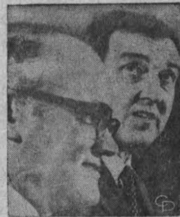
Sen. E. Muskie, buvęs viceprezidentinis kandidatas (dešinėje) ir Atst. Rūmų narys O'Hara, abu demokratų partijos žmonės, Kongreso naujai sesijai prasidėjus.

Libano spauda puolė Yafi vyriausybę, nes šioji, siekdama apiraminti Izraelį, pradėjusi per sekioti krašte veikiančius Palestinos partizanus. Izraelio pasienio gyventojai dabar grasina: jei nebūtų paleisti partizanai, tie gyventojai vykdytų streikus bei demonstracijas. Šiuo metu viešoji krašto nuomonė reikalauja, kad partizanams būtų teikiama parama.