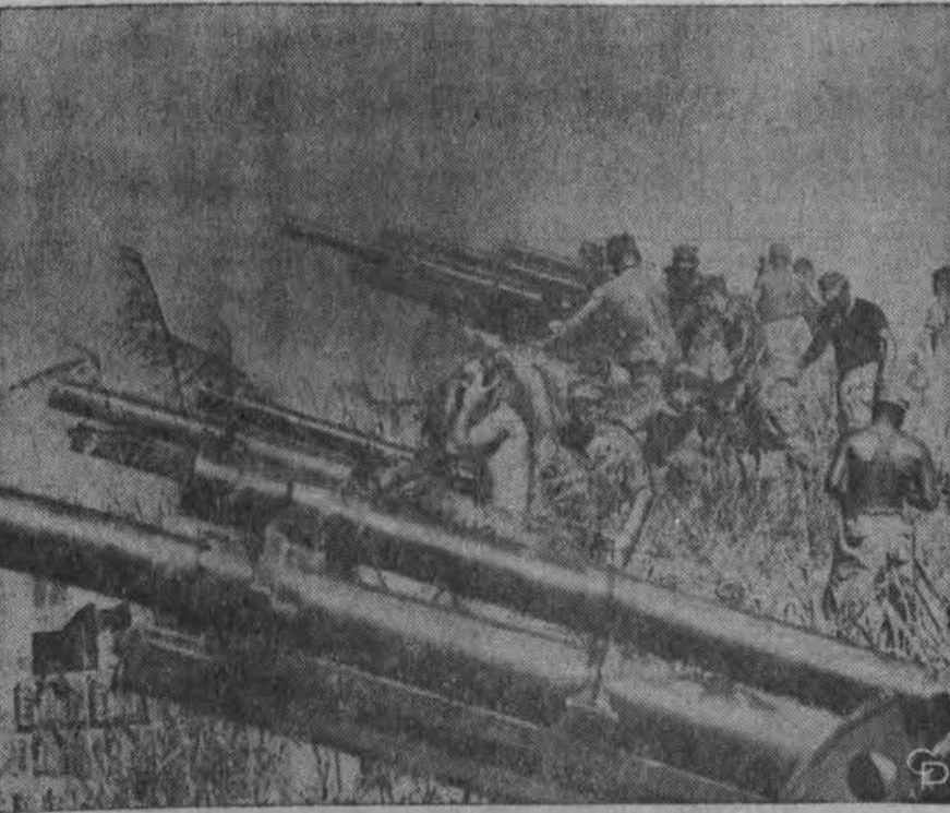
Vietnamo fronte — čia JAV marinų patrankos ties Dong Ha, netoli Laos pasienio, kur 5.000 sąjungininkų dalinių pastaruoju metu vykdė priešū valymo veiksmus