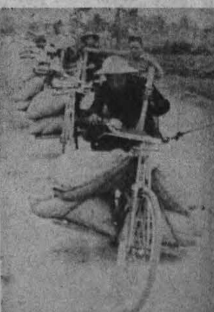
S. Vietnamo gyventojai pristato dviračiais maistą ir karines medžiagas

Prieš režimą nusistatę kėlė nepalankius šūkius ir buvo alyva apipylę kelią, kuriuo prezidentas iš aerodromo vyko į miestą.