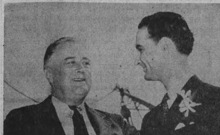
Buvę prezidentai: F. D. Roosevelt, turėjęs įtakos neseniai pareigab B. Rūmose baigusiam L. B. Johnsonui, anuomet liekam senatoriui (dešinėje).

● Hong Kongo gripas įsigalėjo Sovietų S-gos miestuose. Specialiai tarnybai pašaukta 3.000 gydytojų.