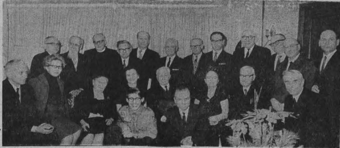
Lietuvių istorijos dr.-jos nariai, dalyvavę susirinkime A. Rūgytės bute Chicagoje.