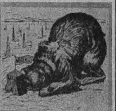
Sovietai rausiasi ir Art. Rytuose...

● Čių kraštų min. pirminkais. Svarstyta, kokių griebtis priemonių prieš demonstrantus.