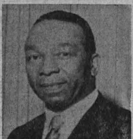
Washington, sostinės meras

R. Nixono rūpestis supranta mas, kai pažvelgiama į pastarojo meto statistinius duomenis nusikaltimų srity.