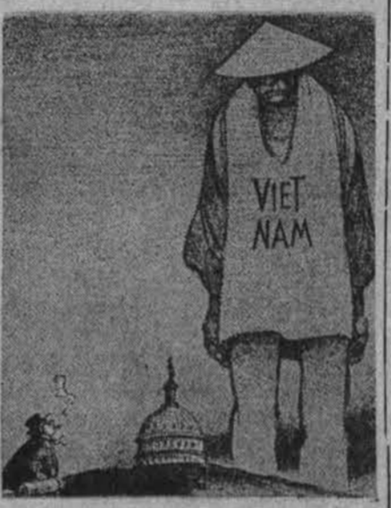
Vietnamo šmėkla tebeslegia Washingtoną...

Komisija teigia, kad šių dienų Amerikoje įsigalėję smurto reiškiniai aiškiai grėsmingi krašto socialinės tvarkos pa-