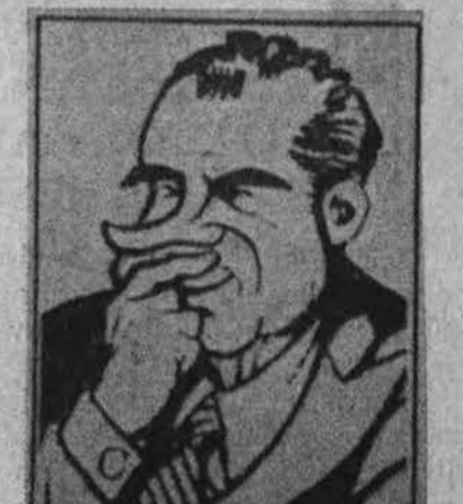
Krašto karikatūristai tebeieško būdų pabrėžti būdinguosius naujojo prezidento R. Nixono veido bruožus...