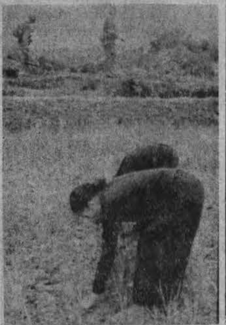
Ryžių derlius, vietnamiets dirba ūkyje, gi netoliese siaučia karas...

Manoma, kad ne kas kitas, bet minėta "Pažangioji" partija paskleidė lapelius, skiriamus universiteto vadovybės "išjungtam" 61 studentui. Į juos kreij revoliucionierių eiles. Jau nebesate studentais. Išjunkite revoliucionierių eiles". Jau patirta, kad "Pažangieji" skatino studentus, be pirminių reikalavimų universiteto vadovybei, pareikšti dar naujus ir vis griežtesnius bei neįmanomus vykdyti reikalavimus.