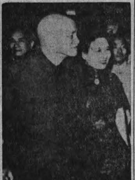
Azijos tautų laisvės diena paminėta New Yorke. Čia Taut. Kinijos prezidentas Ciang-kai-Sek su žmona