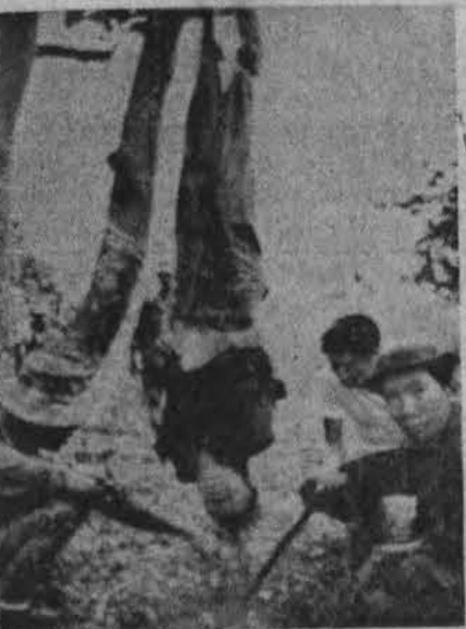
Vaidzas P. Vietname — sučiuptas ir pakartas Vietkongo partizanas

• Žibalo danga, atsiradusi, vamzdžiui plyšus, ties Kalifornijos pakraščiais, jau pasiekė Santa Barbaros įlanką. Žibalo išsiliejo iki 150.000 galonų ir jos apimtis vandenyne — 800 kv. mylių.