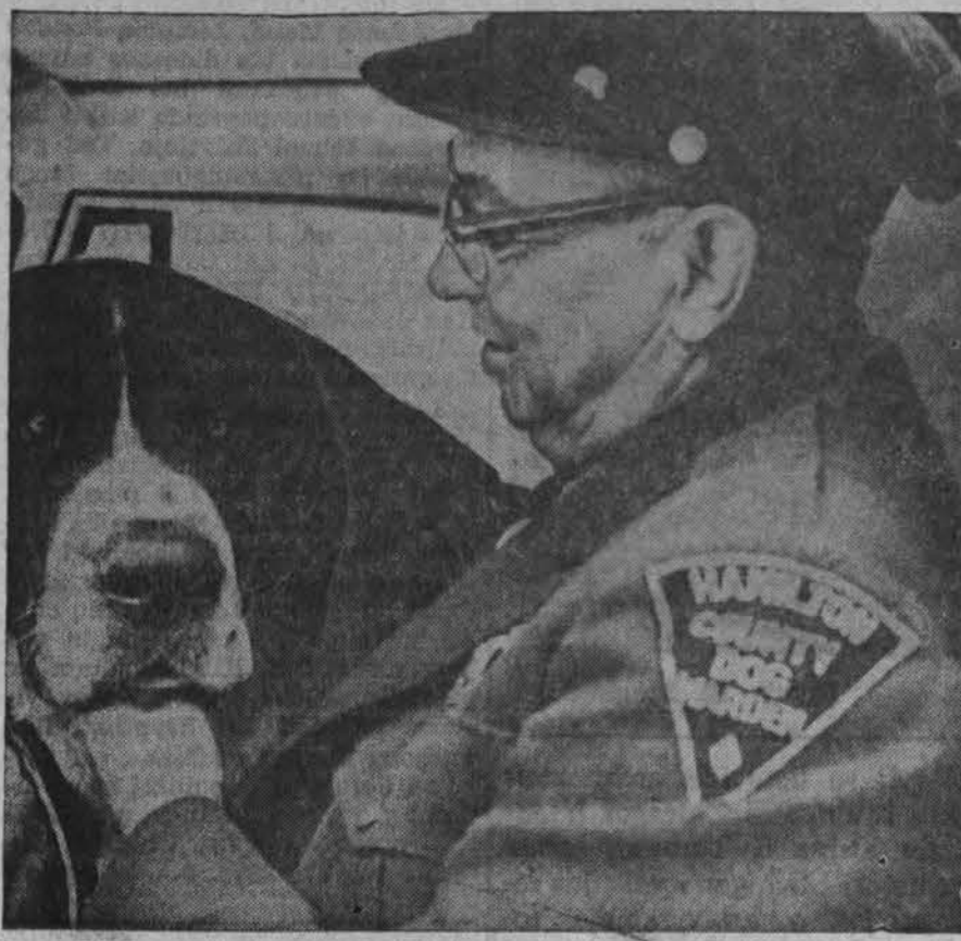
Bernardinas šuo, 165 svarų, vėl buvo pagautas šunų gaudytojo Cincinnati mieste. Jau daug kartų jis taip pagauamas ir savininkui tai kainuoja kas kartą po 15 dol.