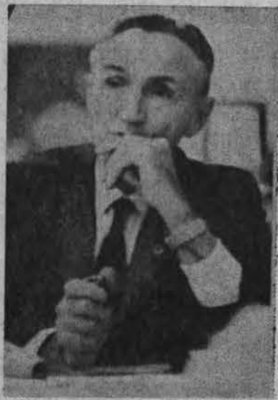
Sen. M. Mansfield pareiškė: "viršūnių" pasitarimas su Kremliumi būtų naudingas...