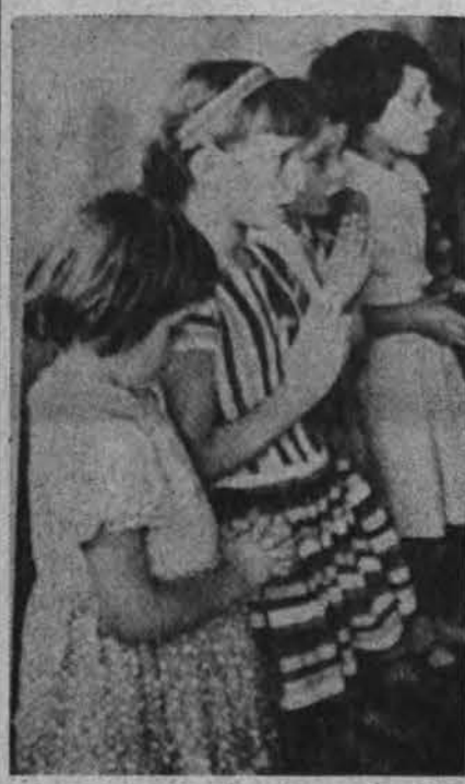
Ar vaikai turėtų melstis mokyklose? Vak. Vokietijos 67% gyventojų atsako: taip