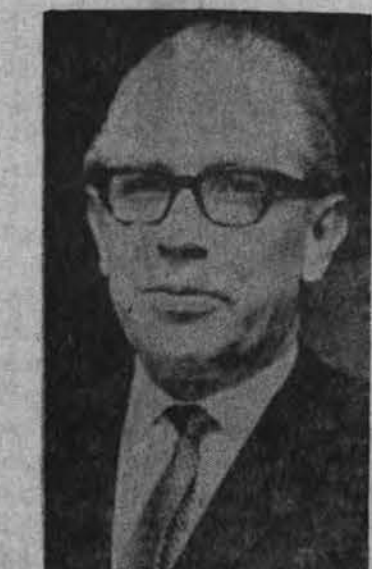
Kai-Uwe von Hassel, išrinktas, vietoje pasitraukusio E. Gerstenmeierio, naujuoju Fed. Vokietijos Bundestago (žemųjų parlamento rūmų) pirmininku. Jis yra buvęs gynybos ir pabėgėlių reikalų ministru Bonnoje.

BRIUSELIS. — Pirmasis mieštas, kurį Nixonas lankys — Briuselis. Čia bus proga tartis ne tik su krašto min. pirmininku Gaston Eyskens, bet ypač su NATO vadais. Krašte yra įsikūrusi NATO vyr. būstinė. Spėjama, kad bus progos naujam prezidentui susitikti ir su europinės Bendrosios Rinkos atstovais.