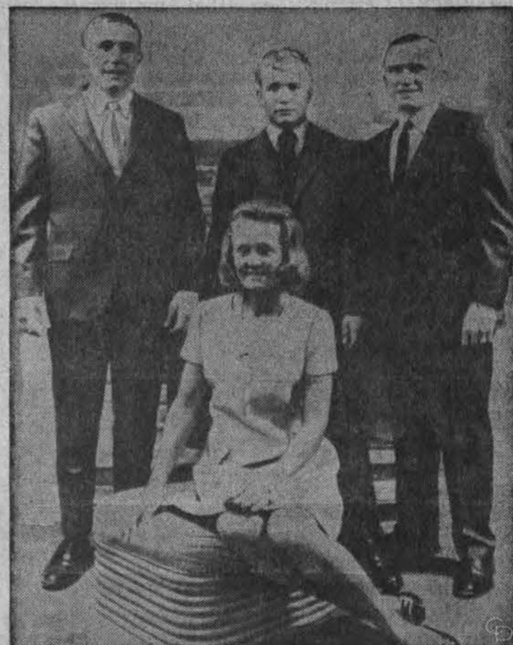
Astronautas Frank Borman, prez. R. Nixoni pavedus, šiuo metu vykdo 3 savaitę kelionę Vak. Europoje. Priešaky — žmona, astronautas dešinėje, iš kairės ab usūnūs, 17 ir 15 m. amž.

• Egipto prez. A. Nasser užvakar gavo du laiškus: iš prez. R. Nixono ir iš sovietų vadų.