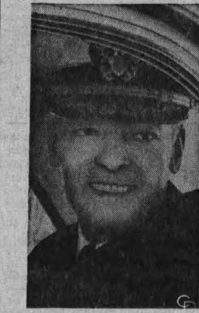
Pueblo laivo kapt. Lloyd Bucher šypsosi, vykdamas iš teismo Coronado, Calif., kur jis tardomas kodėl jo vadovaujamas laivas buvo pagrobtas Šiaurės Korėjos.

Avariją padarė tolimos respublikos atstovai." b. kv.