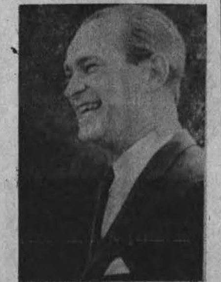
R. Helms, CIA — žvalgybos įstaiigos JAV-se viršininkas: mano įstaiga neturėjo nieko bendro su "Pueblo" laivu, jo paskirtimi