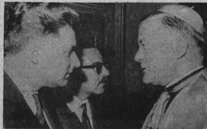
Mažasis dialogas: Jugoslavijos miesto Sibenik vyskupas vieno priėmimo metu kalbasi su komunistiniu burmistru.

Oro biuras praneša: Chicagoje ir jos apylinkėse šiandien galimas sniegas, vėjas, temp. apie 30 F., ryt — šalčiau, galimi lengvi sniego krituliai. Saulė teka 6:55, leidžias 5:14.