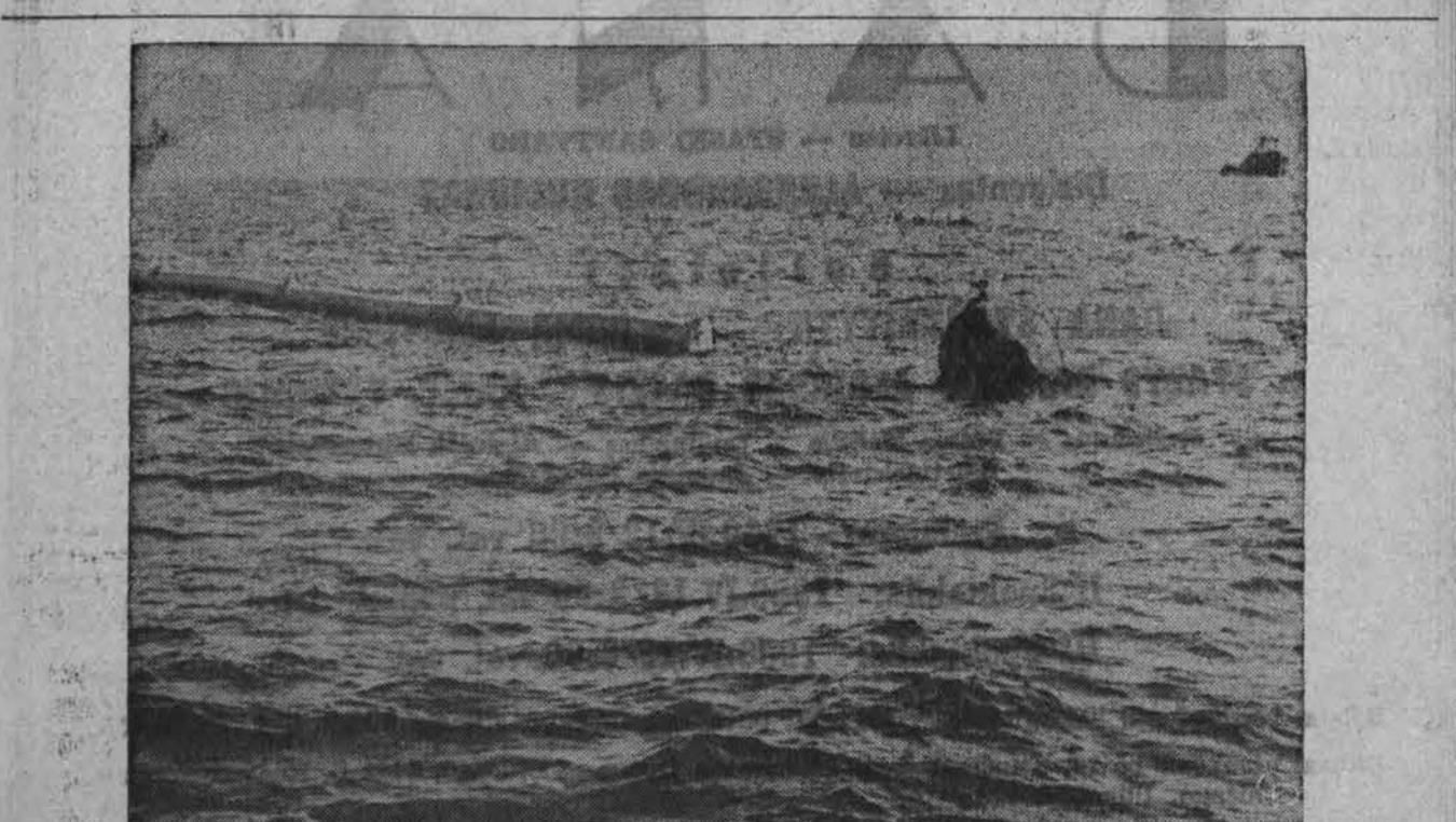
Netoli Santa Barbara Californijoje jūroje prakiuręs alyvos vamzdis užteršė jūrą. Dabar specialiais apsupimais keletos pėdų gylėje alyva uždaroama nuo tolimo snio skirstymosi į jūrą, specialiais prietaisais suvaroma į mažesnią plotą ir iš ten išpompuojama. Taip apvaloma jūra nuo didesnio užteršimo.