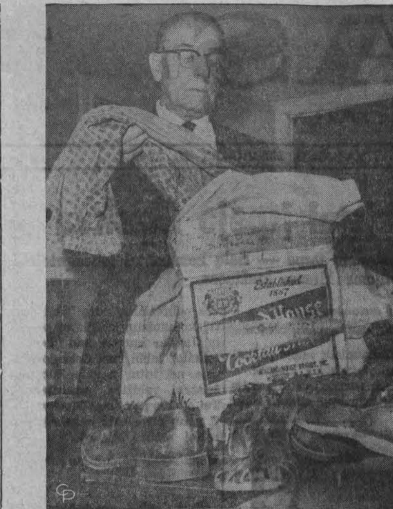
Kongreso narys H. R. Gross (R-Iowa), kuris reikalauja pakelti kongreso nariams metines algas 12,500 dol., gavo siuntinį kongresui, senų batų ir kitokių drabužių iš Kalifornijos, kurie esą skirti vargšams kongreso atstovams.