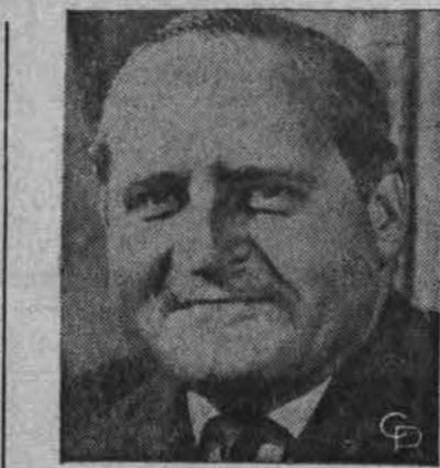
Gerard Smith, paskirtas Ginklu kontrolės ir nusiginklavimo įstaigos direktorium Washingtone.