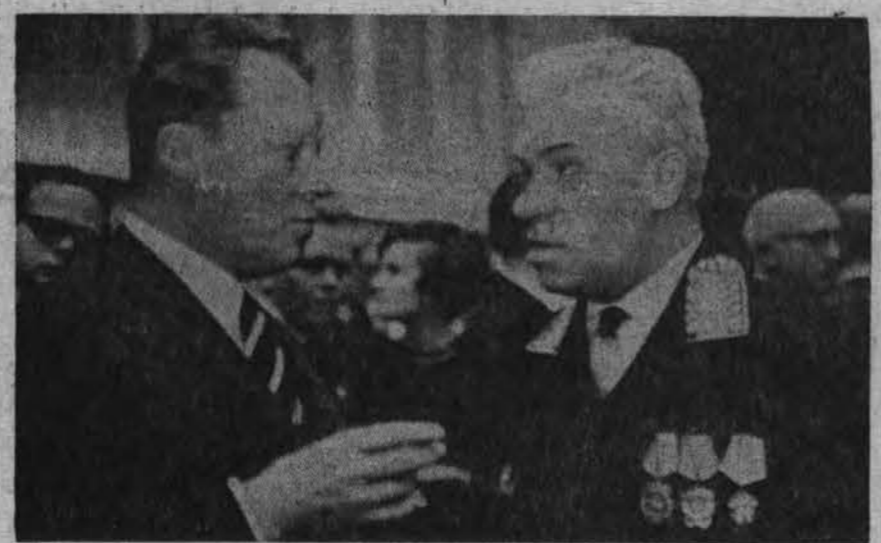
Maskvos ir Bonnos santykiai vėl aktualėja — ambasadorius S. Carapkin (dešinėje) įteikė naują notą vak. vokiečių užsienio reik. vadovui W. Brandtui (kairėje).

● A. Dubčekas ir prezid. L. Svoboda kalbėjo Prahoje, susitikę su sovietų aukštąsiais kariniais. Abu nurodė į reikalingą stiprinti ryšius su sovietais. Jie išpėjo, kad busią kovojama prieš dešiniųjų ir kairiųjų pasipriešinimą. Esą, kraštas neseniai nugalėjęs vieną svarbiausių krizių.