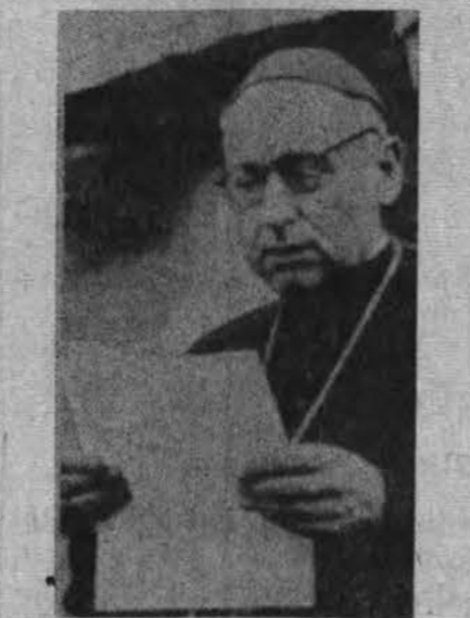
Kard. J. Mindszenty pasiryžęs nepašaukti JAV ambasados rūmų Budapeste.

Italų komunistų vadas pasisakė palaikąs "visišką kiekvienos komunistų partijos autonomiją bei suverenumą" ir atmetė Maskvos pabrėžiamą norą "vadovauti" komunistų judėjimui pasaulyje. Jis dar nurodė, kad "bendro reikalo" labai "nei Čekoslovakijoje, nei kitur negalįs būti pažeistas valdžios autoritetas". Tai aiškūs išpėjimas Maskvai — ji neturinti siekti pakeisti liberalinį režimą Prahoje.