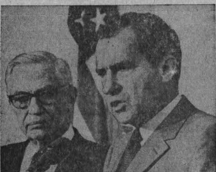
Prez. Nixon pareiškė, kad jis skirsias mokslo reikalams daugiau pinigų. Su prezidentu čia matyti mokslo reikalams patarėjas dr. Lee Dubridge. Prez. Nixon teigia, kad buvęs prez. Johnson padarė klaidą, apkarpydamas mokslui skiriamas lėšas.

El Fata sustiprino 1967 m. pralaimėtas karas. Jos vadovai sukrėtė arabų valstybių vairotojus šiuo pareiškimu: "Dėkui Dievui už birželio 5 d. prasidėjusį pralaimėtą karą. Trečias arabų pralaimėjimas mums atnešė veiklos laisvę ir sudarė sąlygas atsikratyti arabų valstybių globos".