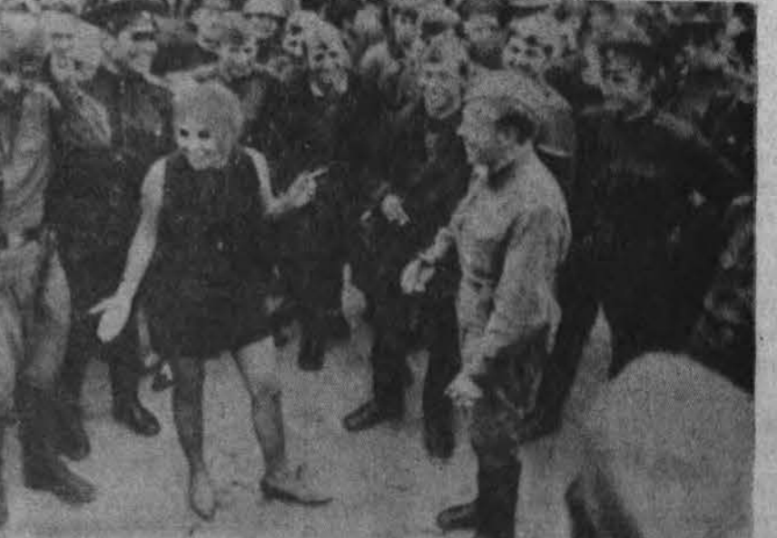
Okupantai Čekoslovakijoje ir mergina

Prezidentą, išvykusį į užsienį, remia net ir jo kritikai, o jam grįžus jis busias plačiau, išsamiau susipažinęs su visa eile opijų pasaulio klausimų. Be to, tiksliai, diplomatiškai, nieko neįžeidžiant parinkti ir prezidento numatyti aplankyti europiniai kraštai.