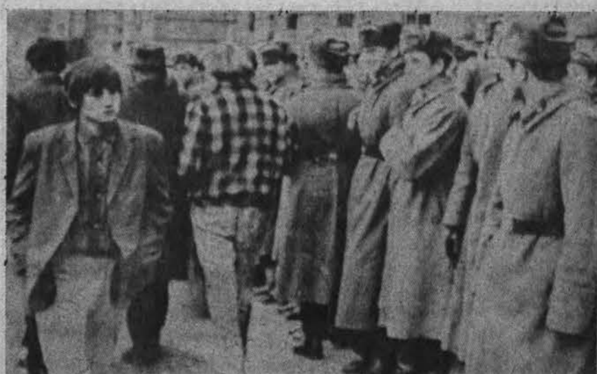
Cekoslovakijoje tebegresia nauji neramumai, priešinėmis okupacijai. Čia okupanto kariai ir abejingi praevialai.

Turkdjai JAV-bės pasiūlė 12,5 ml. dolerių paskolą geležies rūdos imonei pastatyti.