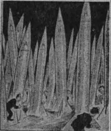
Pasaulis branduolinių ginklų gadyneje

Sirhan - Sirhan byloje, Los Angeles mieste, jau sudaryta prisiėkusiųjų kolegija: aštuoni vyrai ir keturios moterys. Manoma, kad byla užtruksianti 3 mėnesius.