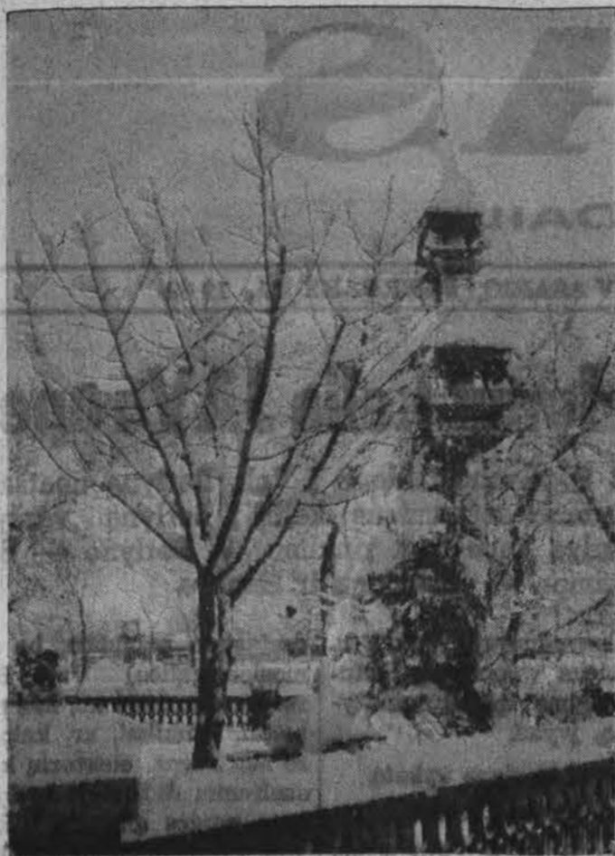
Lietuviškas grožis Alvydo būstinės kieme žadina žmoniškumą, nusitei- kimus.

Pasimokykime iš Sodomo - Go- moros gyventojų likimo. Liaukl-