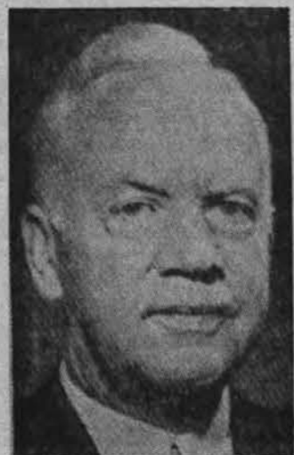
Heinrich Luebbe, ligi šiolinis Fed. Vokietijos prezidentas, birželio m. pasitraukė iš pareigų.