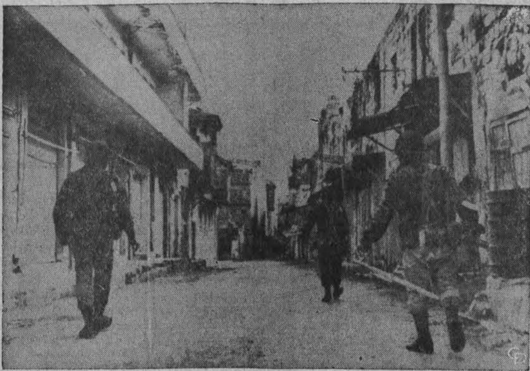
Israelio kareiviai žygiuoja Nablus mieste, kuris yra atimtas iš Jordano. Šiam 80,000 gyventojų miestui nustatytos išėjimo valandos.

Mašinos turi žmogui tarnauti Kas gi iš tikrųjų yra robotas?