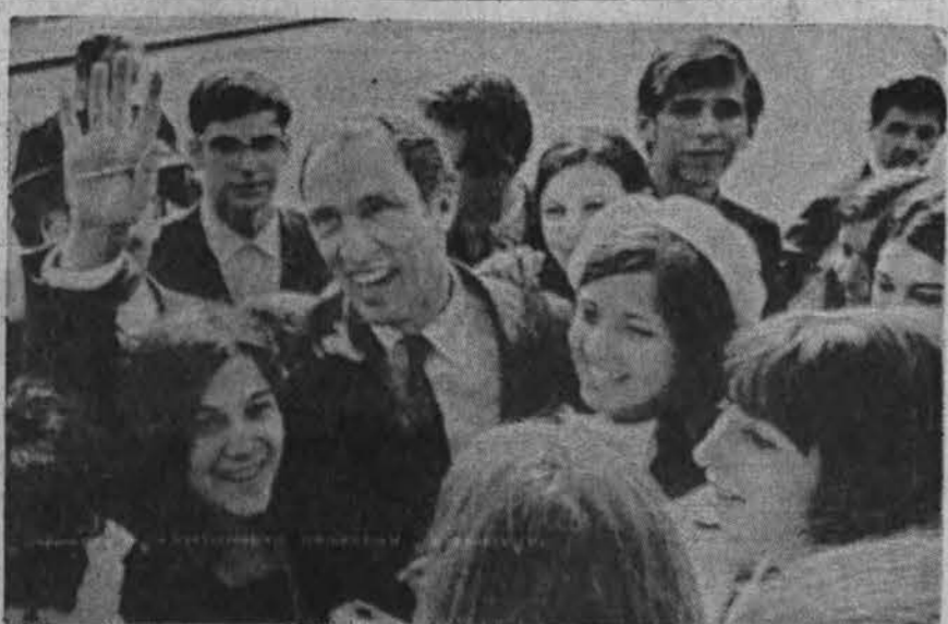
Kanados min. pirmininkas G. E. Trudeau, jaunas politikas, dažnu atveju kreipias spaudos dėmesį ir ne tik savo asmenis politikais, bet ir galimas sprendimus užsienio politikoje.