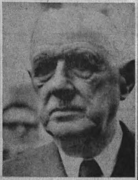
Prezidentas gen. de Gaulle — įvykiai, amžius, darbo našta ir pėsčakai veide.

• Izraelio lėktuvai puolė Jordano vietoves.