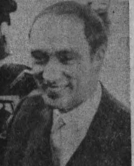
Pierre Elliot Trudeau — pasitraukti iš NATO, megsti ryšius su Pekino komunistais.

Būsimas sprendimas pasitraukti iš NATO stiejamas su Kanados įtaka bei svoriu tiek Europoje, tiek ir Washingtone. Klausama: ar verta sutaupyti 146 mil. dol., bet tuo pačiu metu atsisakyti Kanados žodžio, įtakos Europos ir ne tik jos, bet ir viso Amerikos kontinento gynybos atžvilgiu? Trudeau yra politikas, siekias didesnės krašto nepriklausomybės užsienio politikoje. Jis turi šalininkų, bet esama ir balsų prieš galimas pastangas krašto politiką vairuoti įtampos su Washingtonu kryptimi.