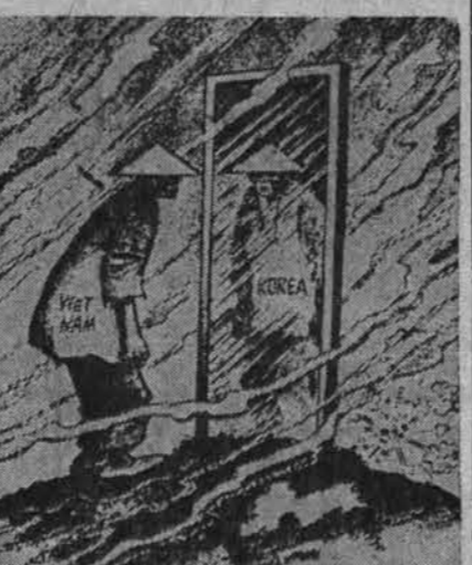
Ar Vietnamas neprimena Korėjos karo?

BERLYNAS. — Ar komunistai pasirengę sukelti naują krizę Berlyne? Tai klausimas, šiuo metu svarstomas Bonnoje, Berlyne, Washingtone. Vakarų stebėtojai atkreipė dėmesį į tai, kad R. Vokietijai vasario 9 d. paskelbus sausumos susisiekimo su Berlynu suvaržymus, kitą dieną į R. Berlyną atvyko Varšuvos sutarties kraštų karinių dalinių vadas maršalas Ivan Jakubovskis. Manoma, kad Jakubovskio kelionė neturinti ryšio su kovo 5 d. Vak. Berlyne numatytais Fed. Vokietijos prezidento rinkimais. Vis dėlto, jei komunistai pasirengę naujai krizei Berlyne, tai rytų vokiečių politikų pasitarimai su Jakubovskiu esą neišvengiami.