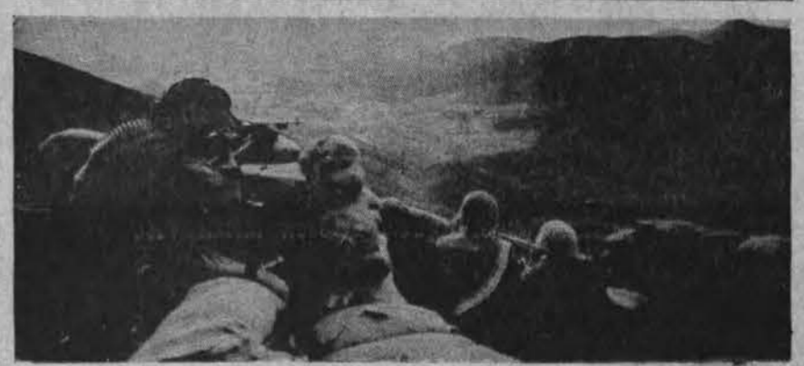
JAV kariai ties Da Nang Pietų Vietname

politikus ir kraštutinius liberalinio sparno atstovus, kurie pasisakė prieš Dubčeką pernai paskelbtas reformas.