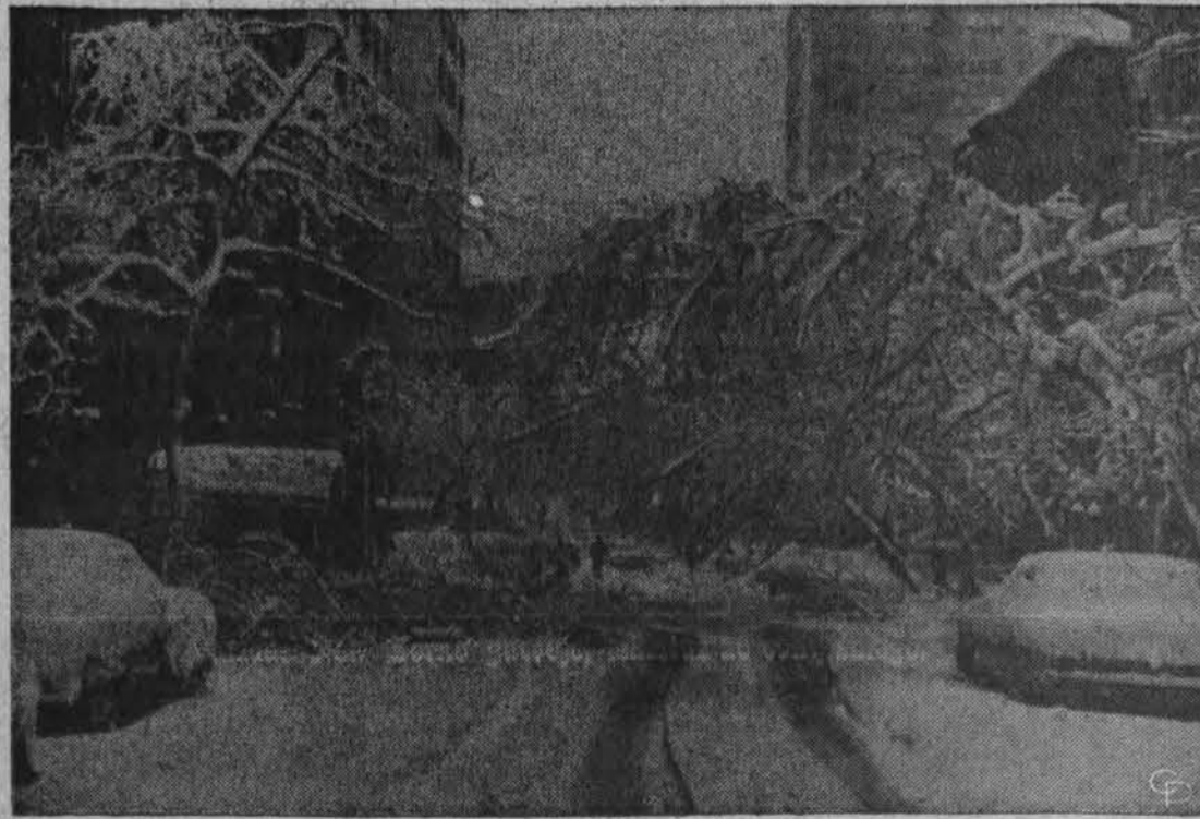
Vaiždas New Yorko gatvėje, iškritus 16 colių sniego.

Pirmad. .... 12:00 P.M. - 8:00 P.M. Antradi. .... 9:00 A.M. - 4:00 P.M. Trečiadi. .... Uždaryta visa d. Ketvirtadi. .... 9:00 A.M. - 8:00 P.M. Penktadi. .... 9:00 A.M. - 8:00 P.M. Šeštadi. .... 9:00 A.M. - 12:30 P.M.