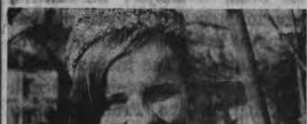
Laukianti Vasario 16-os

Žmonija ieško naujų kelių. Filosofas niekada nesitenkina ma-