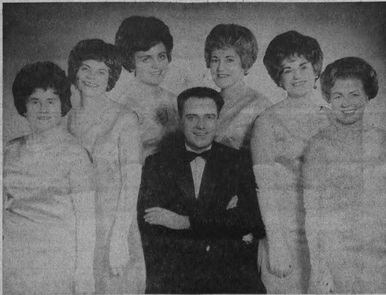
Žibuoklių sekstetas, kuris atliks programą Vasario 16-sios minėjime Newark, N.J.

PIGLAI DAŽAU KAMBARIUS. VALAU KILIMUS IR BALDUS. J. RUDIS — Tel. CL 4-1050