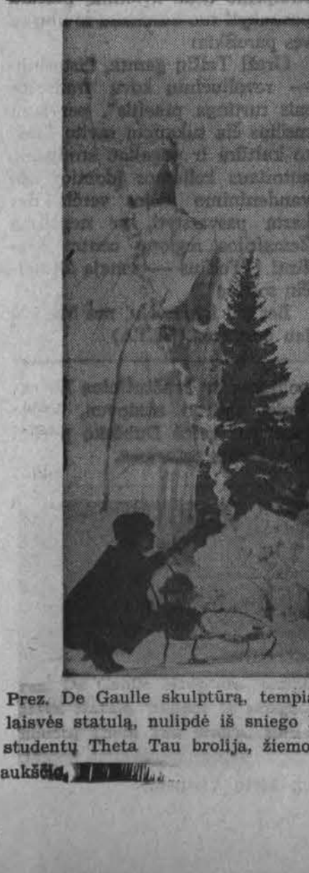
Prez. De Gaulle skulptūra, tempiančią atgal į Prancūziją Amerikos laisvės statulą, nulipdė iš sniego Michigan universiteto technologijos studentų Theta Tau brolija, žiemos karnavalui. Statula yra 27 pėdų aukščia.

Šiais metais Sv. Kazimiero šventę kartu švęs net trijų kolonijų vyčiai: Pittsburgho, Youngstowno ir Clevelando. Šventės šei mininkais bus 19-ta Pittsburgho kuopa. Vyčiai savo globėjo Sv. Kazimiero šventės proga stengiasi nugalėti visus kelionės sunkumus, kad tik didesniais būriais galėtų priimti Sv. Komuniją ir tu rėti bendrus pusrėčius, kurių metu būna pasakytos gražios kalbos, prisiminta organizacijos praeitis ir apžvelgti dabarties darbai savo tautos ir Bažnyčios labui.