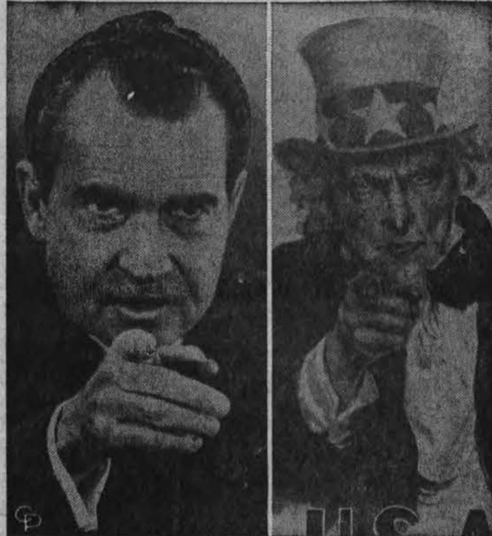
Prez. Nixon spaudos konferencijoje vienu momentu labai panašiai atrodė į plakatą "Uncle Sam Wants You."