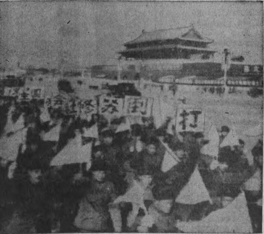
Kina demonstruoja prieš Sovietų Sąjungą vienoje Pekino aikštė. Visame krašte demonstracijose dalyvavo milijonai gyventojų. Penktadienį tūkstančiai maskviečių daužė Kinijos ambasados Maskvoje langus.