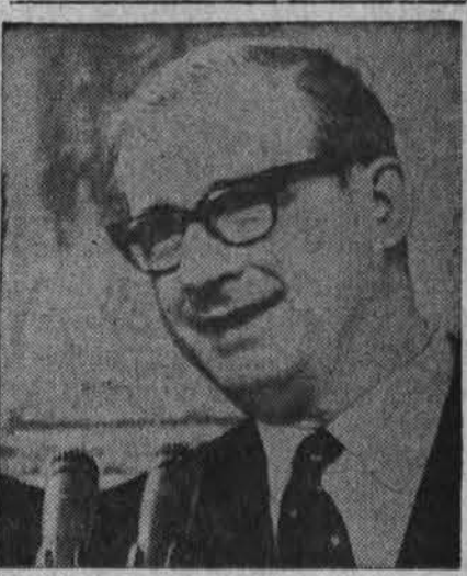
Aeronautikos ir erdvių administracijos direktorium pakviestas dr. Thomas Paine, dirbęs jau ir ankščiau toje įstaigoje.