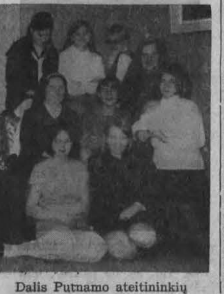
Dalis Putnamo ateitininkų