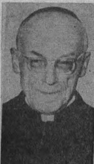
Kard. J. Frings, pasitraukęs, 60 m. dirbęs Katalikų Bažnyčiai, kovojęs prieš nacius