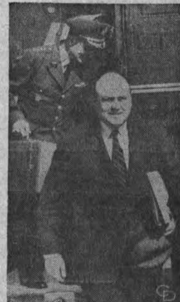
M. Laird, JAV gynybos vadovas su gen. E. Wheeleriu lankosi P. Vietname. Tai, ką jie patirs, nulems Washingtono sprendimą — kurio būdu smogti S. Vietnamo, Vietkongo komunistams.

● Dr. Kingo įtarimas žudikas, J. Ray, kaip vakar paskelbta, prisipažinąs kaltu.