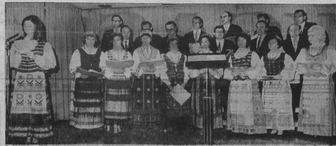
Vyčių choras dainuoja Vasario 16-sios minėjime Brighton Parko kolonijoje, Chicagoje, vasario 3 d.