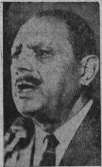
M. Ayub Khan, Pakistano prezidentas, vakar pasitraukė