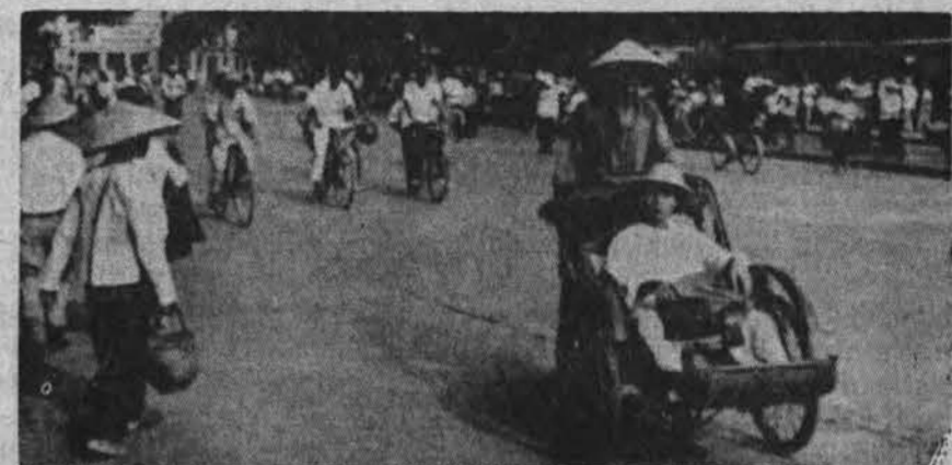
Šių dienų Saigone — be automobilių, matyti ir įprastines "rikšos" ir plačiai naudojami dviračiai.

Oro biuras praneša: Chicagoje ir jos apylinkėse šiandien debesuota, atšalęs oras, temp. sieks 30 ir daugiau l. F., ryt — iš dalies saulėta, be pakitimų. Saulė teks 5:44, leidžias 6:09.