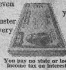
You pay no state or local income tax on interest.

Think about Savings Bonds for your retirement. One $25 Bond a month would be a pretty good start. It's not only a way to insure money for retirement. It's a way to insure retirement.