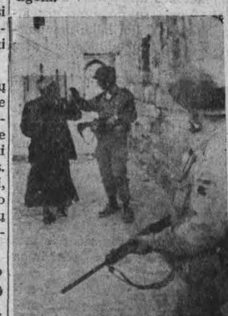
Vietname P. Vietnamo miestų — kariai ir vietos gyventojai

• Havajuose, Oahu saloje, su Honolulu miestu, 10% gyventojų, arba apie 56.700, serga astma ar šienlige, arba ir abiem ligom.