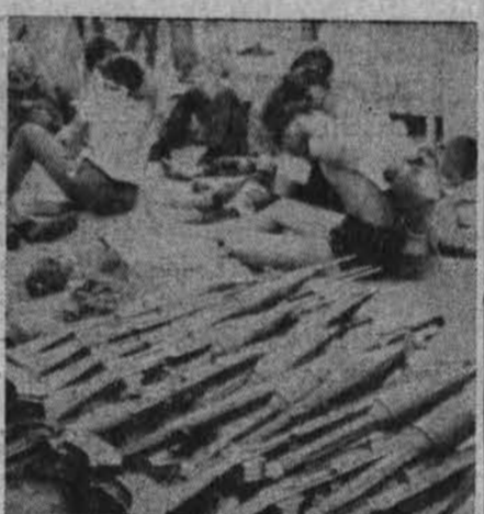
JAV kariai vis suseka priešų ginklų ar maisto atsargas

• 106 mil. auto vairuotojų JAV-se — neseniai paskelbta. Tiksliau, gyventojų, turinčių teisę vairuoti autovežimius dabar yra 105.700.000. 12% vairuotojų, tai gyventojai tarp 20 ir 24 metų amžiaus.