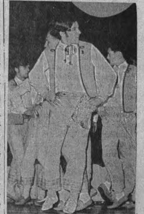
Zilviniečiai šoka Vasario šešioliktosios minėjime Philadelphijoje.