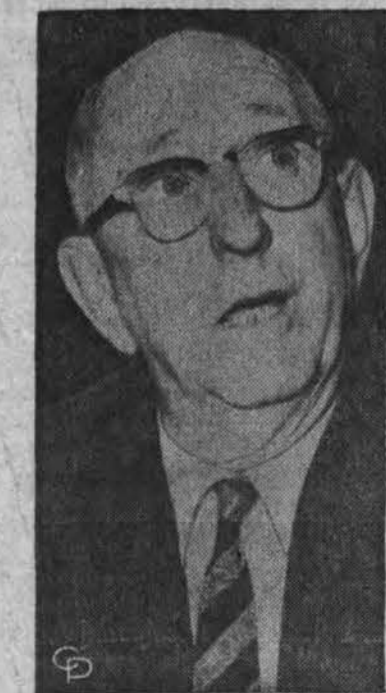
Richard B. Russell, vienas įtakingiausių senatorių JAV kongrese, pranešęs turįs plaucius vėžį, jis tikisi senatoriaus pareigose būti ligi 1972 m.