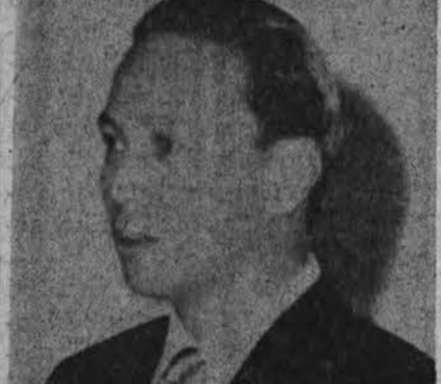
P. Vietnamo prezidentas Van Thieu — naujasis vingis politikoje

Būdinga ir tai, kad Van Thieu pasisakė esąs patenkintas santykiais su JAV delegacijos Paryžiaus pasitarimuose pirmininku H. C. Lodge. Tie ryšiai esą sklandesni kaip su buvusioju amerikiečių delegacijos vadovu Harrimanu.