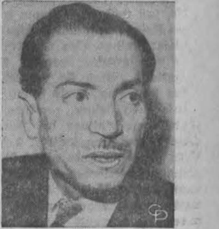
Naujasis Jordano min. pirm. Abdel Moneim Rifai, 52 m.