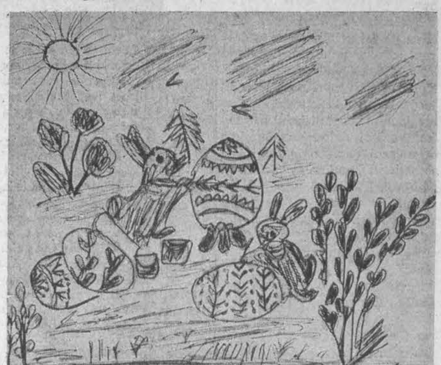
Kiškelių menas. Piešė Vytautas Gudis, Marquette Parko Lit. m-los IV sk. mok.

"Ziburėlis" Cicero Aukšt. lit. m-los laikr. nr. 10.