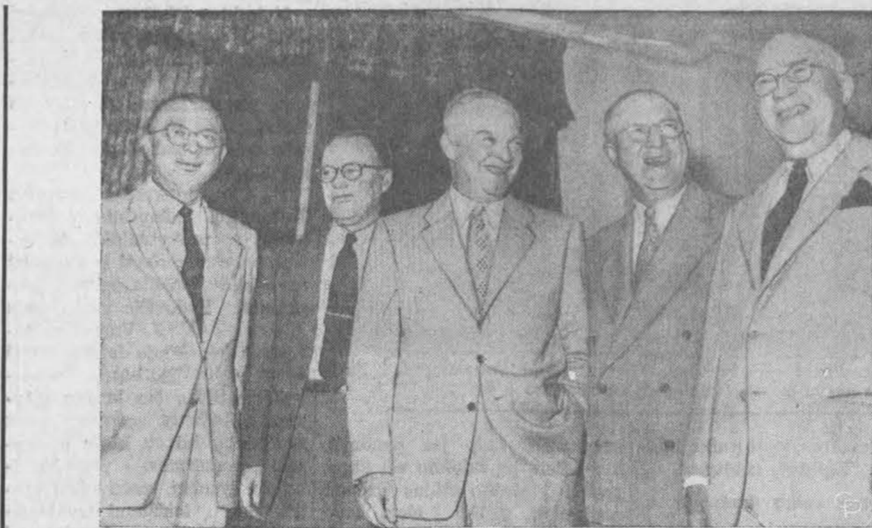
Miręs buvęs prez. Eisenhoweris su savo broliais 1952 m. Iš k. d.: Milton, Earl, Dwight, Arthur ir Edgar.

Jau eilę metų žlugdomi Valstybinio grūdų produktų ir kombinatų pašarų pramonės komiteto objektų statybos planai. Negerėja padėti ir šiemet. Nors Statybos mi-