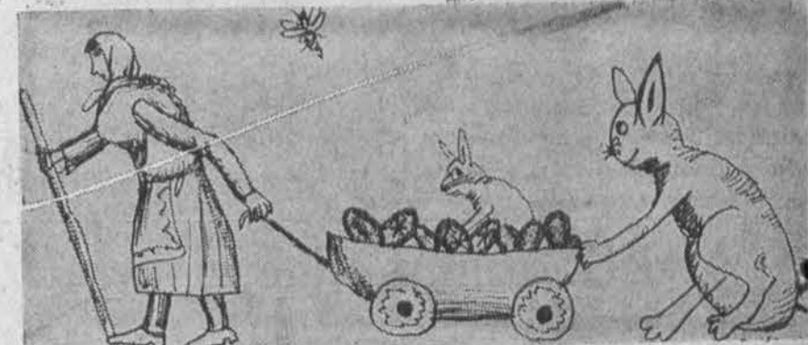
Mes čia vežam margučius. Pas geruosius vaikučius. Piešė Vytenis Senuta, Brockton, Mass. 10 m.

Isteigtas Lietuvių Mokytojų Sąj. Chicago's sk. Red. J. Placas. Medžiaga siūsti: 7045 So. Claremont Ave., Chicago, Ill. 60636