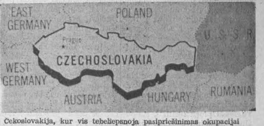
Čekoslovakija, kur vis tebeilpsnoja pasipriešinimas okupacijai

Čekų - slovakių ledo ritulio komandai kovo 28 d. Stockholme antrą kartą laimėjus prieš rusus, Čekoslovakija vos nelaimėjo varžybų laimėtojo vardo. Tačiau čekams prakišus švedų komandai, pirmoje vietoje atsidūrė ir varžybas laimėjo Sovietų Sąjunga.