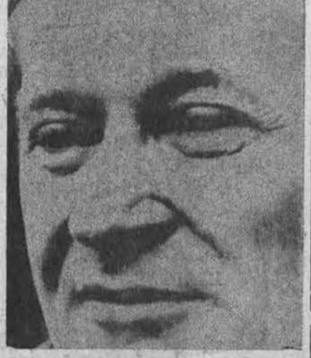
A. Dubčekas - jo režimas smarkiai puolamas Maskvoje

Žiniomis iš Prahos, Mlada Boleslav vietovėje, 30 m. atstumu nuo Prahos, kur įsikūrusi stambi rusų karių įgula, išdaužytas