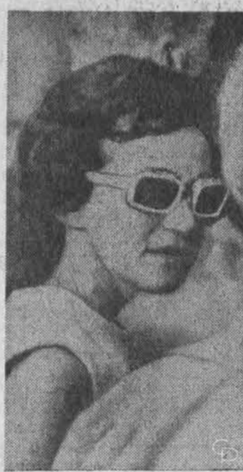
Dr. C. Barnard žmona paneigia gandus, kad pora skiriasi. Dr. Barnard yra pagarsėjęs širdies perkėlimo specialistas.