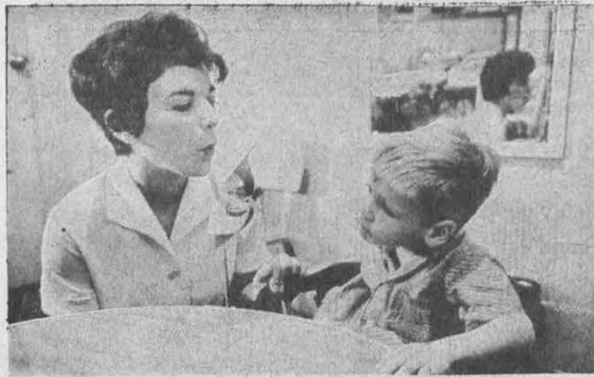
Velykų ženklukų vajas vykdomas paralyžuotiems vaikams padėti. Su ju vienu čia matyti globėja. Vajas bagiasi balandžio 6 d.