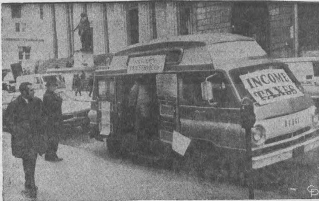
Pajamų mokesčių atsiskaitymas tiek svarbus, kad New Yorke kursuoja mokesčių užpildymo sunkvežimėlis, patarnaujantis gyventojams.