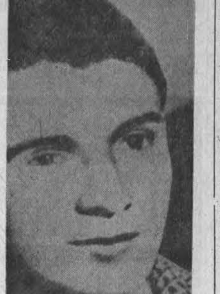
Susidegines J. Palach, Maskvos nuomone, sukurstęs čekų "provokacijas"

MASKVA. — "Pravdos" puolimai, aišku, paskelbti ne be Kremliaus žinios. Laikraštis, be "nacionalizmo", vėl iškėlė įprastinį kaltinimą — visi tie veiksmai Prahoje ir visame krašte,