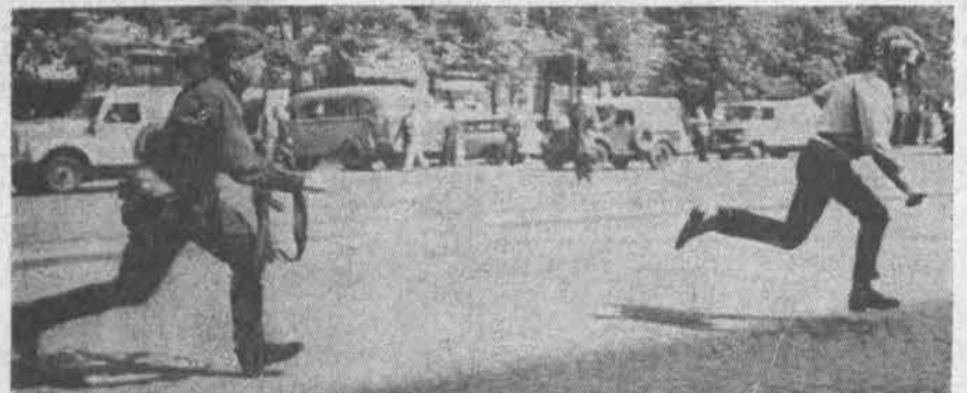
Pernai buvęs vaizdas: sovietų okupantas persekioja čekus. Šiandien gyventojai puola okupantą.

Todėl ir sovietinių komisijų pranešimai, kad balsavo 99.7 ar net 99.99 procentai, nesukelia pasitikėjimo. Bet, jeigu pastarasis pranešimas apie balsavimą Lietuvoje bent proporcingai laikėsi faktinių skaičių, tai tas rodytu, kad ir neatėjusių balsuoti, ir balsavusių "prieš" miestuose buvo keleriopai daugiau, negu kaimuose. (ELTA)