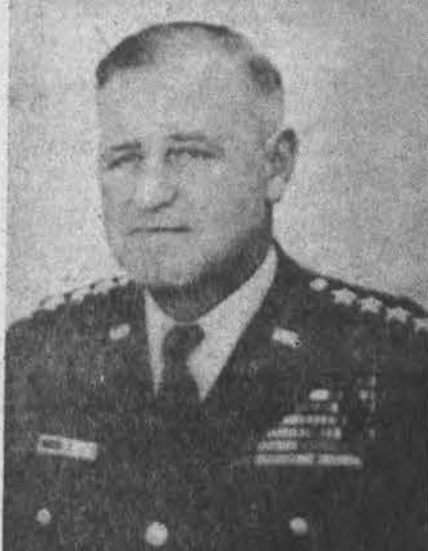
Gen. Abrams, JAV karinių dalinių vadas P. Vietname

Vienintelė reikšminga informacija iš pranešimo apie tą balsavimą yra balsuotojų sąrašuose įra-