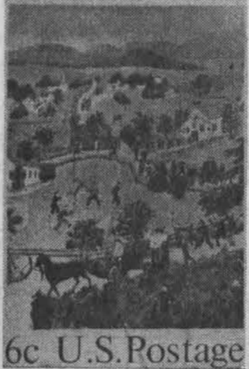
6c U.S. Postage

Tokį pašto ženklą išleis Amerika, pagerbti dailininkei Grandma Moses.