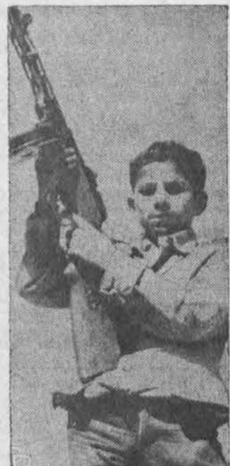
Arabų jaunuoliai apmokomi naudoti ginklus. Čia vienas jų ties arabų stovykla Jordane