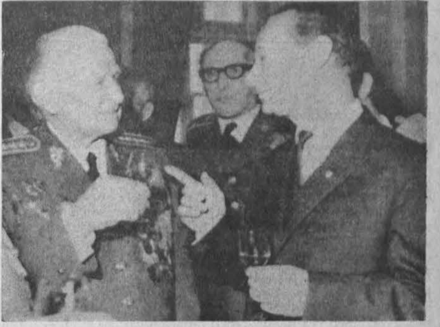
Čekoslovakijos prez. L. Svoboda (kairėje) su A. Dubėku

Jis pridūrė, kad, galimas dalykas, Pekine balandžio 1 d. prasidėjęs Kinijos kom. partijos suvažiavimas galės išryškinti naująją "Azijos milžino" užsienio politikos kryptį. Vis dėlto, JAV vyriausybė ir geresnių santykių su Pekinu siekdama, nelinkusi juos išnaudoti tiek, kad tai pakenktų krašto santykiams su Sovietų Sąjunga.