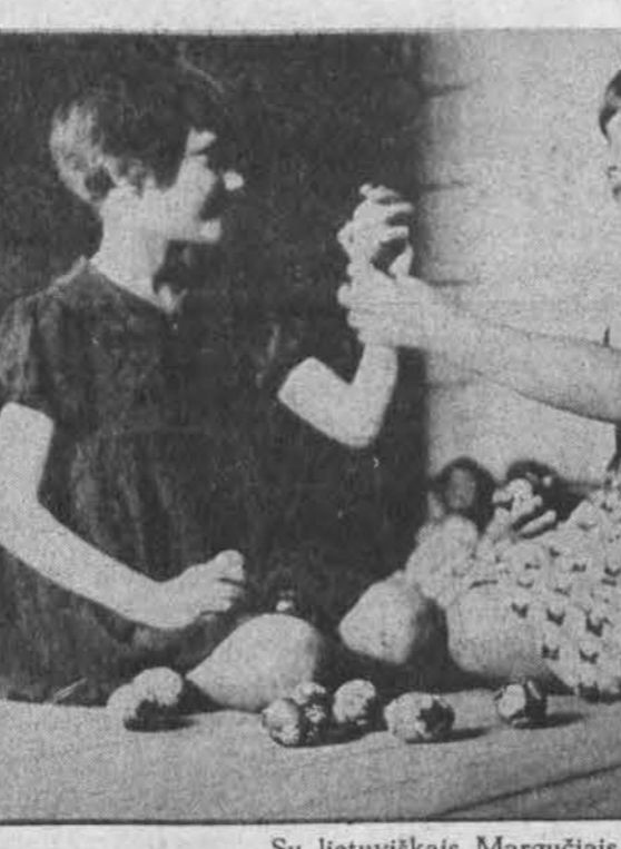
Su lietuviškais Margučiais

Isteigtas Lietuvių Mokytojų 8-gos Chicagojos sk. Red. J. Plačas. Medžiaga siūsti: 7045 So. Claremont Ave., Chicago, Ill. 60636