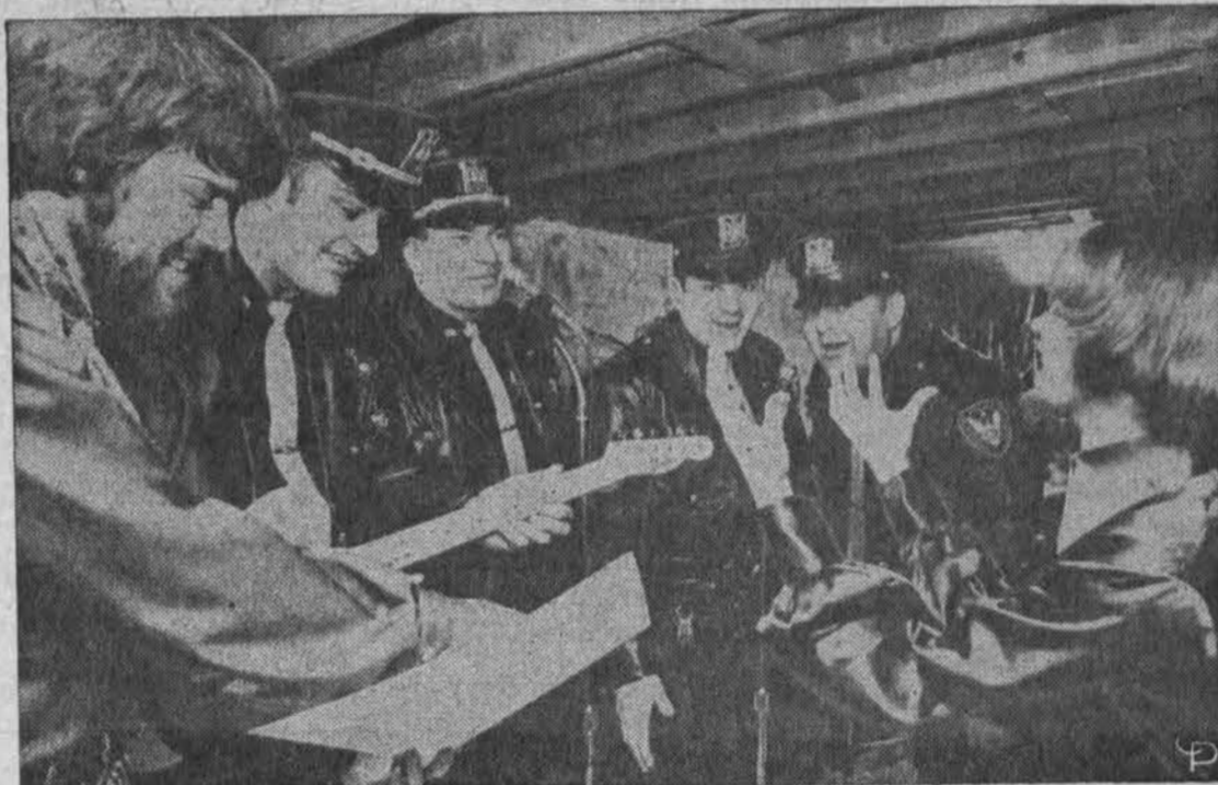
Chicago policininkai su jaunimu, kuriems suruošė šokius. Dalyvavo 2,300 jaunimo. Taip norima gerinti jaunimo ir policijos santykius.

Bet štai žmonės sužiūra i jaunus vyrus, kurie šaligatvyje neša Amerikos vėliavą ir didelį plakatą: "Ši demonstracija yra (Nukelta i 5 psl.).