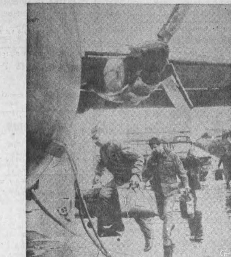
Tai įvyko praėjusią savaitę: lakūnai lipa į karinį lėktuvą Tachikava bazėje Japonijoje. Ieškota numušto žvalgybinio lėktuvo ir jo įgulos, tačiau per savaitę tesurasti du lavonai ir viena kita smulki lėktuvo dalis.

— Žmonijos žinynas 1966 m. buvo 16 kartų didesnis už turimas žinias 1800 m. Šiuo metu pasaulyje kas minutę pasirodo leidinys iš chemijos mokslų srities, kas penkios minutės medicinos knyga. Tokius davinčius neseniai pateikė Vakarų Vokietijos Darbo Įstaiga krikšč. dem. darbininkų kongresui. Toliau nurodoma, kad šio žmonijos žinyno (greičiau žinių skelbimo) apimties didėjimo greitis. Beveik per visą 19 šimtmetį toji apimtis padvigubėjo. Paskutinis padvigubėjimas įvyko tik per šešerius metus, 1960-66 m. laikotarpyje. (vb)