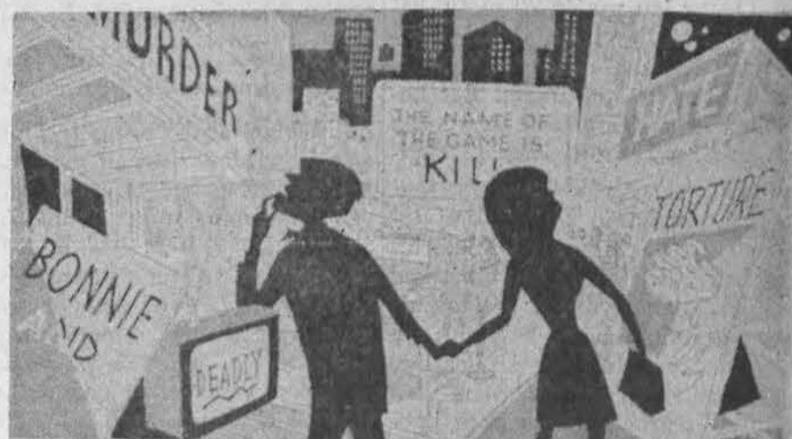
Šių dienų Vakarų didmiesčiuose: filmų srity tebevyrauja nusikaltimai, mirties vaizdai, įvairūs iškrypimai.

Dvieju numušto lėktuvo įgulos narių rasti lavonai atgabenti į laivyno bazę Sasebo, Japonijoje. Kitų įgulos narių lavonų ieškojimas sustabdytas. Teigiama, kad nėra jokių abejotimų žuvusiems visiems numušto lėktuvo įgulos vyrams.