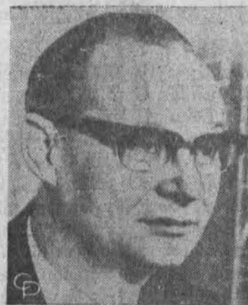
A. Dubček, taip jis atrodė, pavargęs, balandžio mėn. vidury jį nušalinus iš partijos vadovo pareigų.

Ką kūrį Prahos krautuvų languose buvo matyti A. Dubčeką nuotraukos. Tradicinėje tautos nuotakų reiškinio vietoje, ties šv. Vavlovo paminklu užva-