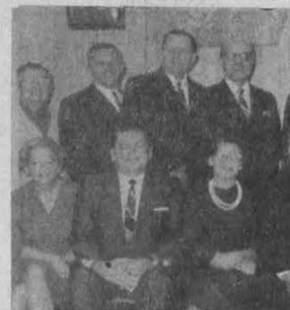
Šv. Kryžiaus parapijos Daytono, Ohio taryba; susirinkimai daromi kas mėnesį.

Li tikėtis, kad procesija per porą minučių paims ir susiorganizuos. Dekanas gi šypstelėjo ir liepė paskelbti. Ir koks buvo mano nustebimas, kai per keletą minučių vyrų susirinko, susiorganizavo ir padarė neblogesnę už kitas procesijas. O taip nepavyktu daugelyje kitų tautų bažnyčiose. Juk yra tautų ir vietų, kur reikia paskirti kiekvieno paprašyti. Čia, žinoma, daug reikiama žmonių išauklėjimas, bet neužmirštinas ir tautinis charakteris.