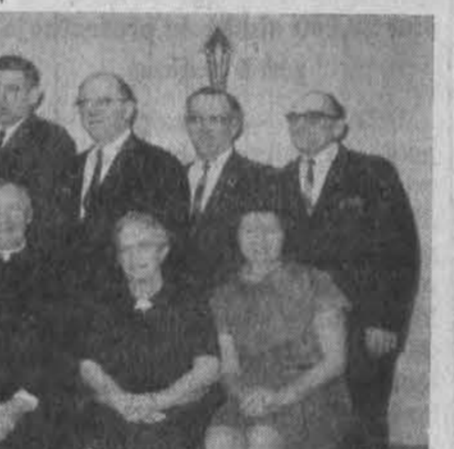
Šv. Kryžiaus parapijos Daytono, Ohio taryba; susirinkimai daromi kas mėnesį.

Asmeninis pokalbis su žmogumi yra pats svarbiausias dalykas beorganizuojant parapiją, visuomeniniam, labdaros darbi ar net liturginiam dalyvavimui. Kartą paskelbus reikalą ir paprašius savanorių laišku rašymui, nesulaukta nė vieno savanorio. O asmeniškai paprašius nė vienas neatsisakė. Asmeninį kontaktą gerai atlika parapijos tarybos nariai, organizacijų vadovai ar kiti parapijos varovo paprašyti žmonės.