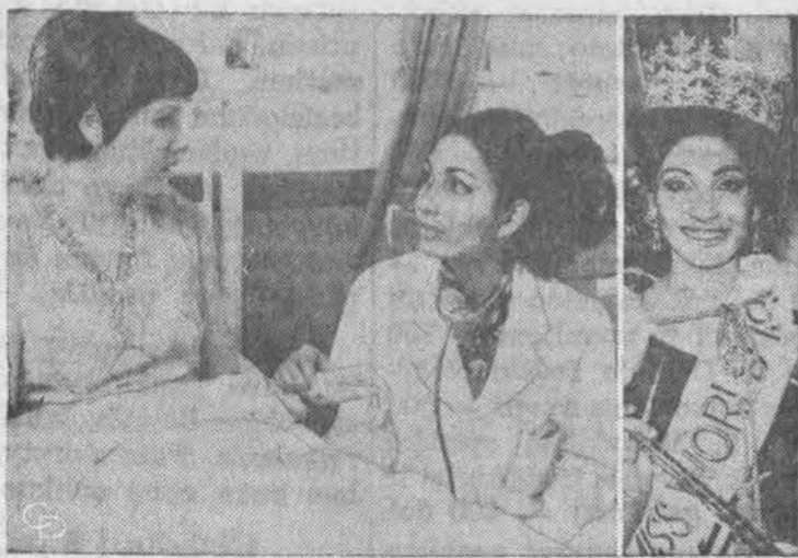
Reita Faria, pasaulio gražuolė 1966 m., baigė Anglijoj medicinos mokslus ir ji čia matyti apžiūrinti vieną pacientę Kongs kolegijos ligoninėje, Londone, Anglijoje.