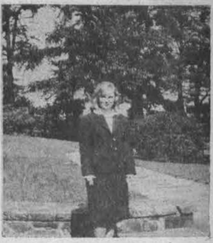
Suomė — turistinio autobuso palydovė

Š. Korėja kaltina JAV-bes: jų laivai apšaudė Š. Korėją, į šiaurę nuo demilitarizuotos sienos. Valst. departamentas vakar neatsakė į kaltinimus.