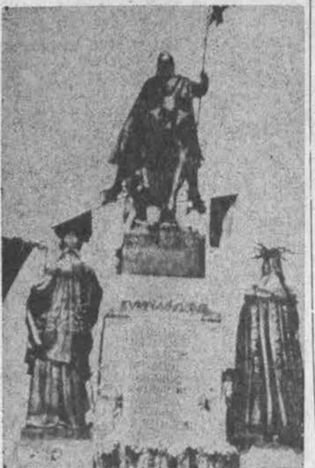
Šv. Václavo paminklas Prahoje — tautinė šventovė

Čekoslovakijos laisvėjimo žmonės, liberalai, kiek atsigavę po balandžio 17 d. įvykių Prahoje, šiuo metu vertina padėtį ir svarsto: ar lauktina Novotno tipo re-