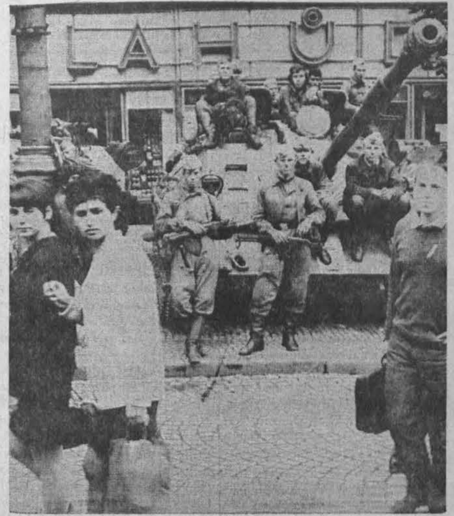
Gyventojų įniršis Čekoslovakijoje neatslūgsta, ypač nerimsta studentai

Pernai Prahoje vykus gegužės 1-sios žygiavimams, gyventojai gaivališkai buvo sveikinę tuometinį partijos vadą Dubčeką ir jo paskelbtas laisvėjimo reformas.