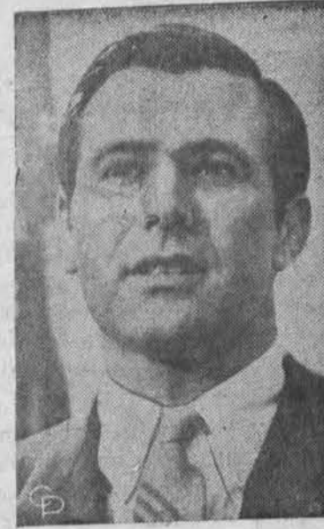
Donald Rumsfeld (R.-Ill.) prez. Nixono pakviestas ekonomijos direktorium. Sakosi pasitraukis iš kongreso.

— Domėtis šios rūšies vaikų auklėjimu, mokyklėlių išlaikymu ir maloniai visus kviečiu atsilankyti balandžio 27 d. nuo 2 iki 5 val. į Varnas Montessori Vaikų židinėlį, 3038 West 59