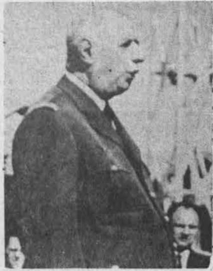
Prez. de Gaulle laukia bal. 27 d. atsilaukimo — ar jis laimės?