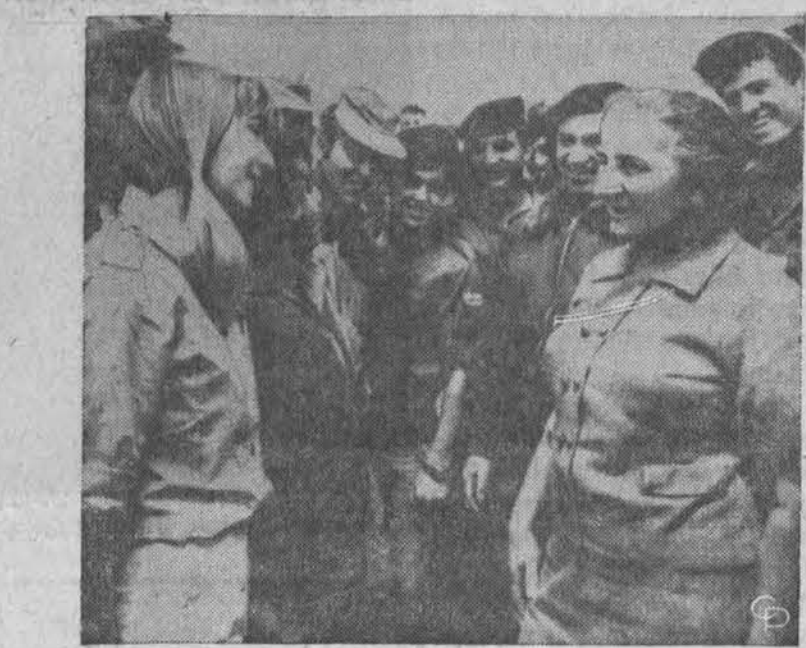
Israelio min. pirm. Golda Meir lanko moterų karių dalinius prie Suezio kanalo.

Kad didėjantis agresyvumas veda į atominį karą, Rusijos valdovams neabejotinai aišku. Ryšium su tuo pavojum didelis nesutarimas kariniuose sluoksniuose buvo pasireiškęs dar 1961 m. Tačiau 1965-66 m. vyko labai atviras "kietos laikysenos" išsakymas. Rusų karinėje spaudoje pasirodė visa eilė straipsnių, įrodinėjančių, kad atominio karo atveju rusai gali laimėti, nes tai priklauso nuo tobulesnio apsiginklavimo, ir peikiančių siūlymus atmesti tokio laimėjimo galimybę, kaip pasidavimą pesimizmui ir neveklumui. Vėlyvesnieji rusų pasisakymai buvo karinesni ir pralenkė netgi Chruščiovo Kubos krizės metu aidėjusius išsūkius.