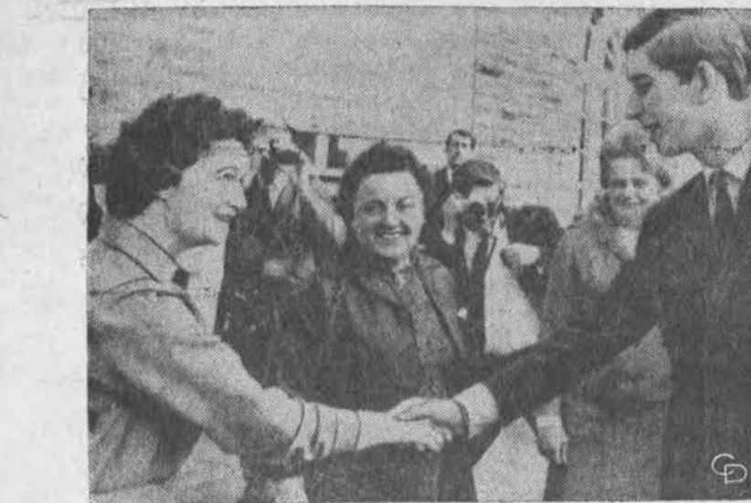
Britanijos princa Charles sveikina Wales kolegijos pareigūnė, į kurią princas atvyko 9 savaitėjų studijoms. Oficialiai princas į karališkąją šeimą bus įvedintas liepos 1 d.

HOURS: Mon 12 P.M. to 8 P.M., Tues. 9 to 4, Thurs. & Fri. 9 to 8, Sat. 9 to 12:30 2 FREE PARKING LOTS