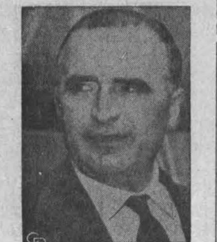
G. Pompidou, buvęs Prancūzijos min. pirmininkas, įsitikinęs būsiąs gen. de Gaulle įpėdiniu.

Oro biuras praneša: Chicagoje ir jos apylinkėse šiandien iš dalies saulėtai, šilčiau, temp. sieks 50 ir daugiau I. F., ryt — debesuota, šilčiau. Saulė teka 4:57, leidžias 6:41.