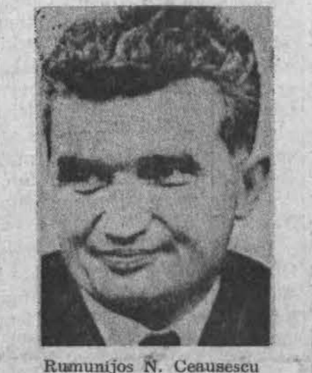
Rumunijos N. Ceausescu

Tas ūkinis bloko narių integravimas — suliedinimas, tai klausimas, kuriam daugiau ar mažiau priešinosi ir kiti bloko nariai. Išimti tesudaro R. Vokietija, su kuria Maskva skubiai vykdo bei plečia specialius,