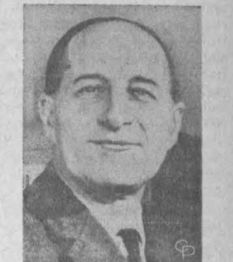
Siaurės Airijos premjeras Terrence O'Neill pasitraukė iš posto. Jis yra Unionistų partijos pirmininkas.

Roma. — Popiežiaus Pauliaus VI-jo nutarimas birželio mėnesį dalyvauti tarptautinės Darbo organizacijos Konferencijoje Zenevoje, Šveicarijoje, visame pasaulyje susilaukė didelio dėmesio ir priitarimo. Tarptautinės Darbo organizacijos generalinio direktoriaus David Morse, komentuodamas Šv. Tėvo nutarimą, pareiškė, kad Šv. Tėvas, priimdamas Tarptautinės Darbo organizacijos kvietimą dalyvauti jos veiklos 50 metų minėjime Zenevoje, dar kartą parodė savo gilų rūpinimąsi viso pasaulio darbininkų gerove, kurios siekia ir tarptautinė Darbo organizacija. Popiežiaus vizitas Darbo organizacijos konferencijoje Zenevoje - pareiškė generalinis direktorius Morse — turės didžiausios istorinės reikšmės viso pasaulio darbininkams. Popiežiaus kelionė į Zenevą tiksli data dar nepaskelbta, tačiau žinoma, kad pagrindinis tarptautinės darbo organizacijos 50 m. sukakties minėjimas įvyks šių metų birželio 18 dieną. Kaip spėja didžioji pasaulio spauda, yra galima, kad Šv. Tėvas savo vizito Zenevo-