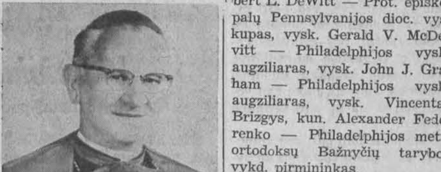
Philadelphiaje arkivyskupas kardinolas John J. Krol birželio 15 d. kalbės Sv. Petro ir Pavilo katedroje pabaltiečių ruošiamoje ekumeninės maldos dienos proga.