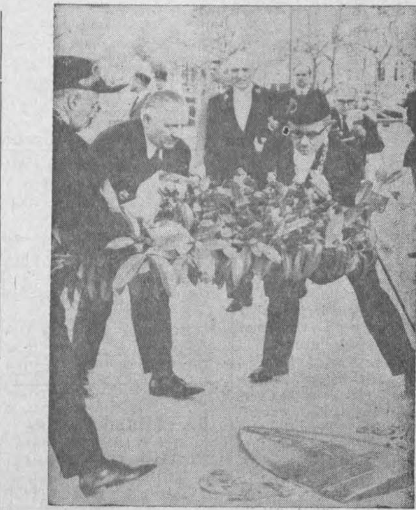
Prezidento pareigas einąs Prancūzijojej Alain Pœer kaip vieną pirmųjų veiksmų, pradėdamas pareigas, užveda vainiką ant nežinomojo kareivio kapo prie Triumfo arkos Paryžiuje.

WASHINGTONAS. — Gen. Marshall paskelbė, kad 40% Amerikos karių Vietname žūsta per įvairius apsirikimus. Jisai savo rašte teigia, kad mažasis vadovaujamas personalas, leitenantai, kapitonai ir seržantai yra silpnai Amerikos karo mašinos pusė Vietname. Gen. Marshall, 69 m., pasitraukęs į atsargą, pareiškė šiuos savo teigimus, ryšium su išeinančia jo knyga apie karą Vietname 1966-7 m. Jis teigia, kad daug amerikiečių karių partizanai įvelia į kautynes ir spąstus per vadų neapsižiūrėjimą. Iš viso jo tyrimo esą matyti, kad 40% karių žūsta per pačių amerikiečių neapsižiūrėjimą, skubą ar paprasčiausių atsargumo priemonių peržengimą. Ligi pastarosios savaitės Vietname jau žuvo 34,000 karių. Paklaustas generalas ar amerikiečiai kariai geri, palyginus su komunistų partizanais, jis atsakė, kad individualiai amerikietis karys džiunglėse labai gerai kovoja, o silpniausia vieta yra mažųjų dalinių vadai. Gen. Marshall pažymėjo, kad Amerika prarado šansus laimėti karą Vietname, sustabdžiusi bombardavimus. Esą, tai