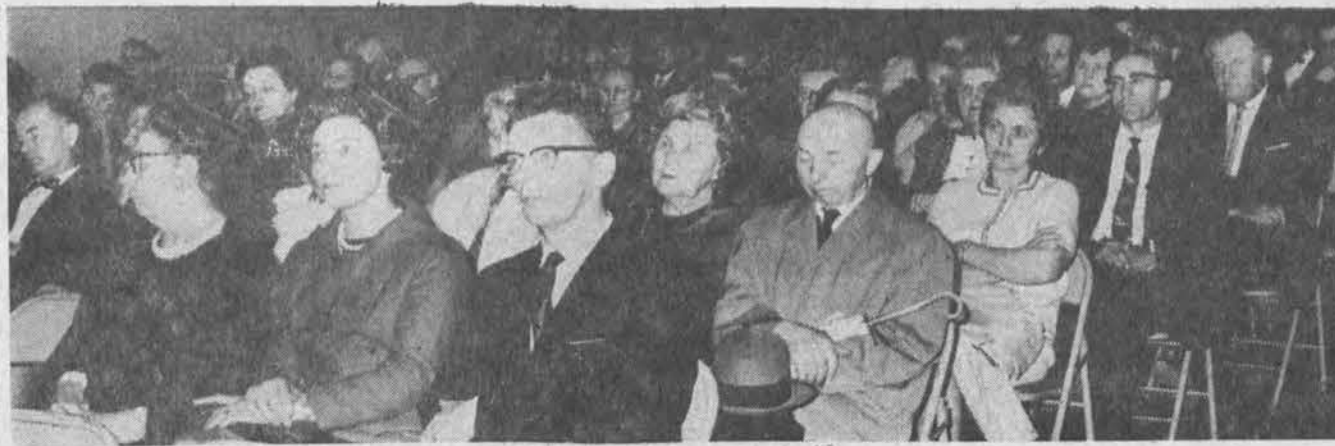
Dals Chicago visuomenės liet. religinės spaudės dienos metu

× Reikalinga moteris dienomis prižiūrėti vaikščiojančią ligonę. Marquette pke. Dėl sąlygų susitarsime. Skambinti HE 4-7001 (sk.)