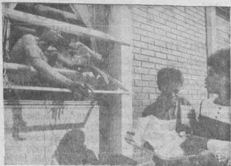
Is studentų sukeltų rausių Danmarke, S.C. Ginkluoti studentai, užėmę kolegijos knygyno patalpas, per langą siekia maisto, kurį atnešė jų rėmėjai.