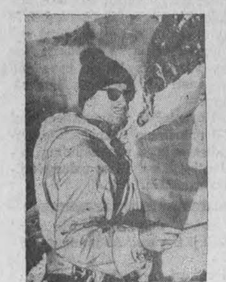
Siurpi tragedija ištiko amerikiečius alpinistus Himalajų kalnuose, kai jie bandė įkopti į 26.975 pėdų viršūnę. Šeši žuvo, kiti penki sužeisti, bet manoma, kad pasveiks. Matome vykstant gelbėjimo darbus.

VALDIS REAL ESTATE 2458 W. 69th St. RE 7-7200