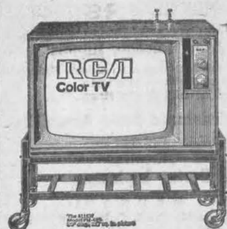
Table-top Color with Advanced "Locked-in" A.F.T.