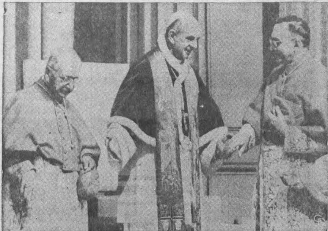
Šv. Tėvas Paulius VI sveikina Prancūzijos kard. Jea Villot (dešinėje), kuris paskirtas Vatikano sekretorium. Vietoj pasitraukusio kard. Cicognani (kairėje).