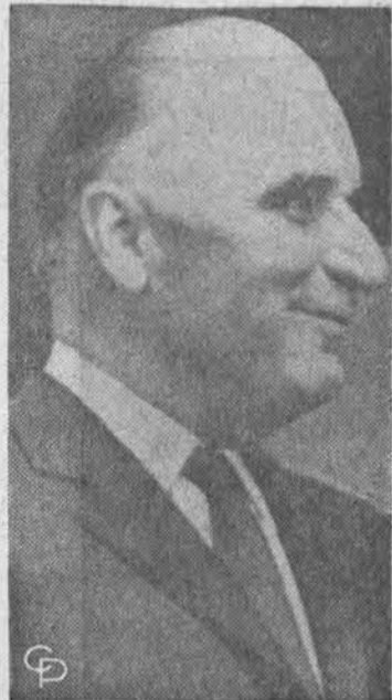
Georges Pompidou, kandidatas į Prancūzijos prezidentus

Praėjus žiemos šalčiams, gamta vėl pradeda atgyti - suža-