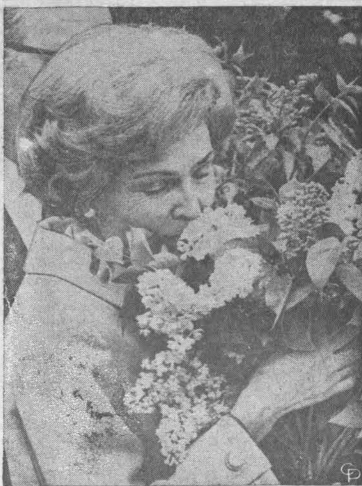
Prez. Nixon žmona džiaugiasi pirmaisiais naujai išaugintų alyvų žiedais.