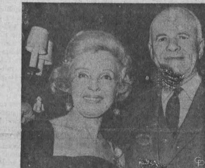
John Davis Lodge paskirtas JAV ambasadoriumi į Argentiją. J. Lodge, 65 m., buvęs aktorius čia matyti su žmona.

Thailando užs. reik. min. Kohman pareiškė, kad ir tada, kai baigsis karas Vietname, Amerika negalinti Thailando taip greit palikti, iš kitos pusės jis pareiškė, kad gali Thailandas siekti susitarimo su Kom. Kinija. Kiekvienu atveju sekret.