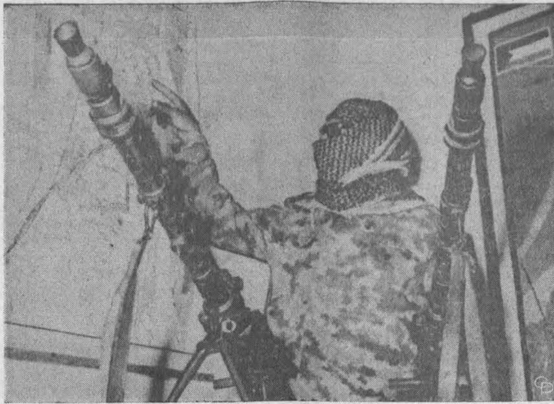
Izraelio - arabų kraštų santykiai kieti ir žiaurūs. Arabų partizanų organizacijos narys atseka žemėlapyje punktą prie El Hammah, Izraelio okupuotoje Sirijos dalyje, kur jis turi atlikti tam tikrą uždavinį.

Berlyne meldėsi už taiką Berlynas. — Pritariant Popiežiaus Pauliaus VI-jo pastangoms įgyvendinti taiką pasaulyje Berlyno katalikai kartu su protestantais buvo susirinkę Kankinių Karalienės šventovėje Berlyne bendrai maldai už taiką.