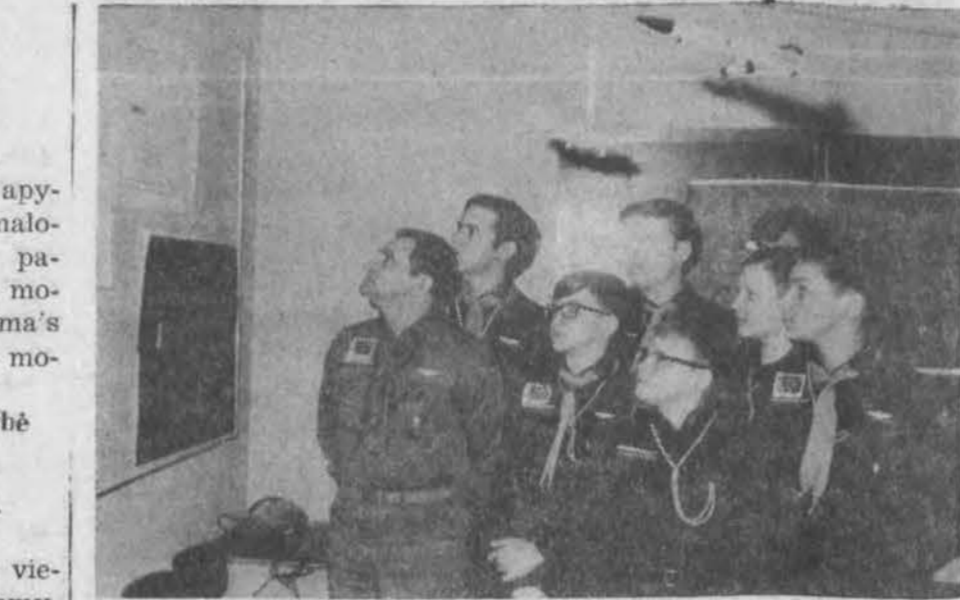
Lietuviai oro skautai Jaunimo centre Chicagoje turi įsirengę savo būklę, kuriame sutelkta nemaža lėktuvus liečiančios medžiagos. Čia matome vieną oro skautų skiltį savo būkle užsiėmimų metu.