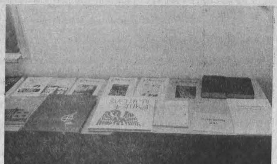
Kai kurie liet. Tėvų jėzuitų leidiniai religinės knygos parodos metu Chicagoje.

Pop. Paulius VI paskelbė Mariją Bažnyčios — Mistinio Kristaus kūno — Motina. Tai nauja paskata, ypač šiais audringais ir Bažnyčiai pavojingais laikais, dar karščiau ir nuoširdžiau kreiptis į Mariją, kad ji nugalėtų visas klaidas, kad neišleistų krikščionių iš savo motiniškos globos, kad jos širdis nugalėtų Kristaus mokslui pavojingą ateizmo ideologiją. O kai tas įvyks, tada ir mūsų tėvynė atgaus laisvę, kurios ji neteko kaip tik bedievybės įsigalėjimu pasaulyje. Šiandien Lietuvos katalikai, irgi pavesti Marijos globai, veda sunkią kovą už savo tikėjimą, už savo meilę Marijai. Ta meilė juos palaiko, juos stiprina. Padėkime savo maldomis jiems išverti iki galutinės pergalės, kada Nekalčiausioji Marijos Širdis galutinai viešpataus pasaulyje. Tai mums primena ir ragina daryti gegužės 13 dienos minėjimas.