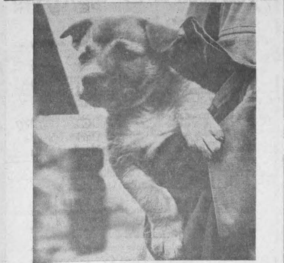
Dėl karo veiksmų Vietname kenčia ne tik žmonės, bet ir gyvuliai. Vienas JAV marinas rado mažą šunytį naštai, kurį priglaudė savo kišenėje.