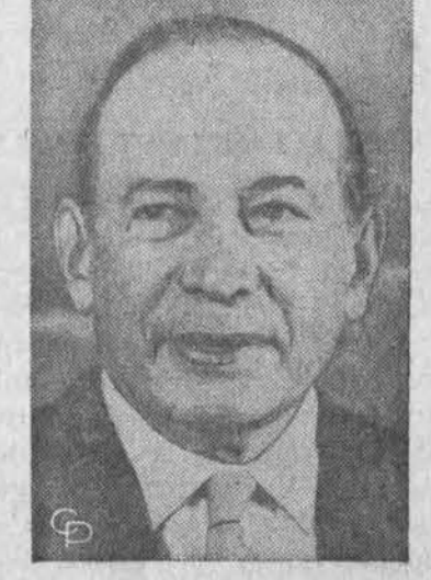
Apaučioje aukščiausio teismo teisėjas Abe Fortas. Viršuje Wolfson, sėdintis kalėjime už suktybes akcijų prekyboje.